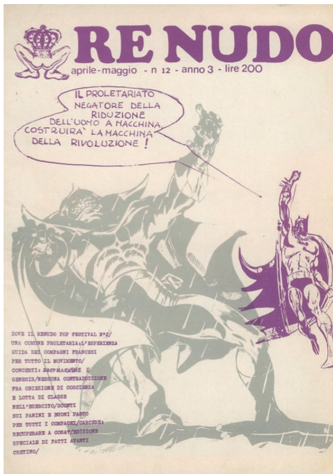
Fig. 4 - «Re Nudo», 1972, 12