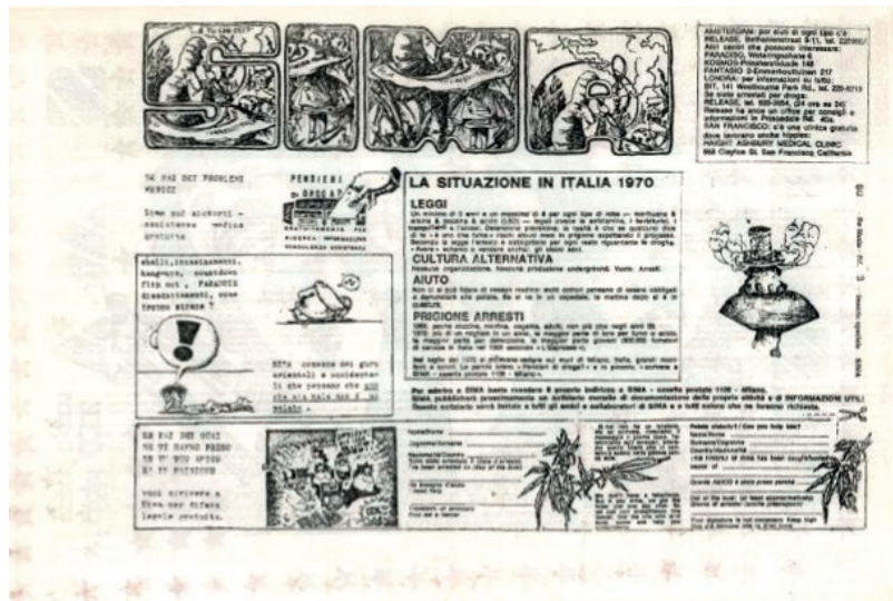
Fig. 3 - SIMA (Servizi Istituto Massa Media Art), 1970