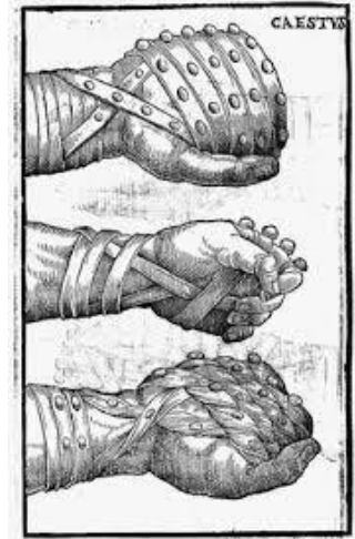
5. Girolamo Mercuriale, De arte gymnastica (1573) – Illustrations de Pirro Ligorio