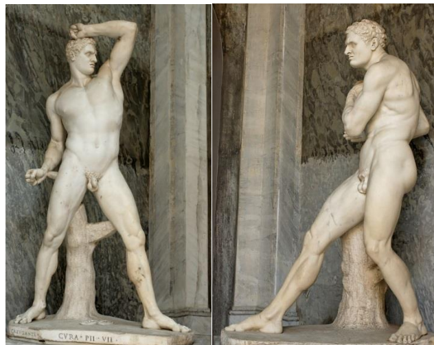
7. Antonio Canova, Creugas et Damoxène Sculptures en marbre (225 x 120 cm), 1801 et 1806 respectivement Musée Pio-Clementino, Vatican