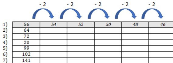
FIGURE 4. : Support adapté possible

Consigne : soustraire 2 à chaque nombre 5 fois de suite