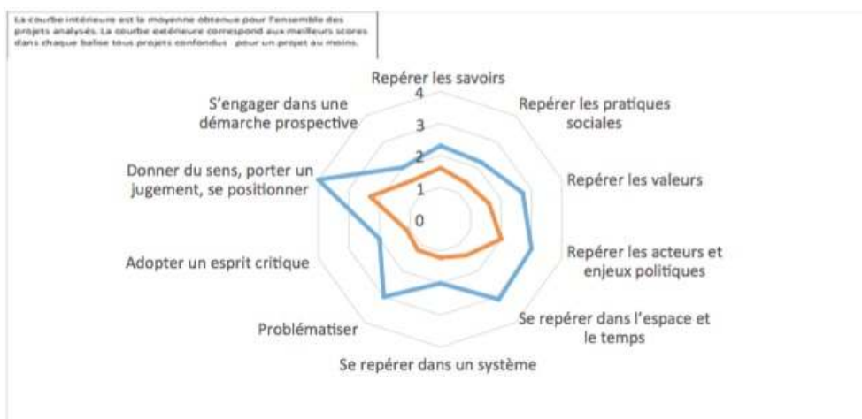
Tableau 4 – Radar représentant le niveau atteint par les 88 projets de prospective territoriale (Graphite, 2017)