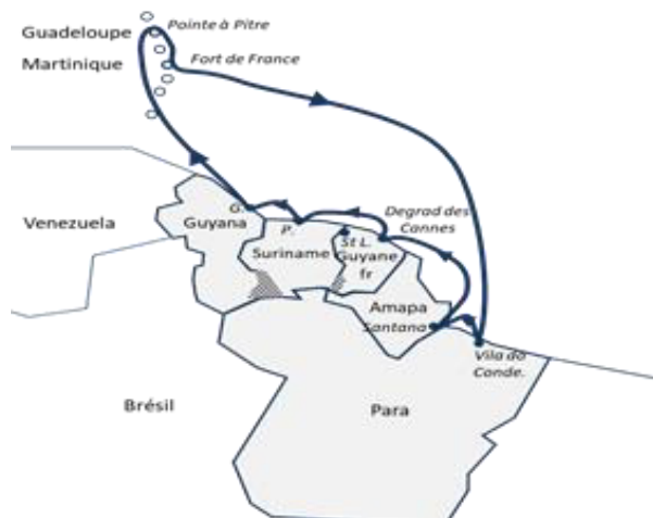
Figure 1 : Des connexions potentielles