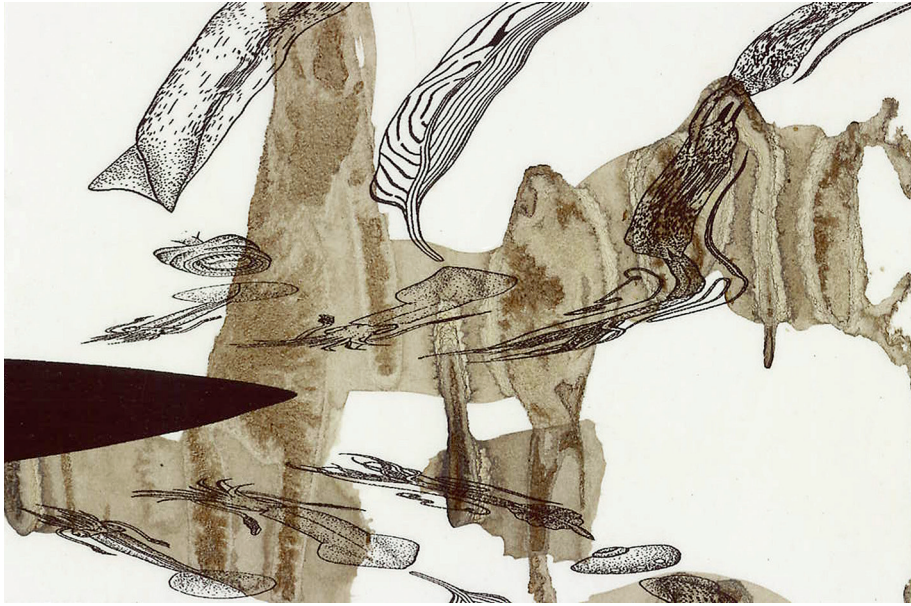
3. Figure de l'eau 03 , 2001, 27 × 18,5 cm, encre et impression numérique sur papier. © Jean Arnaud.