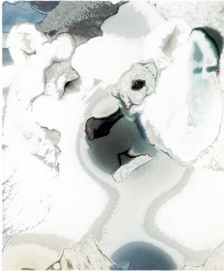
7. Pas vu 04 , 2010, 110 × 90 cm maximum, impression numérique sur papier aquarelle © Jean Arnaud.

plastiques et textuelles dans les œuvres, le récit en art contemporain est aussi le résultat d'une spatialisation d'éléments disparates dans l'exposition. Le récit visuel, plus récemment, se déploie également dans des formes nomades et intermédiaires, éclatées aux marges du cinéma et de l'installation, qui jouent notamment sur la mobilité du spectateur.