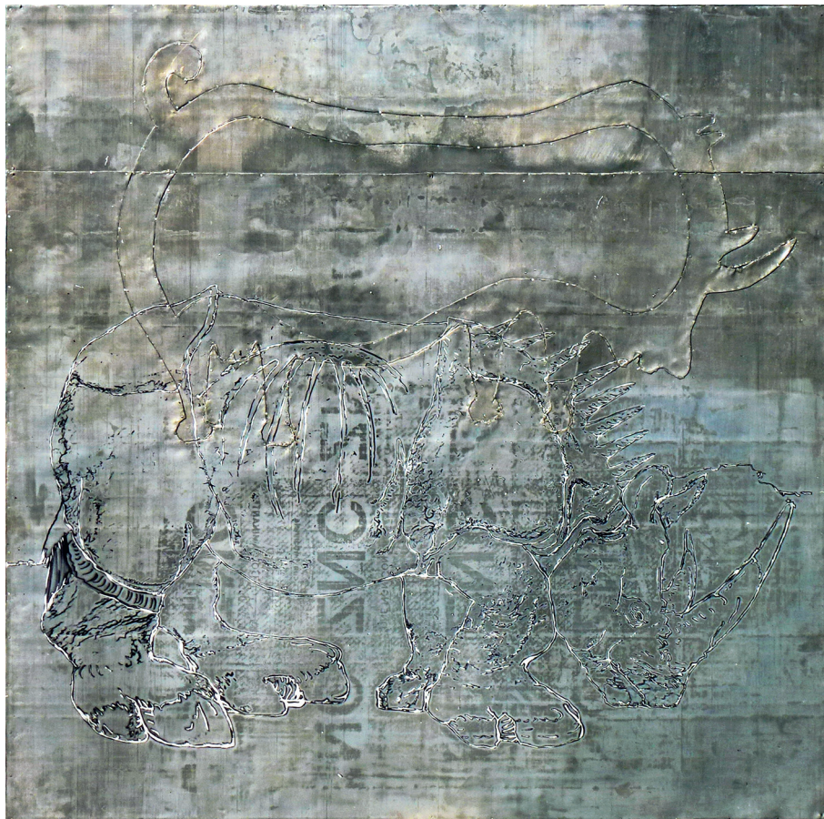
6. Rêve de plomb 06 (Ennedi-Transrhino) , 2013, 100 × 100 × 4 cm, impression numérique et peinture sur plomb © Jean Arnaud.

Entre productions plastique et universitaire, démêler et quantifier les parts du sensible et du cognitif, ou celles de l'art et de la science, n'ont pas grand intérêt, car elles recouvrent des formes d'inventivité interdépendantes. Selon ce type d'engagement, la recherche en arts existe aussi bien dans « l'atelier » que sur « le terrain » ou dans « le labo », ces localisations se situant en continuité. C'est sur cette base que le programme Interférences et récits , que je dirige jusqu'en 2017 au sein du laboratoire d'études en sciences de l'art à Aix-Marseille Université (LESA), propose globalement une analyse des phénomènes de migrations et de transferts entre les images, les œuvres, les spectateurs, les cultures et les supports, dans la construction du récit aujourd'hui. Autrement dit, son objectif général est d'étudier l'influence des nouveaux phénomènes d'interférences médiatiques et culturelles sur les structures du récit et ses modes de production, ainsi que leur incidence sur l'imaginaire actuel. Initialement conçu comme montage de diverses formes