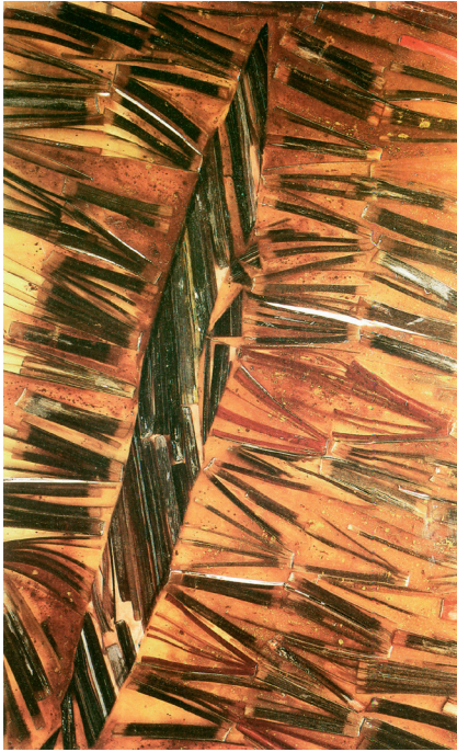
2. Pierre de rêve 03, 2001, 80 × 46 × 3 cm, résine et livres tranchés