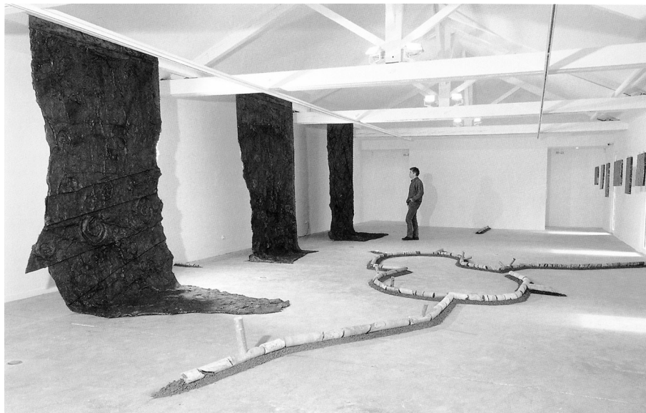
1. Vue de l'exposition Entretemps au centre d'art du CAIRN, Digne-les-Bains, 2001. De gauche à droite : Dépouilles , élastomère et graphite sur toile; Rhizomes , carottes géologiques, pigments et marnes noires; Pierres de rêve , résine et livres tranchés © Jean Arnaud.