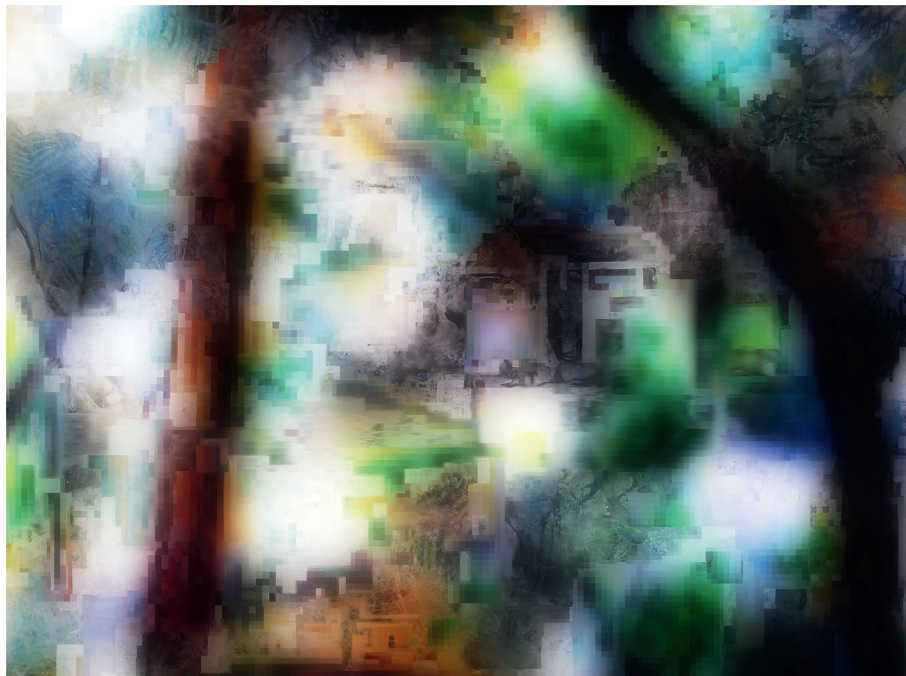
4. Saturation (arbre tordu 12) , 2010, 81 × 60 cm maximum, impression numérique sur papier mat © Jean Arnaud.

À ce premier niveau, la recherche en arts vise à éclairer diverses notions en créant de la connaissance par une pensée de l'entrelacs (faire/écrire ; œuvre plastique/texte ; avec/sur/en art 10 , etc.). Mais à un second niveau, l'inter-référence concerne la variété des domaines scientifiques convoqués dans le champ de l'art. Mes recherches sur les morphologies spatiales contemporaines, sur les structures du récit visuel ou sur la relation entre document et fiction, déterminent un champ référentiel principal en sciences humaines : poïétique, esthétique et histoire de l'art, anthropologie, sociologie et psychologie. Mais les artistes utilisent toutes sortes de connaissances ; pour ma part, elles sont puisées dans les sciences de la vie et de la terre, en morphologie ou parfois même en mathématiques. L'analyse des enjeux de son œuvre et de celles des autres par l'artiste lui-même ouvre donc à des domaines de recherche connexes, selon une méthodologie singulière. Autrement dit, ces inter-références scientifiques permettent aux artistes chercheurs, au-delà d'un cadre auto-réflexif, de nommer les opérations critiques contemporaines qu'ils contribuent à élaborer dans le champ anthropologique et socioculturel.