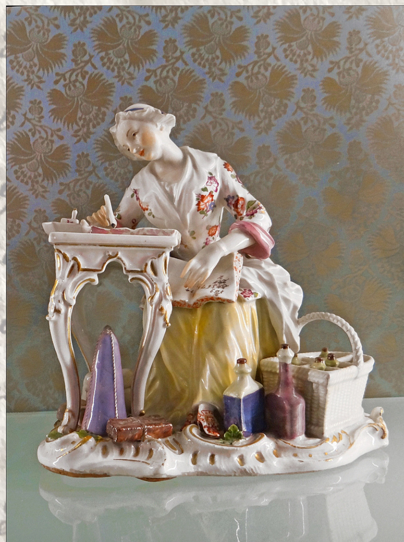
La Ménagère écrivant dans son livre de compte attribuée à Johann Kaendler (1706-1775) (Musée Cognacq-Jay, Paris)

Par exemple, la période du veuvage et celle de la Révolution offrent à ces femmes des occasions de s'affirmer dans leur rôle de cheffes de famille et de s'appropriier l'un des attributs de la puissance paternelle : l'écriture familiale. Réhabiliter la mémoire d'un époux disparu ou réaffirmer l'ancienneté de la noblesse de sa famille sont des actes par lesquels les nobles provençales contribuent à la mémoire familiale.