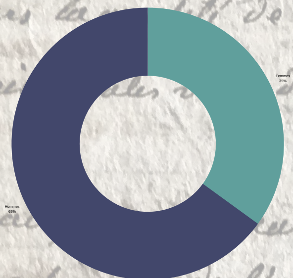
Fig. 1 : Proportion de femmes et d'hommes nommés dans le fonds Fresse de Monval (ADBR 248J)