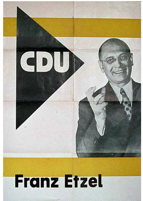
Franz Etzel, avocat, membre de l'Union chrétienne-démocrate d'Allemagne (CDU), ministre des Finances de la RFA.

Pourtant ces hommes se sont assis à la même table dix ans plus tard, mettant leurs différences de