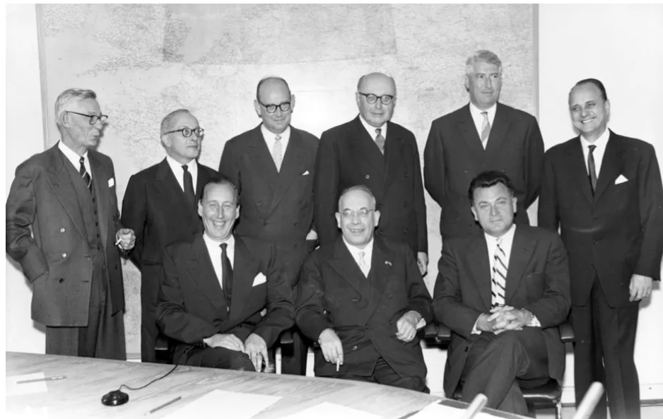
Photo de groupe de membres de la Haute Autorité de la CECA, de gauche à droite: Dirk-Pieter Spierenburg, Piero Malvestiti et Albert Coppé. Debouts, Paul Finet, Pierre-Olivier Lapie, Heinz Potthoff, Albert Wehrer, Fritz Hellwig et Roger Reynaud