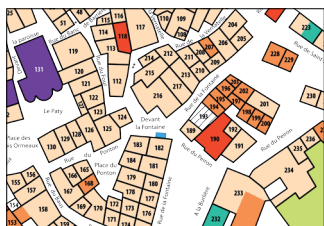
L'évolution de La Garde-Freinet de 1613 à 1746.