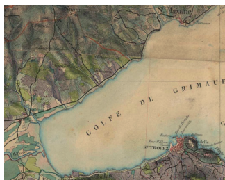
Comment aller de St-Tropez à Ste-Maxime : par terre ou par mer (XVI e -XXI e s.) ?