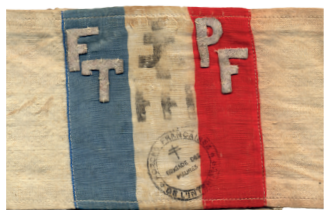
Les Maures, aux origines des maquis de Provence.