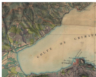
Comment aller de St-Tropez à Ste-Maxime : par terre ou par mer (XVI e -XXI e s.) ?