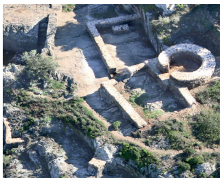
Autour du four à pain : un siècle de conflits entre seigneurs et habitants de La Garde-Freinet.