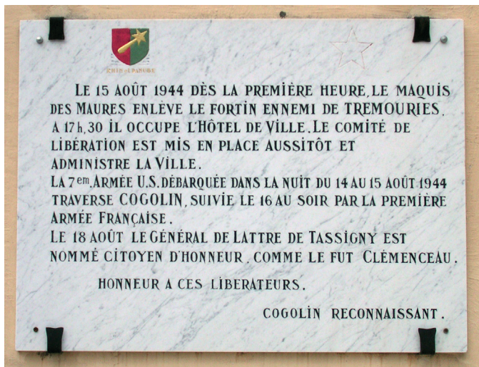
Cogolin, plaque de la Libération.