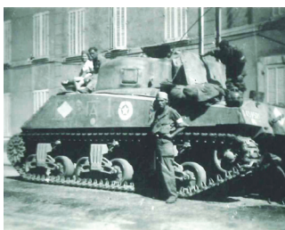
Vichy, la Résistance, la Libération sur le littoral des Maures (1940-1944).