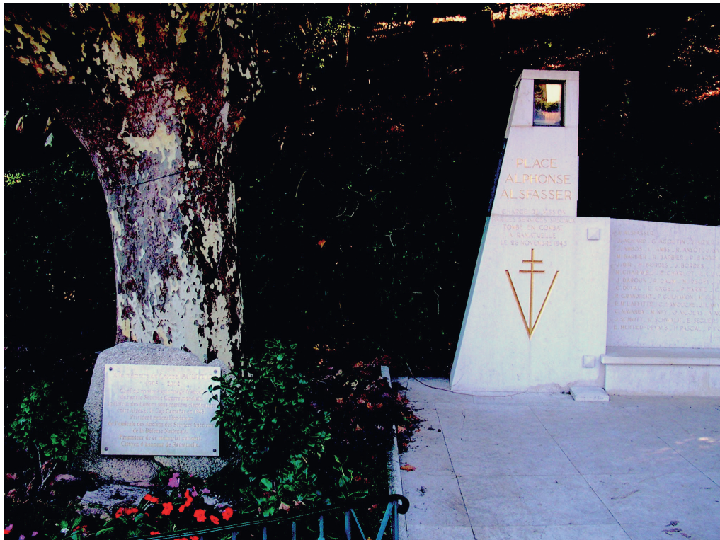
Ramatuelle, place Alsfasser.