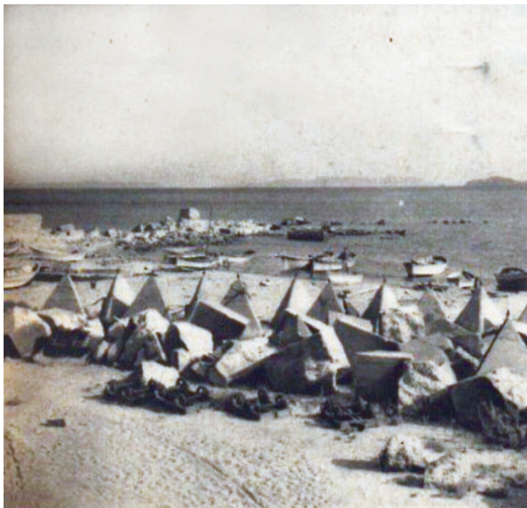
Cavalaire, plage avec tétraèdres (brochure Côte d'Azur, champ de bataille , 1945).

Au bureau, nous sommes de garde, seulement 2 employées, le père des jeunes filles du Casino ayant été arrêté L . Si vous le pouvez, écrivez moi... Je serai heureuse de vous lire [...] Quelles pénibles heures incertaines, nous disant " nous en tirerons-nous ? ". Tout autour de nous des trous de bombes. Dieu nous a épargné, remercions le du fond du cœur. Nous ne savons aucune nouvelle sur Toulon, Hyères, etc. Pas d'électricité, pas d'eau... la voie est abîmée... je ne sais quand reprendront les relations postales. Parrain vient chercher ma lettre, je vous laisse vite, vite. Tout le monde vous embrasse. De votre fille chérie qui a tremblé pour vous, recevez ses baisers les plus lourds et les plus tendres. Je vous aime de tout mon cœur. »