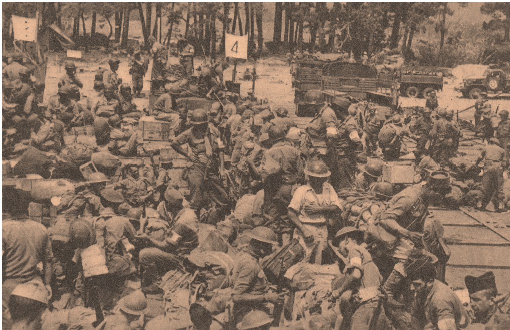
Cavalaire, débarquement de la 1 re DFL (brochure Côte d'Azur, champ de bataille , 1945).