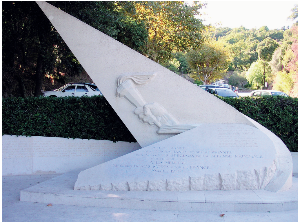
Ramatuelle, monument services spéciaux.