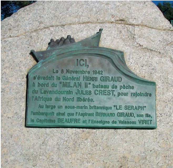
Le Lavandou, La Fossette, stèle pour l'embarquement du général Giraud.