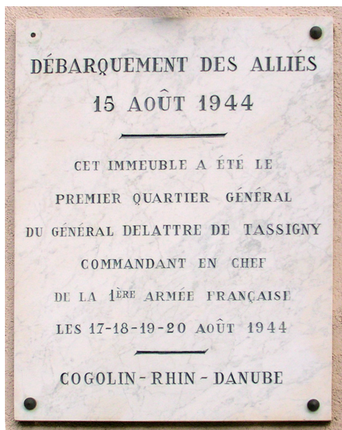
Cogolin, plaque du PC du général de Lattre de Tassigny.