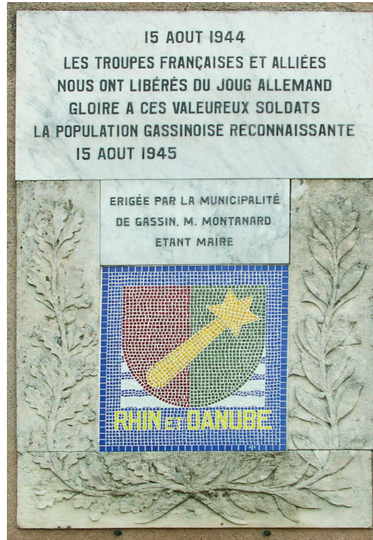
Gassin, plaque de la Libération.

bénéficient de complicité dans la commune. Quelques mois après, en décembre, alors que le maquis, beaucoup plus important, s'est déplacé dans le Centre-Var, les maquisards reviennent prendre les tickets de ravitaillement du village. Ce sont eux qui exécutent aussi un « collaborateur » de la commune.