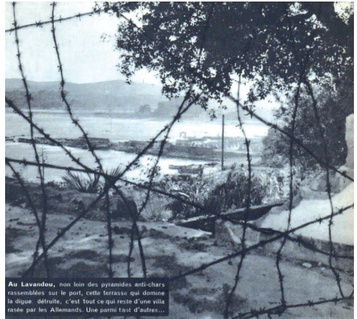
Au Lavandou, non loin des pyramides anti-chars rassemblées sur le port, cette terrasse qui domine la digue détruite, c'est tout ce qui reste d'une villa rasée par les Allemands. Une parmi tant d'autres...