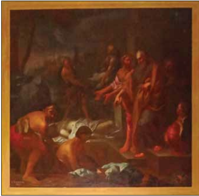
Fig. 5 – F. Arnaud, Scène d'ensevelissement , Aix-en-Provence, cathédrale Saint-Sauveur.

la peste de 1720 , en dépit des costumes à l'antique des personnages 18 . Il se trouve aujourd'hui dans la cathédrale d'Aix, à la suite de la réorganisation du décor pictural de l'édifice. À l'occasion de ce transfert, son sujet a été revu, selon le cartouche, en Tobit (père de Tobie) ensevelissant les cadavres de ses compagnons à Ninive , ce qui ne correspond pas entièrement au récit de Tobie , 1, 17-19. Il est permis de se demander s'il n'illustrerait pas plutôt Maccabées II , 12, 38-46, Judas Maccabée assistant à l'inhumation des siens « dans le tombeau de leurs pères » après sa victoire sur Gorgias, et décidant de faire une collecte afin d'offrir un sacrifice expiatoire pour eux, texte souvent cité par le catholicisme d'Ancien Régime afin de justifier les prières et messes pour les morts. Dans les deux cas, cette scène qui porte les armes d'un donateur a pu être destinée à la caseto (chapelle et ses annexes) d'une compagnie de pénitents qui pratiquait l'enterrement confraternel ou charitable.