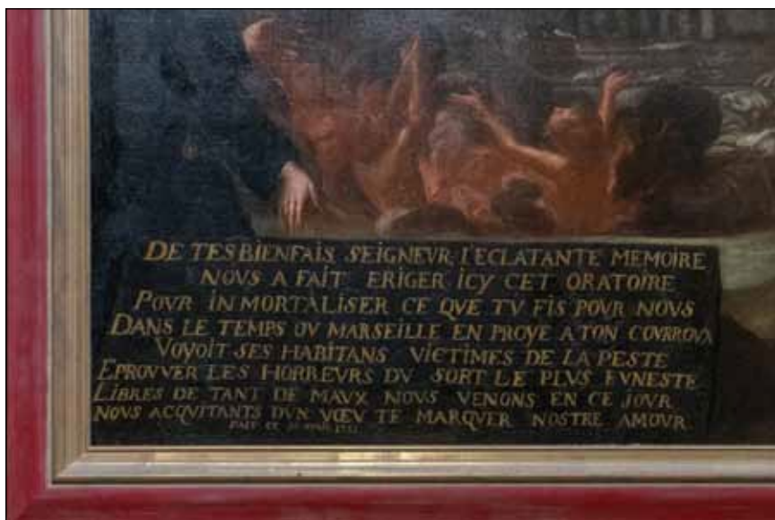
Fig. 2 – Détail du cartouche.