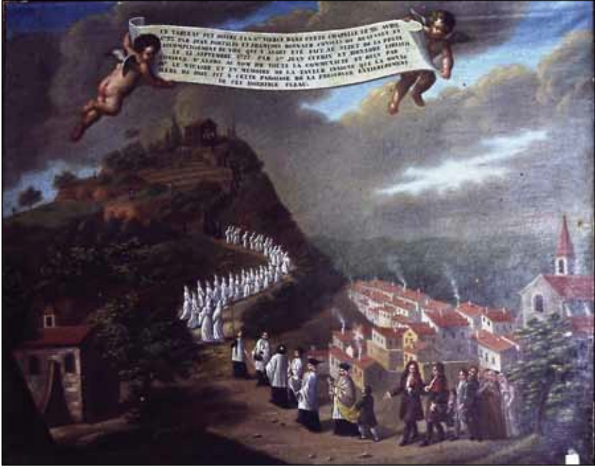
Fig. 6 – F. Arnaud, ex-voto de la chapelle Notre-Dame de Beauvezet au Bausset.

« au nom de toute la communauté ». Il semble être toujours en place dans la chapelle 19 (fig. 6).