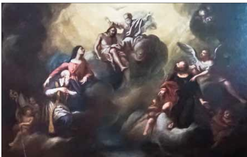
Fig. 3 – Partie supérieure de l'ex-voto.

Les visitandines ont donc voulu rendre grâce à Dieu d'avoir été préservées de la peste qui vient de sévir dans la ville. Protégées par la clôture de leur couvent mais en situation périlleuse, elles se sont vouées à Dieu par l'intermédiaire de la Vierge et de deux saints. Bien plus, elles ont tenu après la fin de la contagion à ce que la postérité connaisse cette preuve de la protection divine à leur égard. Elles ont fait élever pour cela « un oratoire », sans doute une petite chapelle dans leur maison ou dans leur jardin. Le tableau lui était explicitement destiné. À noter cependant que cet ex-voto n'était guère visible qu'aux religieuses s'il était situé dans la clôture du couvent, peut-être à leur famille et quelques familiers de la maison s'il se trouvait entre la porte de l'enclos et celle de l'église, zone exclaustrée en général. La date du 20 avril 1721, fête de sainte Agnès, pourrait correspondre à la bénédiction de cette petite chapelle.