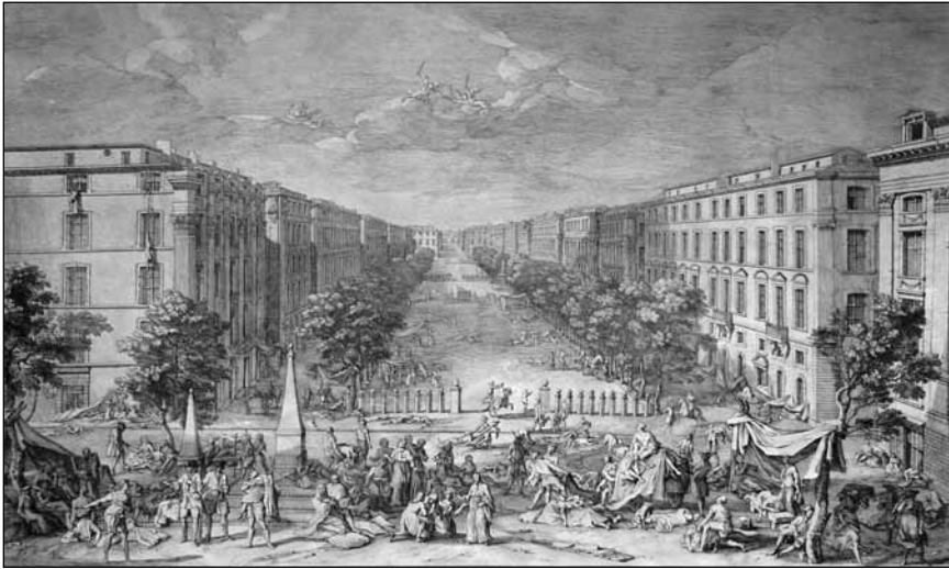
Fig. 7 – J. Rigaud, « Veue du Cours de Marseille dessinée sur le lieu pendant la peste arrivée en 1720 », gravure, col. part. cl. R. Bertrand.

qu'il dit signée « E. Arnaud » 44 . Vérification faite sur l'original, la signature est F. Arnaud 45 . S'agit-il de François-Bernard ou d'un autre fils non identifié 46 ?