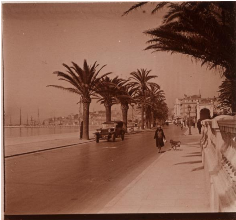
Cannes, Promenade de la Croisette, vers 1932