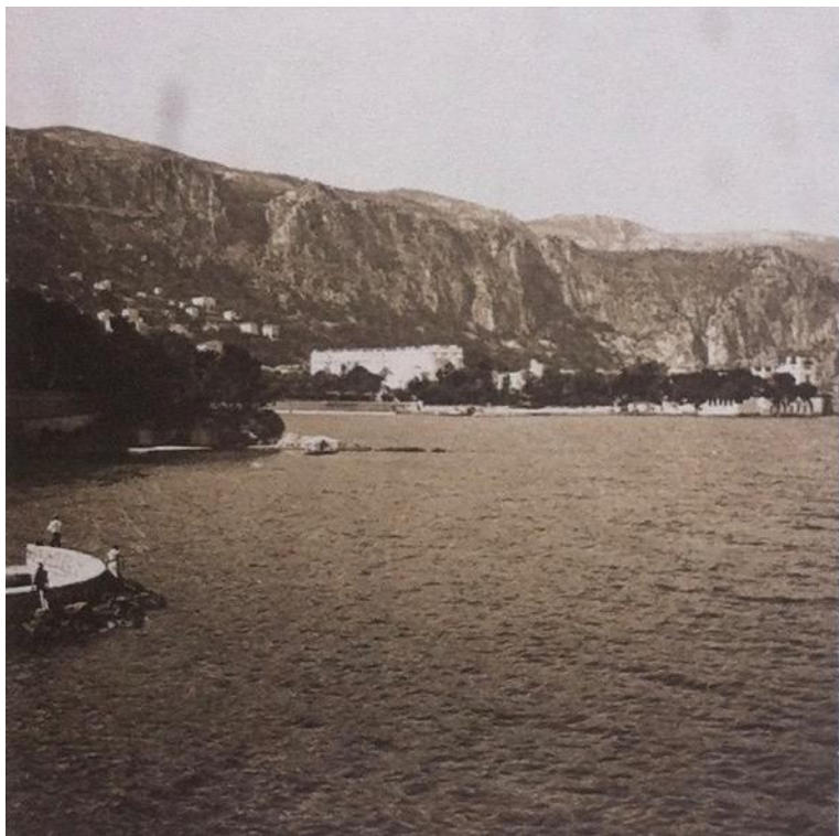
Beaulieu, vers 1932