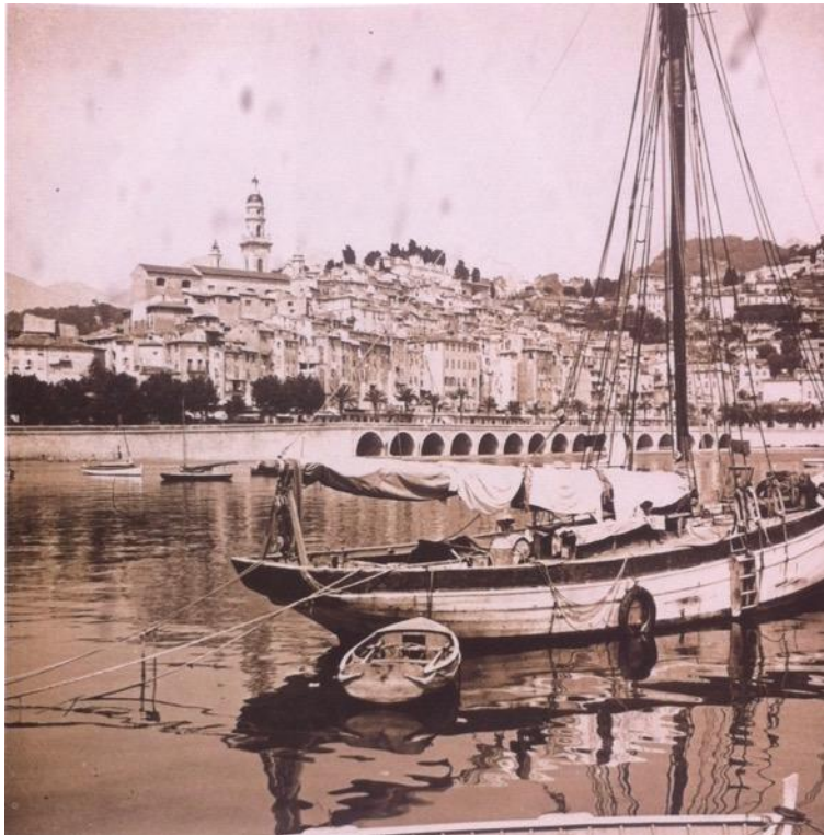
Le port et le vieux Menton, vers 1932

Annexe porte-folio (p. 230-235) : neuf positifs sur verre obtenus par trois séries stéréoscopiques sur verre, 2 fois 4x4 cm, marque Lumière, tons chauds, vers 1932, auteur et éditeur inconnus (collection de l'auteur)