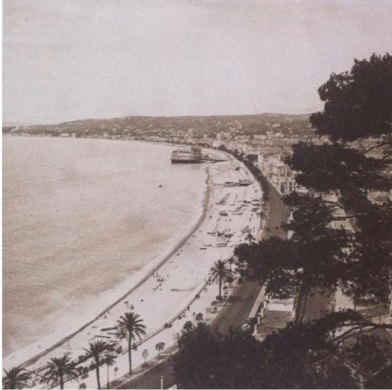
Nice, Baie des Anges, vers 1932