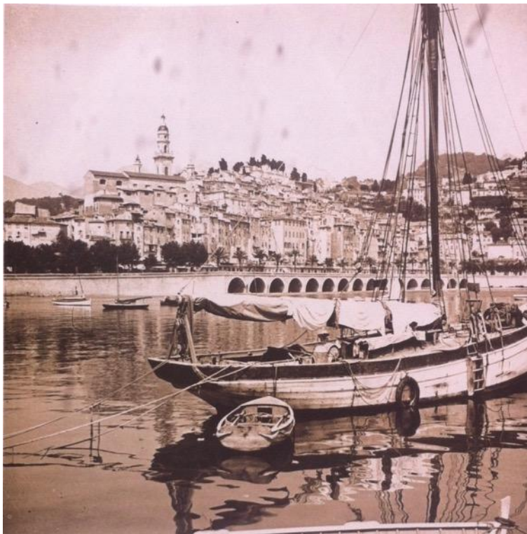
Le port et le vieux Menton, vers 1932

Annexe porte-folio (p. 230-235) : neuf positifs sur verre obtenus par trois séries stéréoscopiques sur verre, 2 fois 4x4 cm, marque Lumière, tons chauds, vers 1932, auteur et éditeur inconnus (collection de l'auteur)