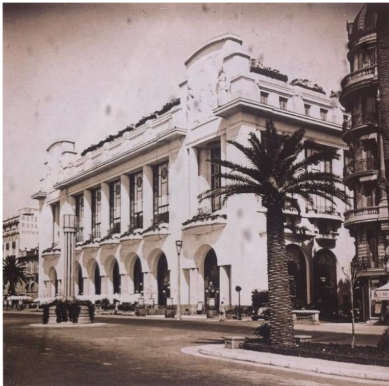
Palais de la Méditerranée, vers 1932