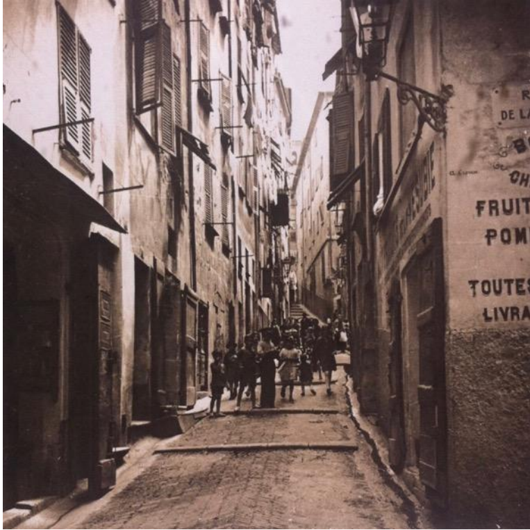
Une rue du vieux Nice, vers 1932