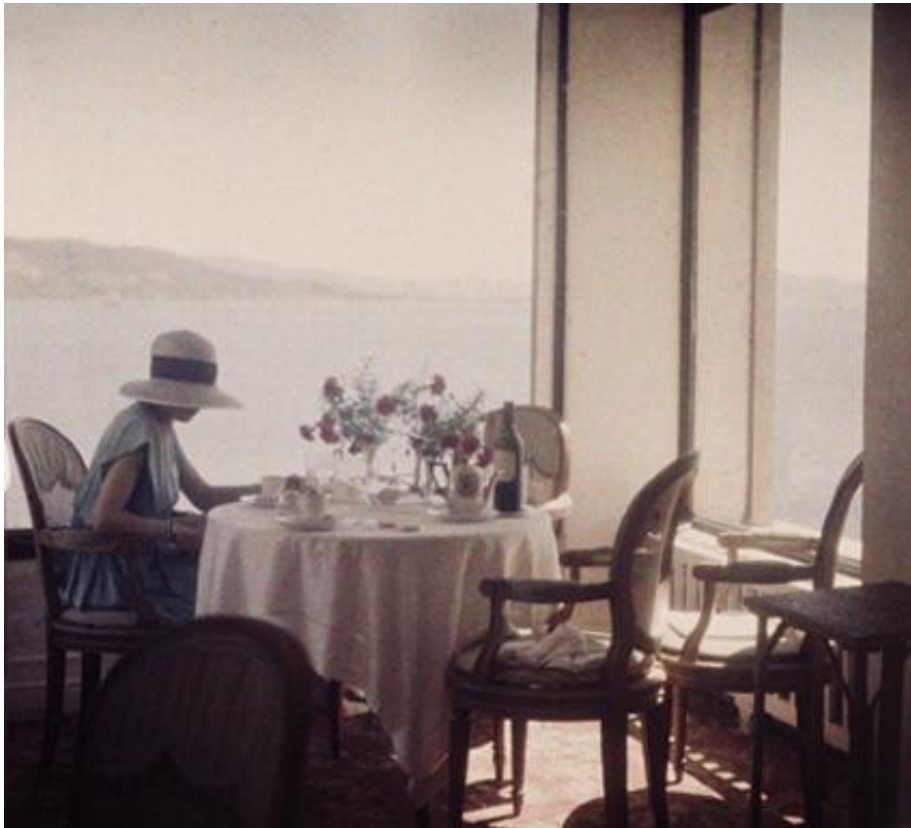
Jacques-Henri Lartigue, Le Restaurant d'Eden Roc à Cap d'Antibes, 1920, Autochrome