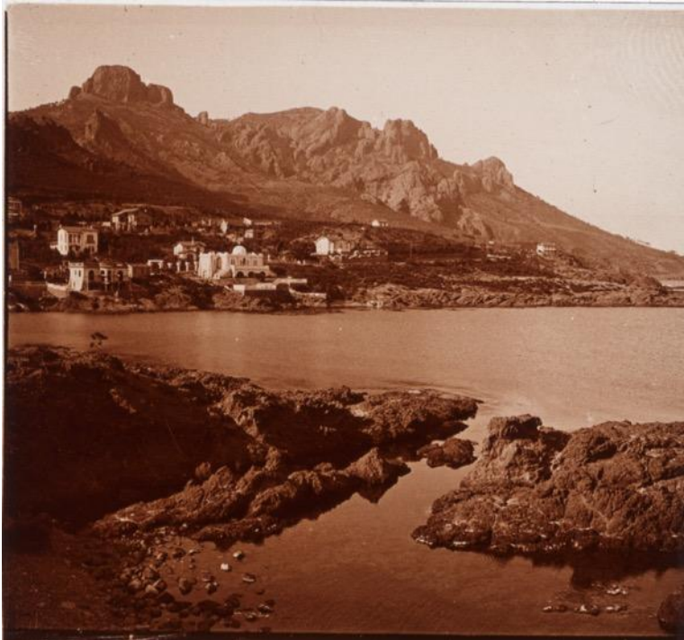
Anthéor, vers 1932,