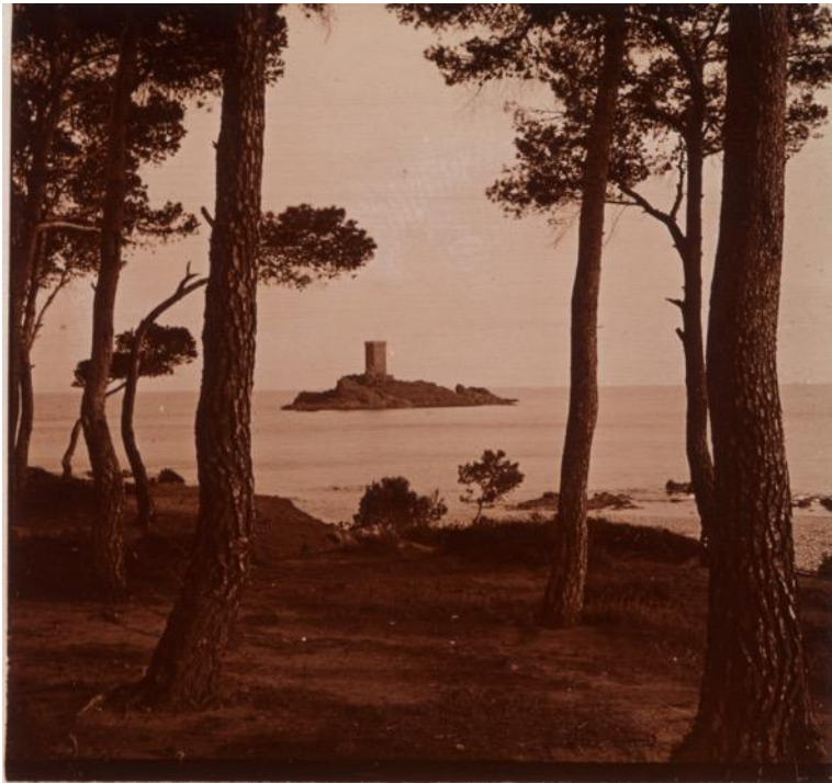
L'île d'Or, vers 1932