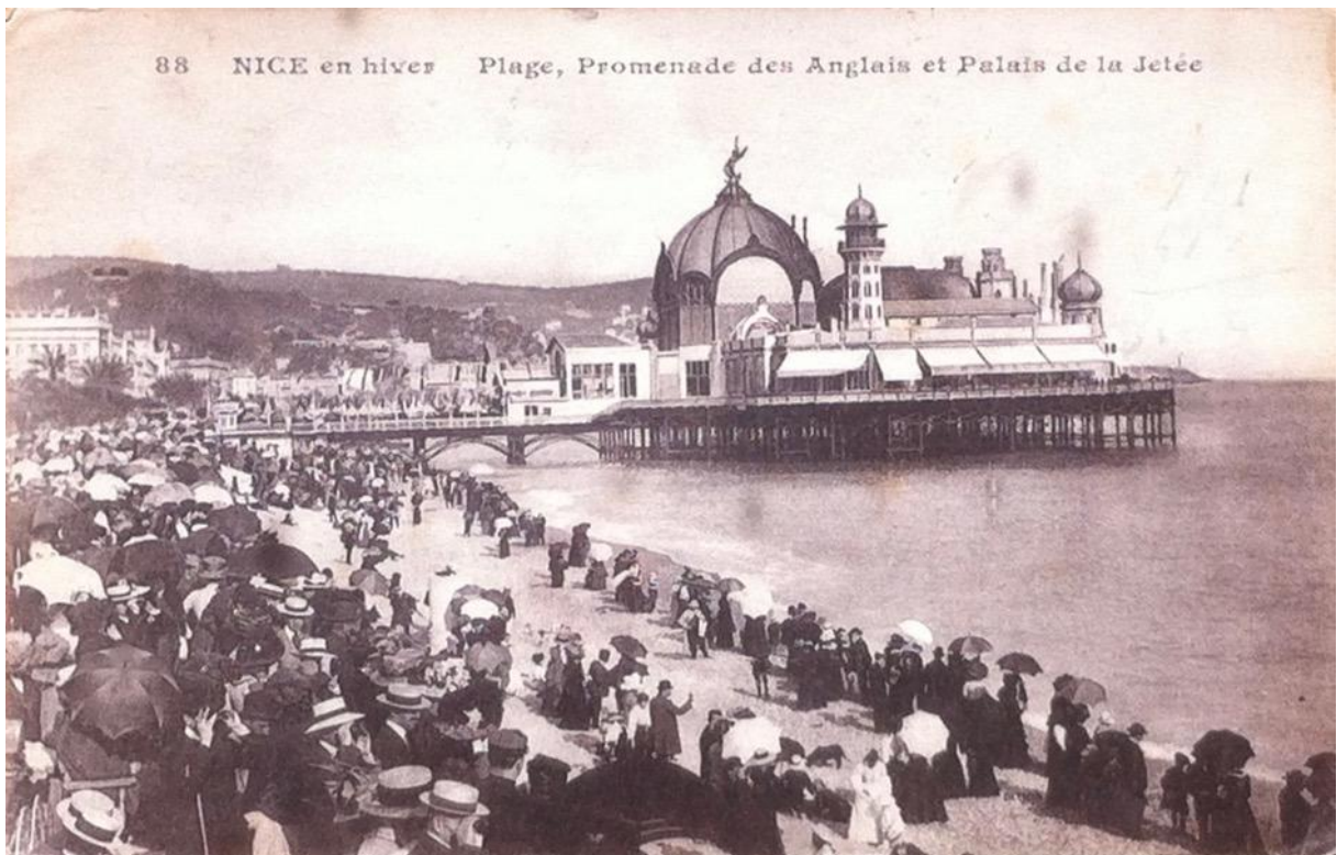
Nice en hiver : plage, Promenade des Anglais et Palais de la Jetée, 1917, photographie T.O. Marseille (carte postale, collection de l'auteur)

« Il y a deux villes distinctes à Menton : la ville moderne, la ville d'hiver, la ville des étrangers et des malades, celle qui longe la mer et qui commence à s'étendre dans les vallées, et la vieille ville, la ville des Mentonnais, la ville de toutes les saisons, celle qui s'était étagée et blottie au pied de son château-fort sur un promontoire rocheux, derrière de solides murailles aujourd'hui démolies, pour s'y