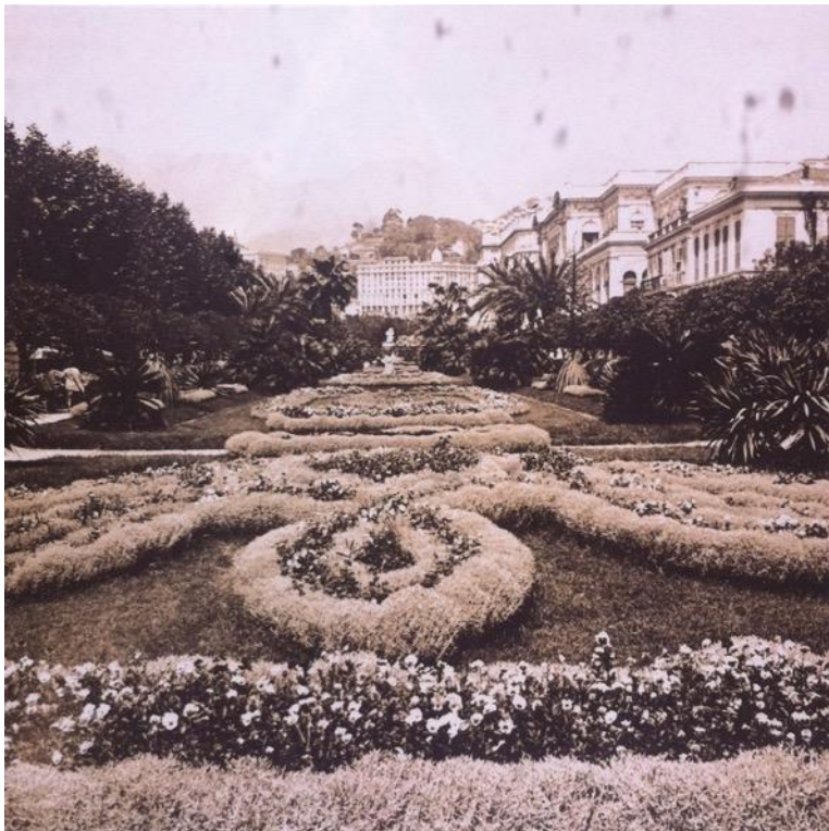
Les jardins de Menton, vers 1932