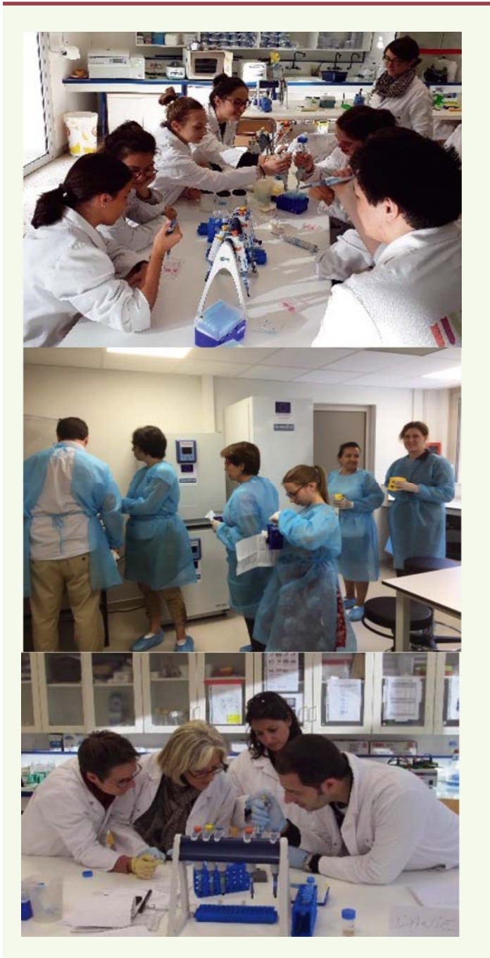
Figure 1. De haut en bas : scolaires, grand public ou membres d'association de malades effectuant des expériences par équipe, dans les laboratoires ouverts Tous Chercheurs.

stage par l'analyse du résultat de la même expérience (il s'agissait dans ce cas de l'observation au microscope confocal de macrophages dans une coupe de peau lésée). Une fois définis les mots incompris, les élèves décrivent aux tuteurs ce qu'ils voient et tentent d'apporter des réponses possibles aux interrogations inhérentes aux observations qui ont été faites. À l'issue de cette étape, émerge la problématique : « Quelles sont les réponses possibles du macrophage face à une infec-