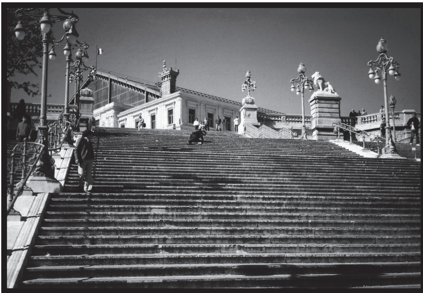
Chute / Chut! , 1982, in En attendant la Troisième guerre mondiale , film de Sarenco.