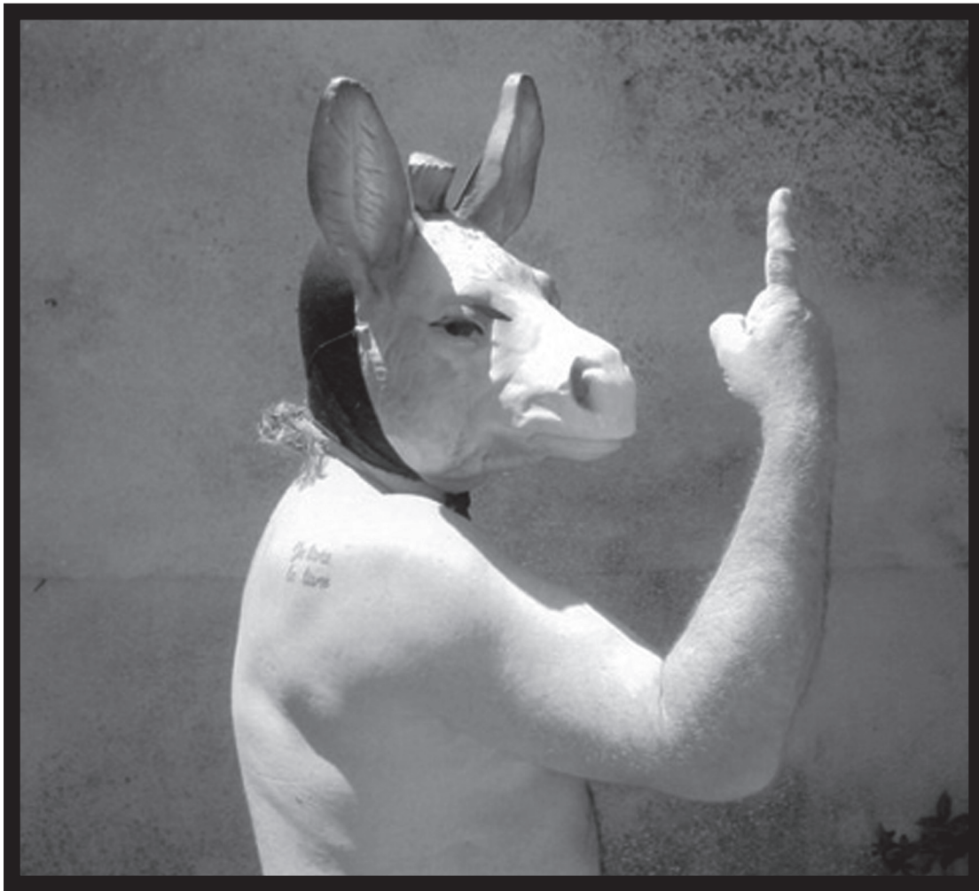
Hommage à Giordano Bruno, 2005, photographie Fabrizio Garghetti.