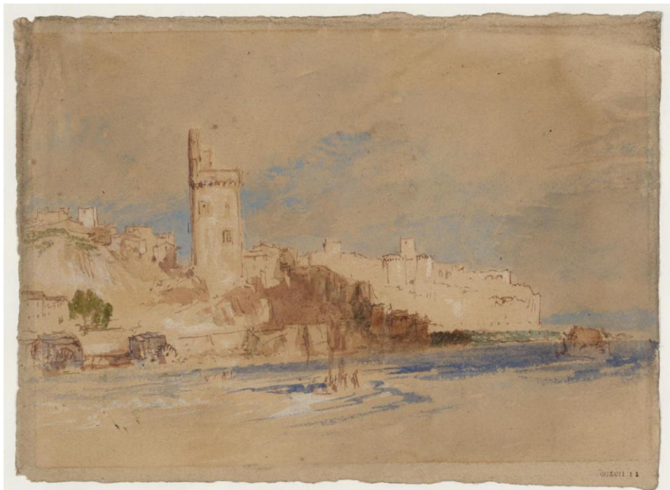
JMW. Turner « Le Rhône à Avignon : la tour Philippe-le-Bel et le fort St-André à Villeneuve-lez-Avignon », 1828, Tate gallery, D28958 (CCXCII 11)