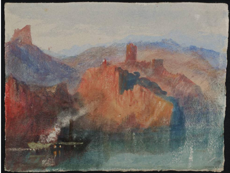
JMW. Turner, un paysage-catastrophe : « Viviers (Ardèche) et ses falaises rocheuses sur le Rhône », 1838 ? Tate gallery, D28996 (CCXCII 48 )