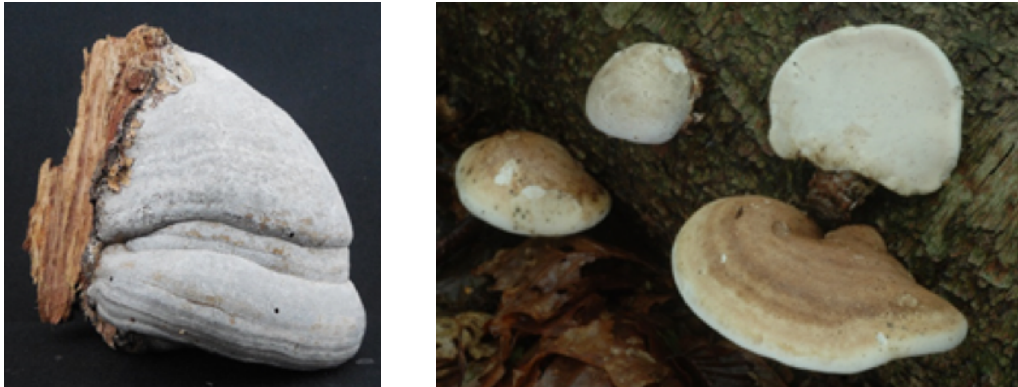
Figure 1 : Carpophore de Fomes fomentarius (gauche, image Marie-Noëlle Rosso, INRA) et de Fomitopsis betulina (droite, image Pierre-Arthur Moreau, Université de Lille)

de cellules cancéreuses résistantes aux traitements est un problème mondial et un appel urgent à la découverte de nouvelles molécules ciblant différents modes d'action et de meilleurs protocoles d'administration.