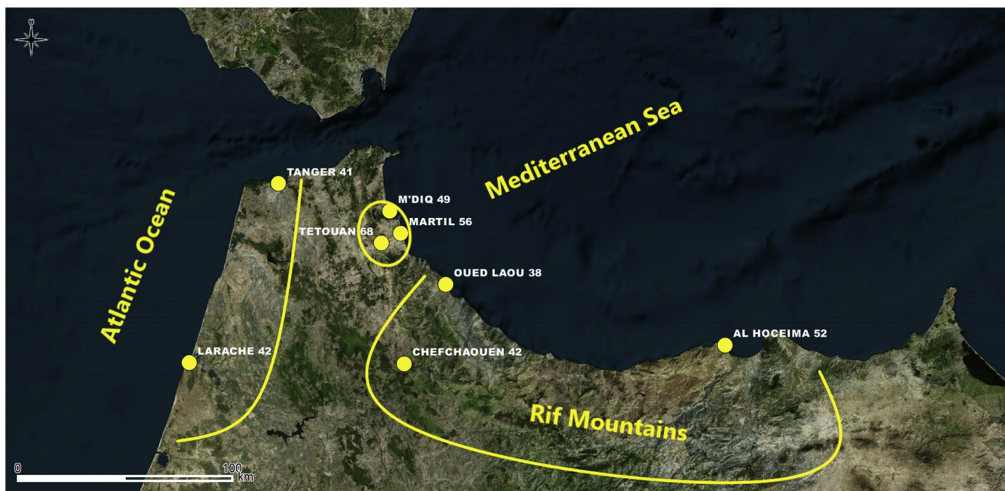
Fig. 2. Le Nord du Maroc avec les trois principales zones de la région : la côte Atlantique (Tanger/41/ et Larache/42/), Méditerranée-Martil (Tétouan/68/, Martil/56/, M'Diq/49/) et le Rif (Al Hoceïma/52/, Chefchaouen/42/, Oued Laou/38/). Les chiffres entre obliques correspondent au nombre de questionnaires administrés par commune.