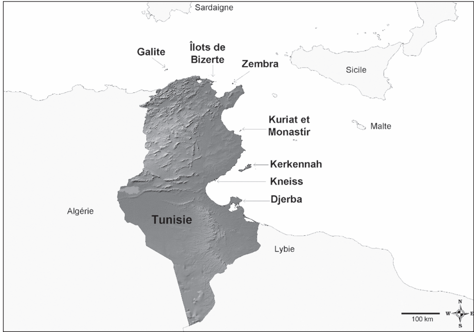
Fig. 1. Localisation générale des archipels présents le long des côtes de Tunisie (réalisation D. Pavon).