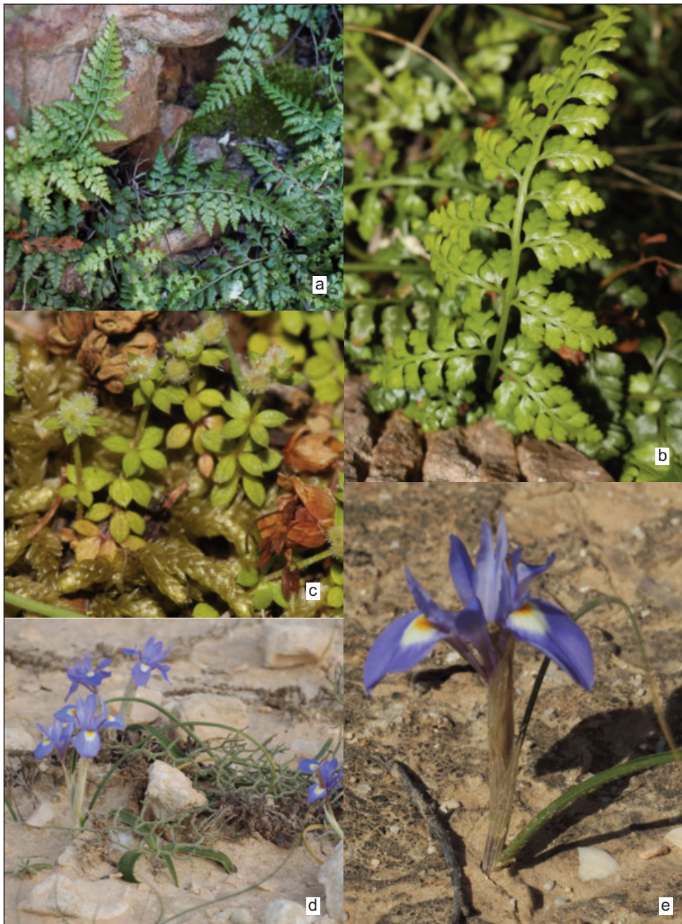
Fig 2. a, b) Asplenium balearicum Shivas, rochers ombragés du sommet de l'île de Zembra, 17.IV.2019 (clichés F. Médail & E. Véla); c) Galium minutulum Jordan sur l'île Zembra, 16.IV.2019 (cliché E. Véla); d, e) Moraea mediterranea Goldblatt: d) sur l'île Gremdi (Kerkennah), 29.III.2014, e) sur l'île Gataia el Gueblia (Djerba), 07.IV.2015 (clichés F. Médail).