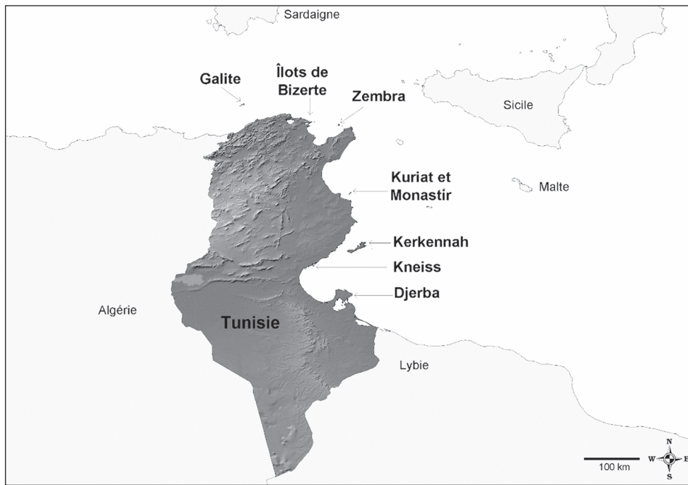
Fig. 1. Localisation générale des archipels présents le long des côtes de Tunisie (réalisation D. Pavon).