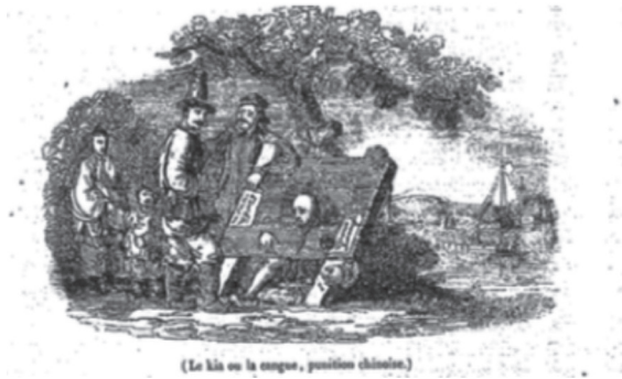
Figure n° 1 82