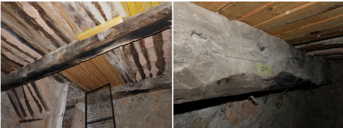
Figure 4 : Solive du clocher de la cathédrale de Senez.