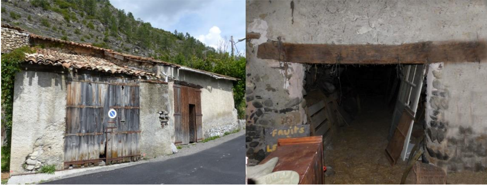
Figure 2 : Ancienne écurie de La Javie. A droite, le linteau en chêne a été étudié.