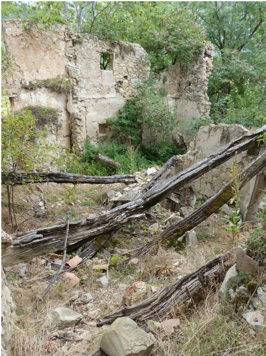
Figure 1 : Esclangon, commune de La Javie, 780 m d'altitude (août 2013). Ce village n'est plus habité et ses maisons tombent en ruine. D'anciennes poutres de très longues dimensions (solives ou pannes de toiture ?) serviront bientôt de substrat aux végétaux qui recolonisent cet espace.

Cette étude met donc en avant la nécessité de continuer à construire un référentiel local du chêne en partant de vieux arbres vivants puis en remontant dans le passé grâce à des bois historiques et archéologiques de plus en plus anciens. Ce travail de très longue haleine a débuté sur des vieux chênes de Courbons (Digne-les-Bains) et se poursuivra dans les années à venir Fig.6.