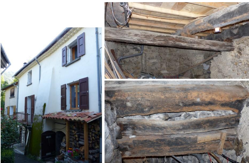
Figure 3 : Caves d'une maison de Prads-Haute-Bléone (Chanolles).