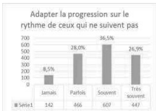
Fig. 1 - Adapter la progression sur le rythme de ceux qui ne suivent pas

Par le tri à plat des données brutes récoltées lors du questionnaire, nous observons deux points intéressants quant à leurs déclarations concernant la gestion de l'hétérogénéité scolaire.