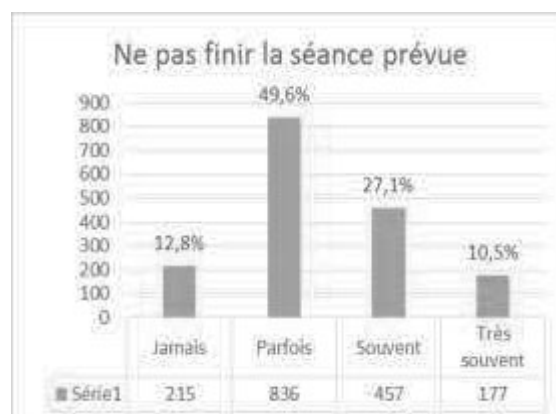
Fig. 4 - Ne pas finir la séance prévue

Ainsi, 50,5% des enseignants déclarent revoir parfois leurs objectifs de la séance à la baisse, et 24,9% disent le faire souvent. Les enseignants déclarent ne pas finir parfois (49,6%) voire souvent (27,1%) la séance prévue. De la même façon, ils sont une majorité à affirmer ne pas faire une séance de type sport ou art visuel au profit des mathématiques et du français (parfois : 43,9% ; souvent : 23,4%). Enfin, 64% des enseignants signifient arrêter parfois une séance en cours à cause d'une majorité d'élèves dans l'incompréhension de la notion étudiée.