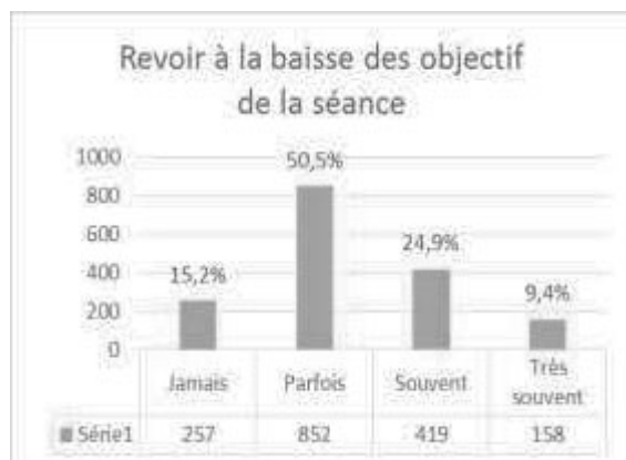
Fig. 3 - Revoir à la baisse des objectifs de la séance

De même pour la gestion de la grande difficulté scolaire, plusieurs réponses donnent des informations sur le quotidien déclaré des enseignants et donc sur un potentiel quotidien pour les EGRS.