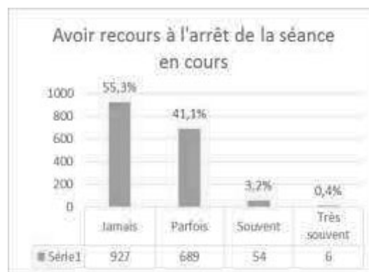
Fig. 6 - Avoir recours à des punitions collectives

Malgré 77,4% des enseignants déclarant ne pas avoir recours aux punitions collectives pour gérer les problèmes de discipline, ils sont un nombre non négligeable à affirmer utiliser ce système de sanction. Le fait d'arrêter une séance en cours pour gérer l'indiscipline est une solution choisie par 44,7% des enseignants (qui déclarent le faire parfois, souvent ou très souvent).