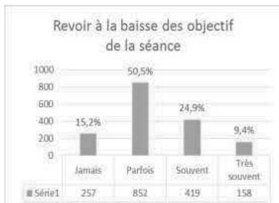
Fig. 3 - Revoir à la baisse des objectifs de la séance

De même pour la gestion de la grande difficulté scolaire, plusieurs réponses donnent des informations sur le quotidien déclaré des enseignants et donc sur un potentiel quotidien pour les EGRS.