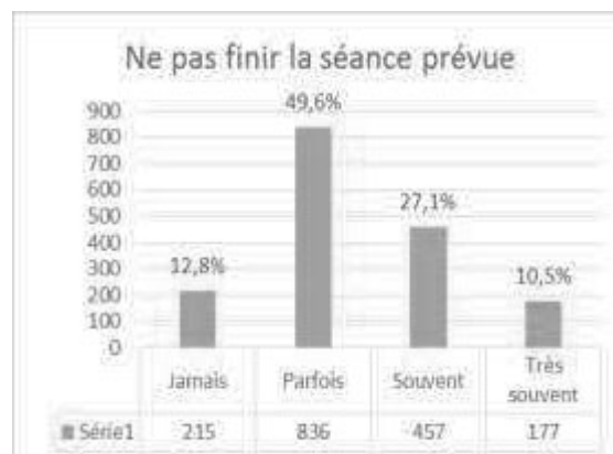
Fig. 4 - Ne pas finir la séance prévue

Ainsi, 50,5% des enseignants déclarent revoir parfois leurs objectifs de la séance à la baisse, et 24,9% disent le faire souvent. Les enseignants déclarent ne pas finir parfois (49,6%) voire souvent (27,1%) la séance prévue. De la même façon, ils sont une majorité à affirmer ne pas faire une séance de type sport ou art visuel au profit des mathématiques et du français (parfois : 43,9% ; souvent : 23,4%). Enfin, 64% des enseignants signifient arrêter parfois une séance en cours à cause d'une majorité d'élèves dans l'incompréhension de la notion étudiée.