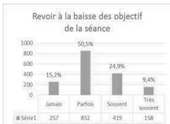
Fig. 3 - Revoir à la baisse des objectifs de la séance

De même pour la gestion de la grande difficulté scolaire, plusieurs réponses donnent des informations sur le quotidien déclaré des enseignants et donc sur un potentiel quotidien pour les EGRS.