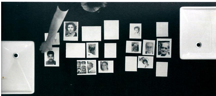
Oscar MUÑOZ, Sedimentaciones , 2011, Still tomado del vídeo. © cortesía del artista

A cada lado de la mesa se encuentra un lavabo, y entre ambos están colocados retratos y papeles blancos.