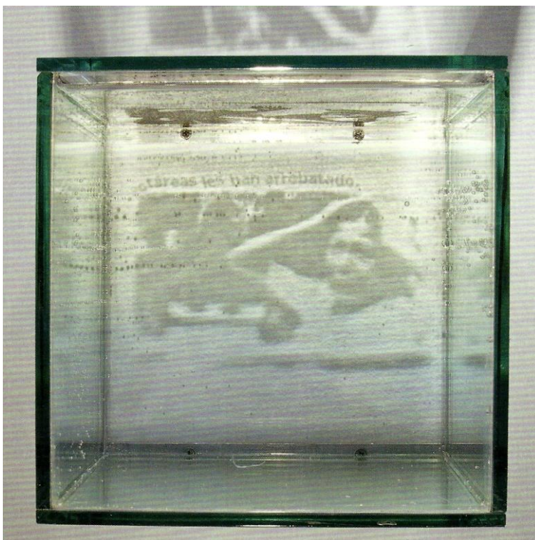
Oscar Muñoz, Lacrimarios , 2001, Polvo de carbón sobre agua.

acontecimientos. Los cubos llenos de agua son como « lacrimarios », recipientes que, los griegos y los romanos colocaban dentro de las tumbas y que almacenaban aceites perfumados y, a veces, lágrimas de los parientes del fallecido. La referencia a los « lacrimarios » nos recuerda que la historia de la producción de las imágenes está íntimamente vinculada a la cuestión de la muerte y a la ausencia que provoca. Imagen y muerte remiten en ambos casos a una ausencia. En el contexto latinoamericano, numerosos son los ejemplos de utilización de la fotografía como testimonio de una ausencia. En las manifestaciones organizadas en torno al tema de los desaparecidos, individuos alzan el retrato fotográfico de su pariente. La imagen tangible tiene una doble función: por una parte, quiere demostrar la existencia de los desaparecidos en el pasado, y, por otra parte, simboliza su presencia dentro de la memoria de los vivos.