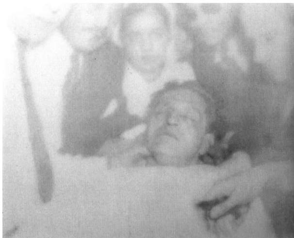
Oscar MUÑOZ, Impresiones débiles , « Haber estado allí », 2011, Impresión de polvo de carbón sobre plexiglás

compartido » 4 , declara el artista. Forman parte del imaginario visual nacional. Aquellas fotografías no sólo han sido difundidas en la prensa, fueron reproducidas en libros y expuestas a un proceso de sobre mediatización. El artista reprodujo esas fotografías sobre plexiglás con polvo de carbón.