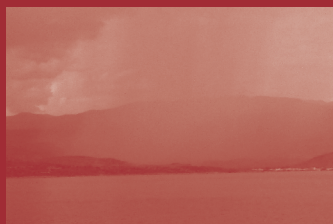
Delphes sous la pluie Crédit : Betsey Ann Robinson.