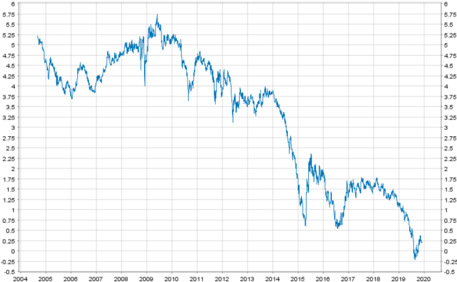
Figure 2. Taux d'intérêt sur les obligations d'Etat à 10 ans