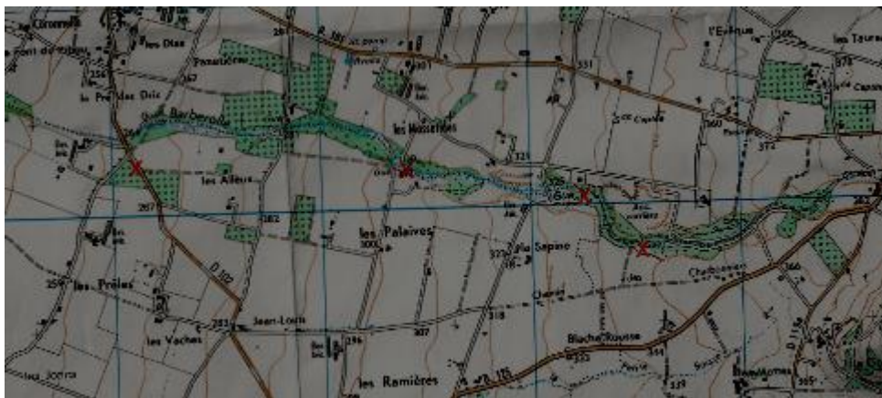
Les quatre gués de la Barberolle Carte IGN 3136 O, Charpey

Plusieurs de ces appellations semblent avoir disparu : celles de Montmiral, Romeyer et Charpey. Mais il est intéressant de voir que sur la carte IGN actuelle de Charpey (3136 O) figurent quatre indications de gué , correspondant à des ponts actuels, sur le parcours de la Barberolle, qui sépare Charpey de Bésayes.