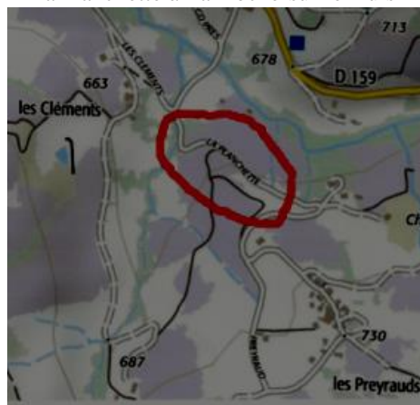
Géoportail IGN 2019