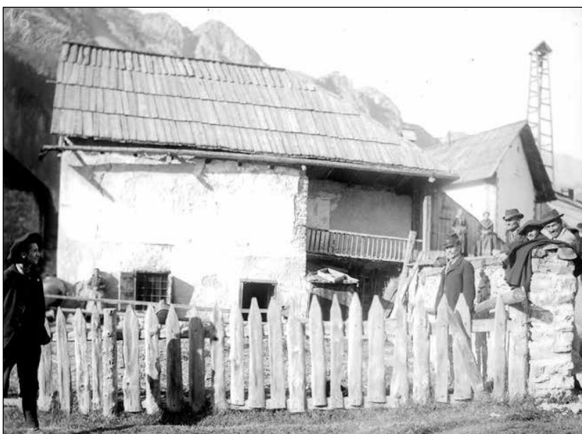
Fig. 1 - La fruitière de Brunissard (Arvioux)

La haute montagne du sud-ouest du Massif des Ecrins n'est pas touchée par ce phénomène. Dans le Haut Champsaur et sur la commune de Saint-Maurice-en-Valgodemard, se trouvent des forests (chalets d'estives) où le troupeau est gardé de façon collective, mais le fromage réalisé par chaque famille 11 . L'enquête de 1872 mentionne : « À Champolèon et à Orcières on fabrique du fromage bleu d'excellente qualité » et à Saint-Maurice « de petits fromages blancs connus sous le nom de Mont-Olan et du fromage bleu qui sont appréciés ». Le canton de Saint-Bonnet, décrit comme « un pays de laitage », ne possède pas de fruitière. Un avoué de Gap, P. A. Gaduel, a d'ailleurs publié en 1863 une étude incitant la création de fruitières dans le Champsaur, afin de valoriser le lait. En 1874 dans le Valgaudemar, aux Andrieux, commune de Guillaume-Peyrouse, Elie Bellon 12 un enfant du pays, qui a appris l'année précédente dans l'Ain la fabrication du bleu de type Gex et du gruyère, met en place une fruitière.