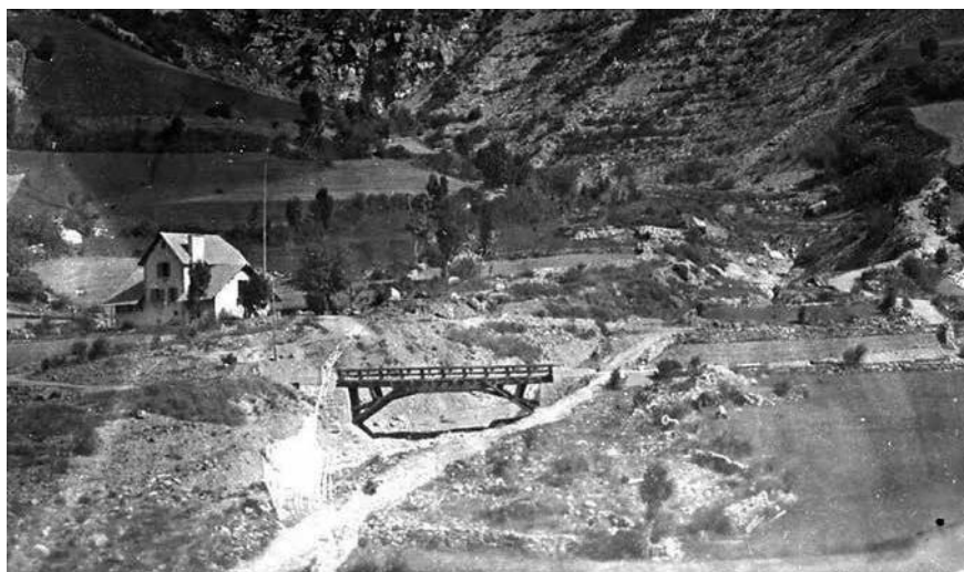
Fig. 3 - La fruitière modèle des Tourrengs (Orcières), cliché du RTM de 1892, AD05 21 Fi 240.

S'il est vrai que les acteurs de l'économie agro-sylvo-pastorale sont dominants, les forestiers participent activement à la création de la Fédération française d'économie alpestre et l'on retrouve parmi les fondateurs 56 trois personnages, Félix Briot, Auguste Calvet et Emile Cardot qui se sont particulièrement illustrés dans la mise en place des fruitières. Dans les quelques sources postérieures à la Grande Guerre, les rapports des forestiers sont rares et remplacés par ceux des services agricoles, d'autant qu'en 1920 le contrôle des coopératives est réalisé par le Génie rural.