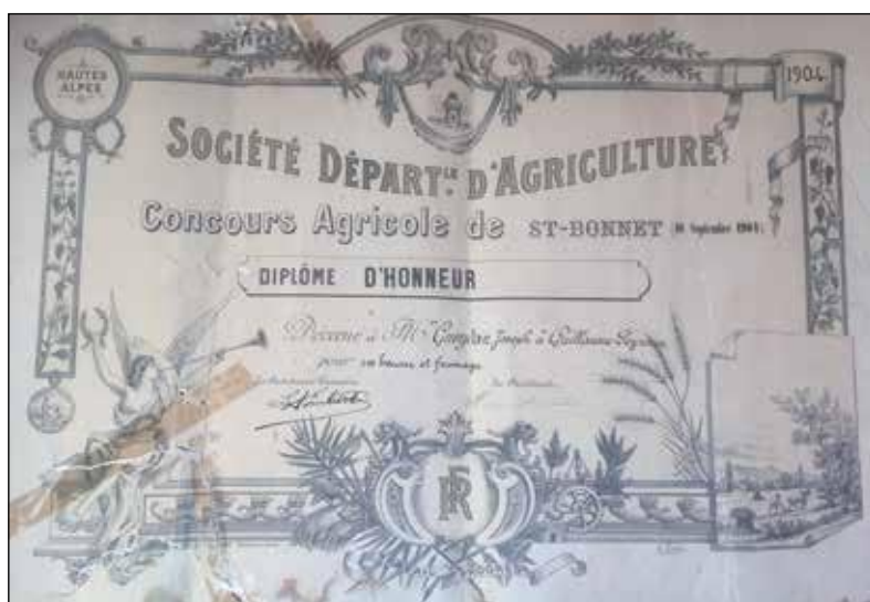
Fig. 2 - Diplôme du concours agricole de Saint-Bonnet de 1904, obtenu par la fruitière de la Chapelle, photographie Philippe Moustier, archives familiales de J.-M. Gueydan.

Les forestiers veulent favoriser une production de beurre et de fromages de qualité. En 1878, ils soutiennent la demande d'aide de la fruitière de Ristolas pour l'envoi de deux meules de gruyère à l'occasion du concours de l'exposition fromagère de Paris 44 . Félix Briot souligne par exemple la qualité des bleus, dénommés « champoléons » de la fruitière modèle des Tournings (Orcières) qui « sont supérieurs à ceux fabriqués dans les ménages. Ils ont eu le 1 er prix de la catégorie des fromages bleus au dernier concours de Saint-Bonnet 45 ». Pour ce faire ils insistent sur la qualité du matériel. En 1890, évoquant la fruitière modèle de la Chapelle, Félix Briot écrit à propos des acquisitions subventionnées « une écrémeuse centrifugeuse à bras, une délaiteuse, un malaxeur... divers instruments ayant pour but la fabrication de beurre de première qualité et dont on devra chercher à propager l'emploi dans la plupart des hameaux des Alpes 46 ».