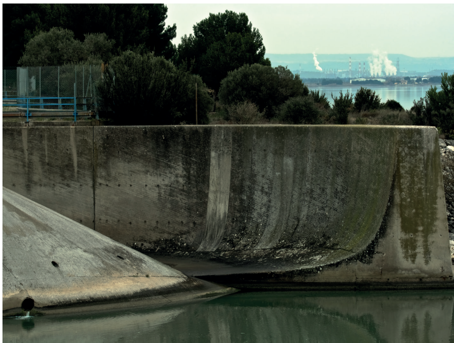
Étang de Berre, vue depuis l'usine hydro-électrique de Saint-Chamas