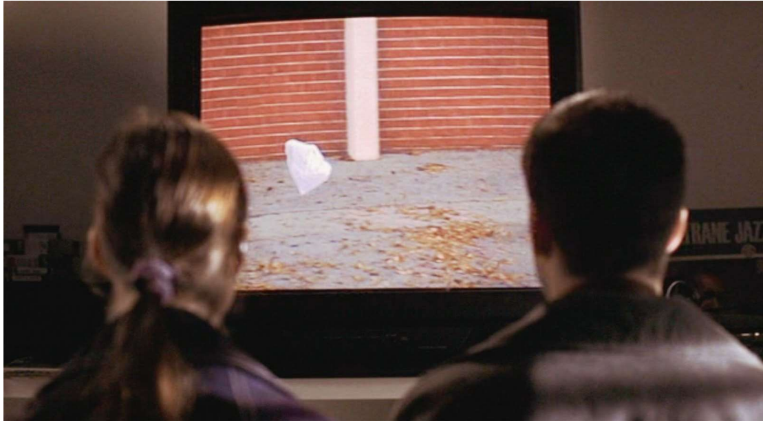
Fig. 7 Sam Mendes American Beauty 1999

Le sac de Mendes tournicote comme un papillon butineur au-dessus d'un champ de fleurs. Il est filmé comme un corps doué d'une vie exclusive.