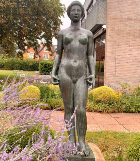
Flore, août 2020.

Une classification ultérieure sur la tranche du classeur indique « FLORE TABLEAUX TAPISSERIES FAC-SIMILE », la rature indiquant explicitement que les documents relatifs à Flore sont ailleurs.