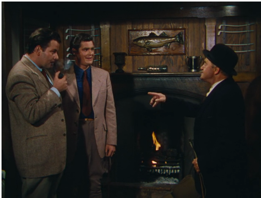
J. Ford, L'Homme tranquille , 1952, 35 mm, couleur