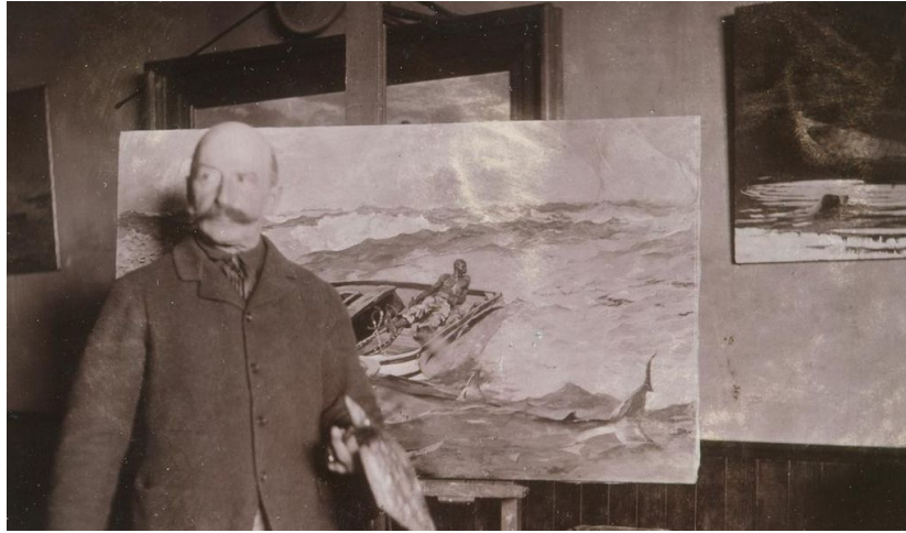
Winslow Homer dans son atelier de Prouts Neck, vers 1900