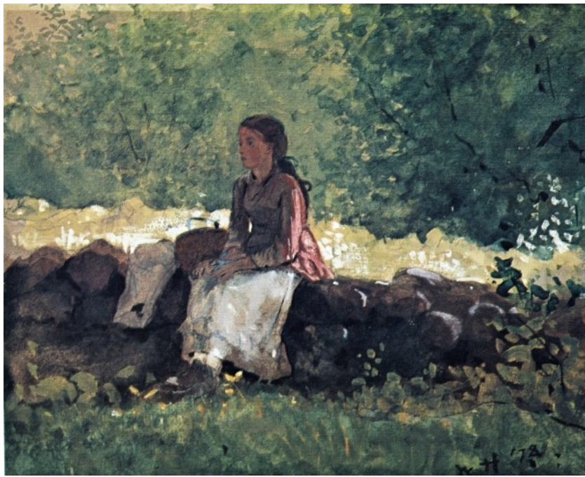
W. Homer, On the Fence , 1878, aquarelle, 55.8 x 44.2 cm, collection privée