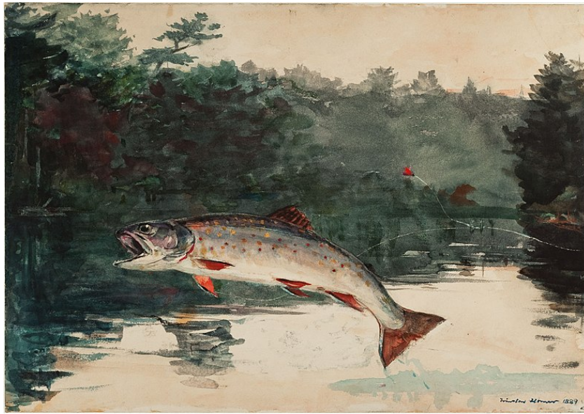
W. Homer, Leaping Trout , 1889, aquarelle, 35.7 x 50.9 cm, Portland Museum of Art

Cette truite, n'est-ce pas, après tout, la plus belle métaphore de ce qui arrive à la peinture quand elle circule le plus authentiquement dans le cinéma ? S'il s'agissait seulement de retrouver des images peintes, photographiées ou recomposées, dans un film, alors on n'obtiendrait que des images comme celle de la truite ornementale, de la truite hors de l'eau, dans le film mais corrompue, morte ou factice. En revanche, en cinéma, comme chez Homer, ce qui compte, c'est de saisir le bond de la peinture, les vecteurs par lesquelles la peinture bouge encore, bouge enfin dans un médium qui n'est pas le sien, comme l'air n'est pas l'eau, ce bond par lequel la peinture, plus dans son élément, n'est déjà plus la peinture, mais survit autrement dans les films, paradoxe de courte durée, comme une aberration qui n'est pas tout à fait à sa place dans l'image.