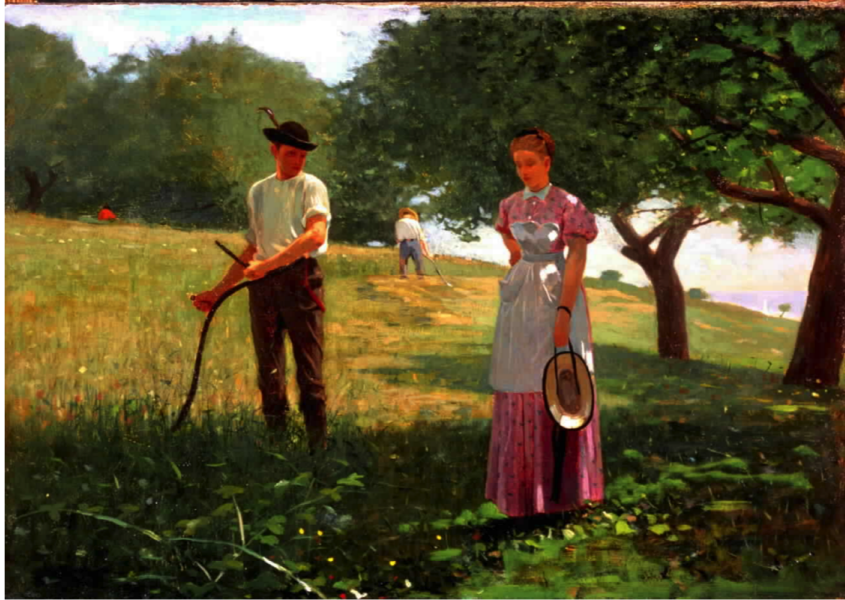
W. Homer, Waiting an Answer , 1872, huile sur toile, 30.4 x 43.2 cm, Baltimore Museum of Art

La situation est plus inventive encore, en allant toujours plus avant vers la singularité de la forme filmique, si l'on considère désormais toute une scène, comme celle de l'affrontement final entre Sean et « Red » Will : l'époux de Mary Kate se décide à passer par-dessus sa fierté, et le traumatisme de son dernier combat de boxe, pour venir réclamer à coups de poings l'argent de la dot de Mary Kate, suivi par toute une partie du village. Je propose de regarder le début de cette longue séquence – avant la rencontre avec « Red » Will – par l'assistance de Snap the Whip (1872 aussi).