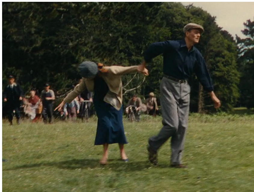
J. Ford, L'Homme tranquille , 1952, 35 mm, couleur