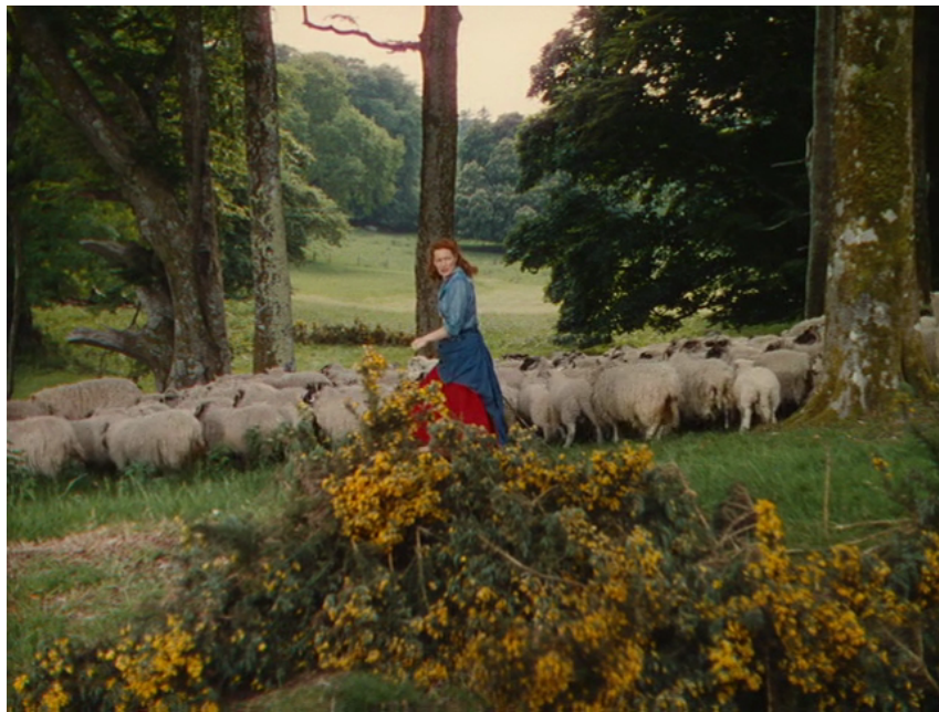
John Ford, L'Homme tranquille , 1952, 35 mm, couleur

D'autres exemples – auxquels je viens très vite – sont déjà nettement plus complexes, et sans doute plus convaincants, dans la mesure où ils vont porter sur le film en tant que film, c'est-à-dire aussi plus ajustés. Que se passe-t-il si nous plaçons côte à côte plusieurs plans de L'Homme tranquille , après que Mary Kate et Sean ont échappé à leur chaperon ou plus tard après leur mariage « inachevé » (« Red » Will Donaher, le frère aîné de la mariée, a confisqué la dot), et On the Fence (1878) de Homer ?