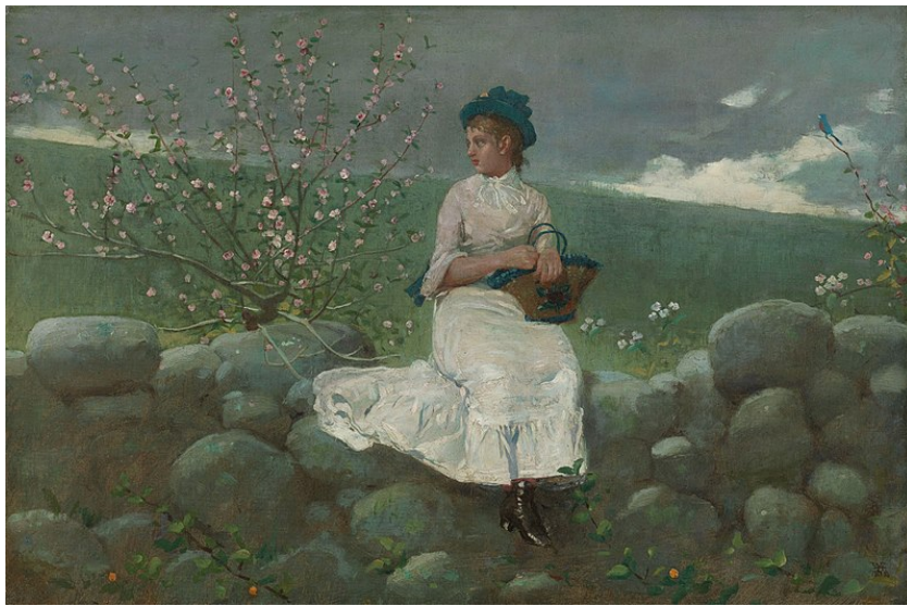
W. Homer, Peach Blossoms , 1878, huile sur toile, 33.7 x 49 cm, Art Institute of Chicago

Complémentaire, la présence de Sean dans le deuxième plan ci-avant peut faire écho vers un autre tableau de Homer : Waiting an Answer (1872). C'est plus net un peu avant dans la scène, quand Mary Kate, qui vient de rejoindre Sean, est encore debout. Le motif amoureux est commun aux deux images – le film est avant tout une comédie maritale – mais les relations de Homer à Ford sont plus recherchées ; et pas seulement parce que chez Ford la réponse (positive) a déjà eu lieu à ce moment-là du film : l'homme, qui était derrière la femme, passe devant elle, face à elle (dans Waiting an Answer , aucun des deux ne regarde l'autre ni le lui parle), mais il continue de tenir un outil agricole et de porter un couvre-chef, par exemple. Un grand arbre veille toujours sur cette affaire sentimentale où la figure masculine est en position de fragilité (l'incertitude amoureuse : dans le film de Ford, le destin ce mariage est suspendu à la rétention de la dot de Mary Kate par son frère).