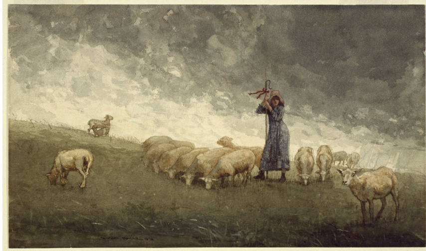
Winslow Homer, Shepherdess Tending Sheeps , v. 1878, aquarelle, 29.4 x 50.2 cm, Brooklyn Museum, New York

Tending Sheeps [7] (v. 1878) ou Girl and Sheep (1880). Déclivité, pose de la femme, regroupement des moutons : plusieurs attributs sont bien en place. Mon but, comme il va apparaître très vite, n'est pas du tout de faire œuvre d'érudition, ce qui ne présente à peu près aucun intérêt si ce n'est celui de la satisfaction narcissique (qui n'est pas non plus négligeable), ni même de faire jouer des ressemblances toujours superficielles et commodes, mais de commencer à mettre au jour une manière qu'a la peinture d'assister au cinéma.