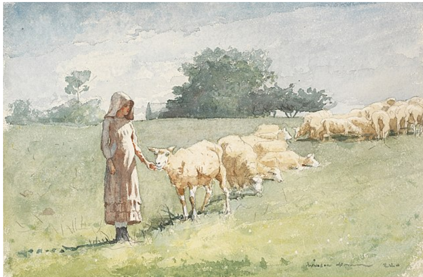
Winslow Homer, Girl and Sheep , 1880, aquarelle, 22.2 x 34 cm, Rhode Island School of Design Museum, Providence