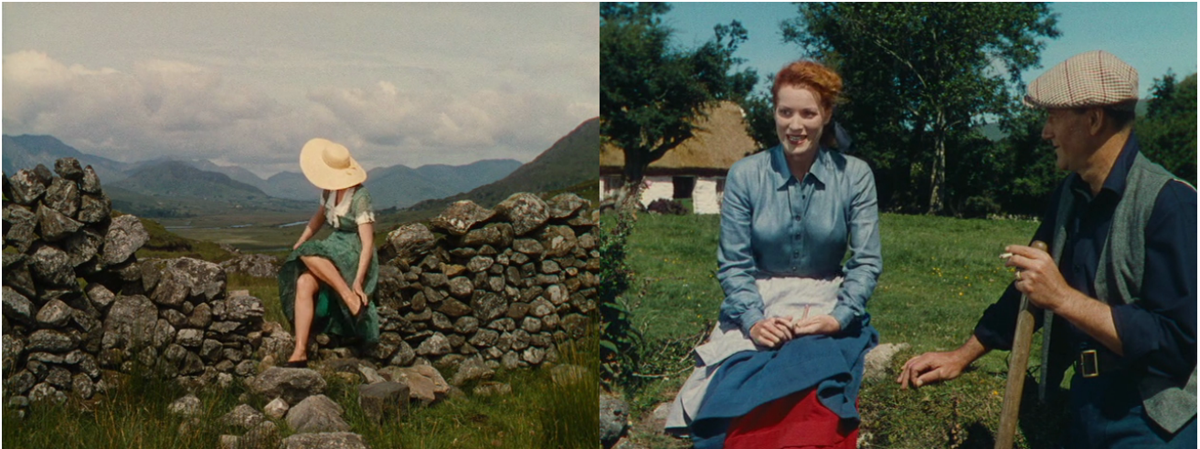
J. Ford, L'Homme tranquille , 1952, 35 mm, couleur

D'autres exemples – auxquels je viens très vite – sont déjà nettement plus complexes, et sans doute plus convaincants, dans la mesure où ils vont porter sur le film en tant que film, c'est-à-dire aussi plus ajustés. Que se passe-t-il si nous plaçons côte à côte plusieurs plans de L'Homme tranquille , après que Mary Kate et Sean ont échappé à leur chaperon ou plus tard après leur mariage « inachevé » (« Red » Will Donaher, le frère aîné de la mariée, a confisqué la dot), et On the Fence (1878) de Homer ?