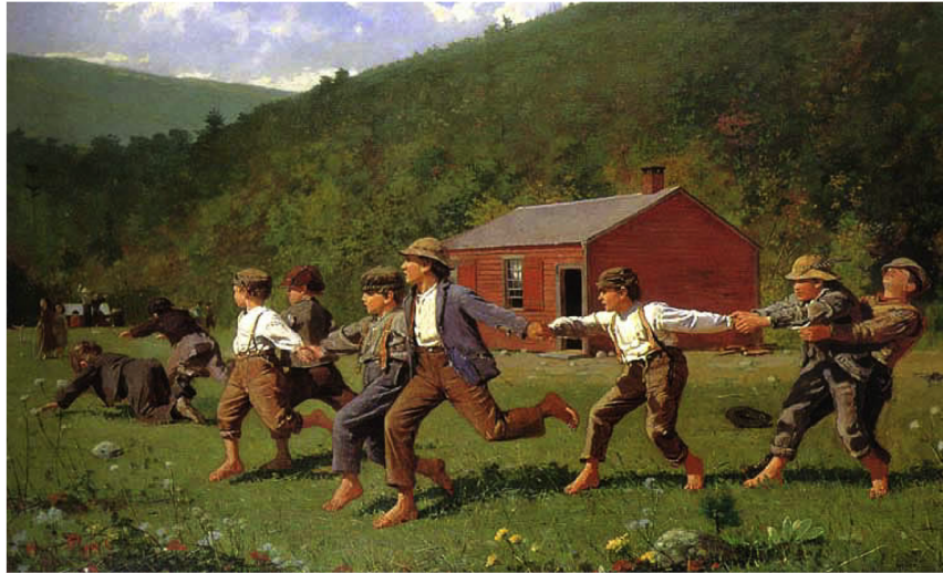
W. Homer, Snap the Whip , 1872, huile sur toile, 30.5 x 50.8 cm, Metropolitan Museum, New York