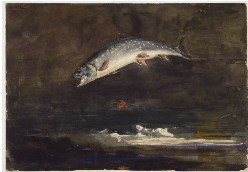
W. Homer, Jumping Trout , 1889, aquarelle, 35.4 x 50.6 cm, Brooklyn Museum, New York