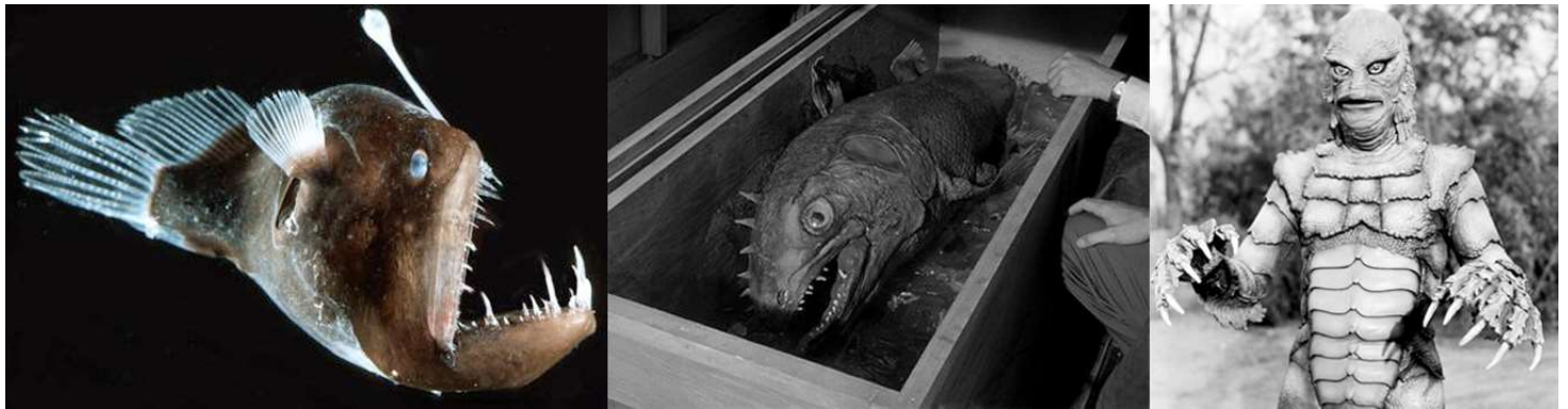
Baudroie de Johnson ( Melanocetus johnsoni )

envers symétrique des galaxies stellaires – l’extraterrestre du Météore de la nuit ressemble à une méduse, de The Space Children à une éponge ou un concombre de mer ; l’héritage en vient sans doute de H. G. Wells avant tout : « Dans l’abîme » de 1896, et de H. P. Lovecraft : « Le cauchemar d’Innsmouth » de 1931, et tous les extraterrestres qui de manière générale se sont réfugiés au fond des océans : Grands Anciens, Cthulhu...). Arnold ne pouvait, de toute façon, pas filmer de tels organismes : bien que l’Expédition du Challenger eût parcouru le monde, dès 1872, en effectuant les premiers relevés de profondeurs abyssales (jusqu’à 8 kilomètres), et découvert à cette occasion des centaines d’espèces alors inconnues, l’exploration des grands fonds, possible depuis l’invention par Otis Barton de la bathysphère en 1928 puis du bathyscaphe autonome vingt ans plus tard, par Auguste et Jacques Piccard, était encore très embryonnaire dans les années 1950. Mais on voit comment la nécessité de ces animaux s’impose d’abord dans les images , par leurs propres actes de vie. Le cinéma aura inventé ces formes de vie benthiques et pélagiques. Le public les connaît-il autrement, d’ailleurs, dans leur biotope que par les médiations des images enregistrées (pas de safari dans ces abîmes) ?