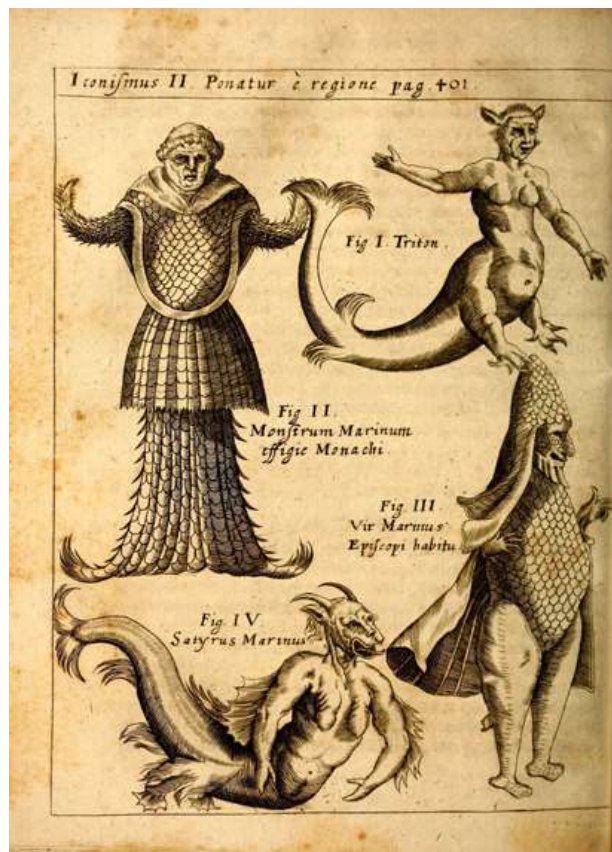
Moine des mers (en haut à gauche) et poisson-évêque (en bas à droite), Gaspar Schott, Physica curiosa, sive mirabilia naturae et artis libris XII , planche II, Endterus, Nuremberg, 1662