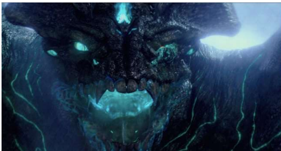
Guillermo del Toro, Pacific Rim , 2013, 35 mm, couleur)