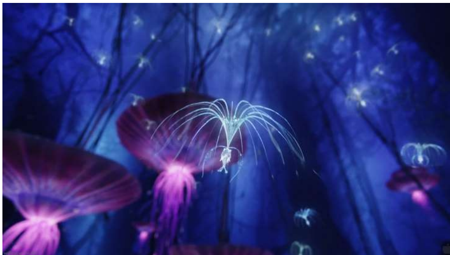
James Cameron, Avatar , 2009, 3D et projection numérique/35 mm, couleur