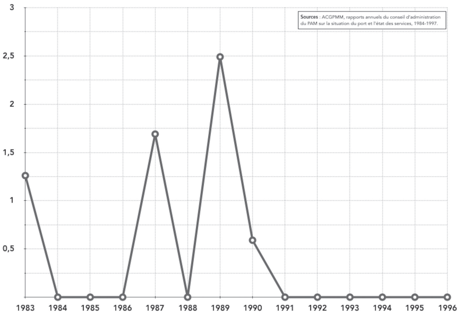
Graphique 2 : Exportations d’eau douce depuis Lavéra de 1983 à 1996 (en millions de tonnes).