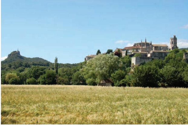
3 Viviers (Ardèche, France) vu du bord du Rhône actuel à l'amont de la ville la cathédrale Sainte-Minerve sur le bourg perché, et le rocher St-Michel à l'horizon sud (auteur: Roland Courtot, 04.2018) ; le bourg épiscopal perché sur son rocher, surmonté par la cathédrale Sainte-Minerve, dont Turner a mis en valeur le clocher et le chœur (ce dernier étant tourné vers l'E, le peintre a situé son point de vue du SE vers le NO) (see Pl 4)