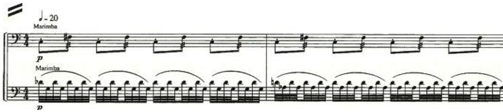
III. 4 : Bribes de l'ouverture de l'opéra.

On retrouve dans cette écriture de l'ouverture de l'opéra l'ensemble des notes de la mélodie que le compositeur travaille tant au niveau des hauteurs que des rythmes. Cela crée une tension progressive qui se résout sur la première note prononcée a cappella par l'un des chanteurs. Sous l'apparente stabilité rythmique des mesures qui s'enchaînent, on perçoit une tension émotionnelle due aux jeux de rapports entre les intervalles et leur progression par chromatismes. Cet artifice de tension est le fruit de l'activité créative et exprime l'émotion réalisée du compositeur. Ces transformations progressives des éléments musicaux sont autant de transpositions didactiques qui indiquent le rapport évolutif du musicien aux hauteurs, aux durées, aux intensités des sons.