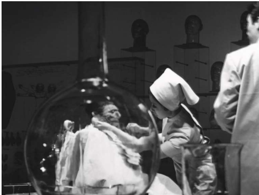
Teshigahara Hiroshi, Le Visage d'un autre , 1966, 35 mm, noir et blanc