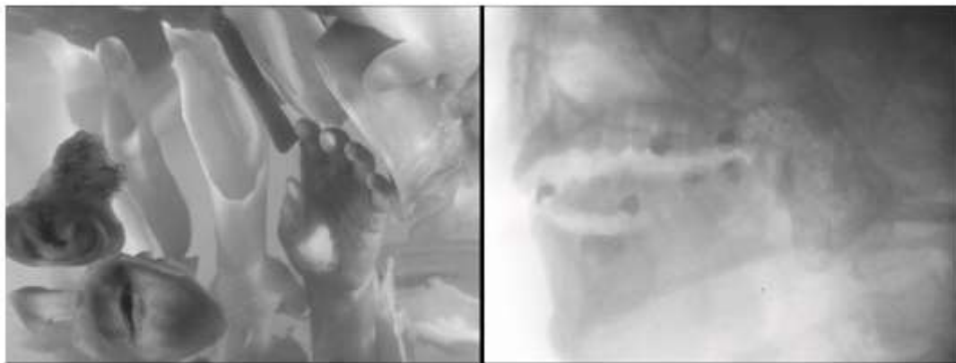
Teshigahara Hiroshi, Le Visage d'un autre , 1966, 35 mm, noir et blanc

Le Visage d'un autre pose donc ouvertement une distinction capitale, prolongeant la nuance entre aspect narratif (mimétique) et aspect esthétique (visuel) du film, entre fable et sensible : d'un côté, on trouve, on voit, dans maints films représentatifs des visages filmés , photographiés, directement ou par des biais – comme ici – selon telle ou telle circonstance narrative et figurative ; et, d'un autre, le film présente un visage inédit, non analogique, ne correspondant à aucun visage référentiel stricto sensu , réel ou possible, qu'on ne peut appeler un visage que métaphoriquement en tout rigueur, un visage (inhumain), que je dirai filmant , qui ne prélève rien, ne reproduit rien, et dont le site serait les processus imageants du film.