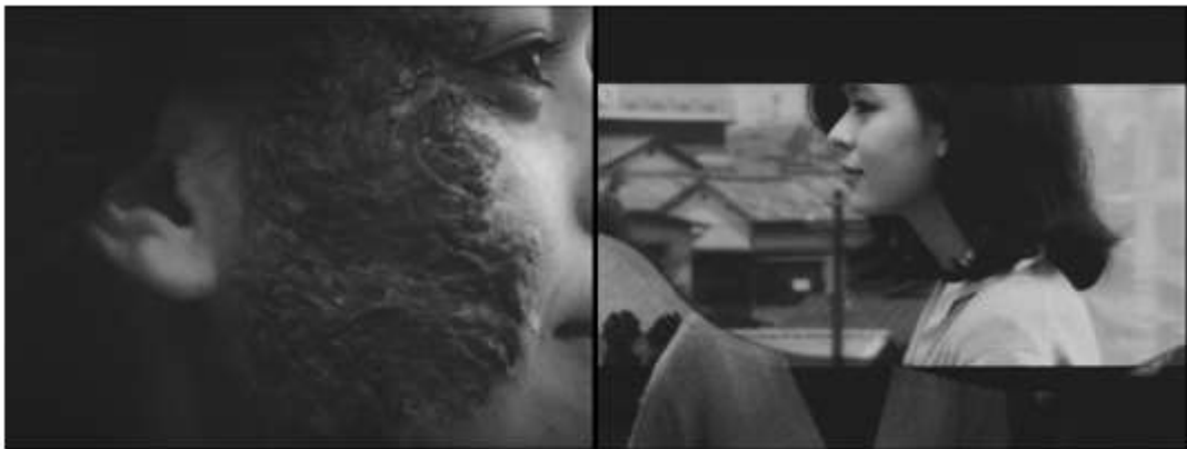
Teshigahara Hiroshi, Le Visage d'un autre , 1966, 35 mm, noir et blanc

Symptomatique de cet effet-visage sur le film : le « film dans le film » que va voir Okuyama au cinéma – l'histoire d'une jeune fille au visage défiguré par une énorme chéloïde sur la joue droite – n'est pas une mise en abyme du motif du visage ruiné, mais, monté plein cadre et par séquences éparses après que Okuyama l'a vu, finit par recouvrir la surface du film principal, qui va carrément se terminer avec lui plutôt qu'avec son intrigue principale ; finit par le dévorer comme une tumeur ou un eczéma : sa première occurrence se répand en tache sur l'écran. Les raccords entre les deux fictions se feront toujours dans la continuité du montage (du mouvement, de la lumière, etc.), c'est-à-dire dans le sens d'une absence de discrimination visuelle, sans lésion, comme pour une greffe, tout autant que tout est fait pour que le masque de Okuyama, cette autre image invasive dans la représentation, colle parfaitement à sa propre peau. Le film instaure ainsi un parallèle formel entre la relation entre lui-même et le « film dans le film », d'un côté, et, de l'autre, le corps et le visage de Okuyama. Le « film dans le film » est, pour le corps principal du film, l'équivalent du « visage d'un autre » pour Okuyama (il y a, par exemple, deux formats différents : carré et CinemaScope).