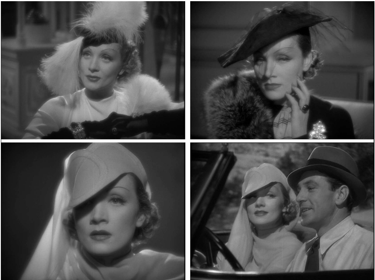
Fig. 3 – Frank Borzage, Désir ( Desire , 1936)

Voilà ce que nous pouvons glaner dans les archives du film, les analyses des meilleurs spécialistes de Borzage et un premier repérage du film tel qu'on le voit. Il était également important de préciser ces points de fabrication du film pour ne pas rabattre le film rival sur un cas fréquent dans l'histoire du cinéma, notamment hollywoodien, et dont je n'ai pas encore parlé : les scènes tournées par un autre cinéaste . Comme par exemple – et pour en rester à Borzage – les deux seules scènes de guerre de sa filmographie, mises en boîte l'une par John Ford ( L'Heure suprême ), l'autre par Jean Negulesco ( L'Adieu aux armes ). Il ne s'agit pas là d'une expérience métastatique du film car rien, dans de telles scènes, ne vient affoler, même provisoirement, la forme dominante du film. On voit au mieux un décrochage, d'autres fois cela passe tout à fait inaperçu : mais rien là d'une excroissance tumorale.