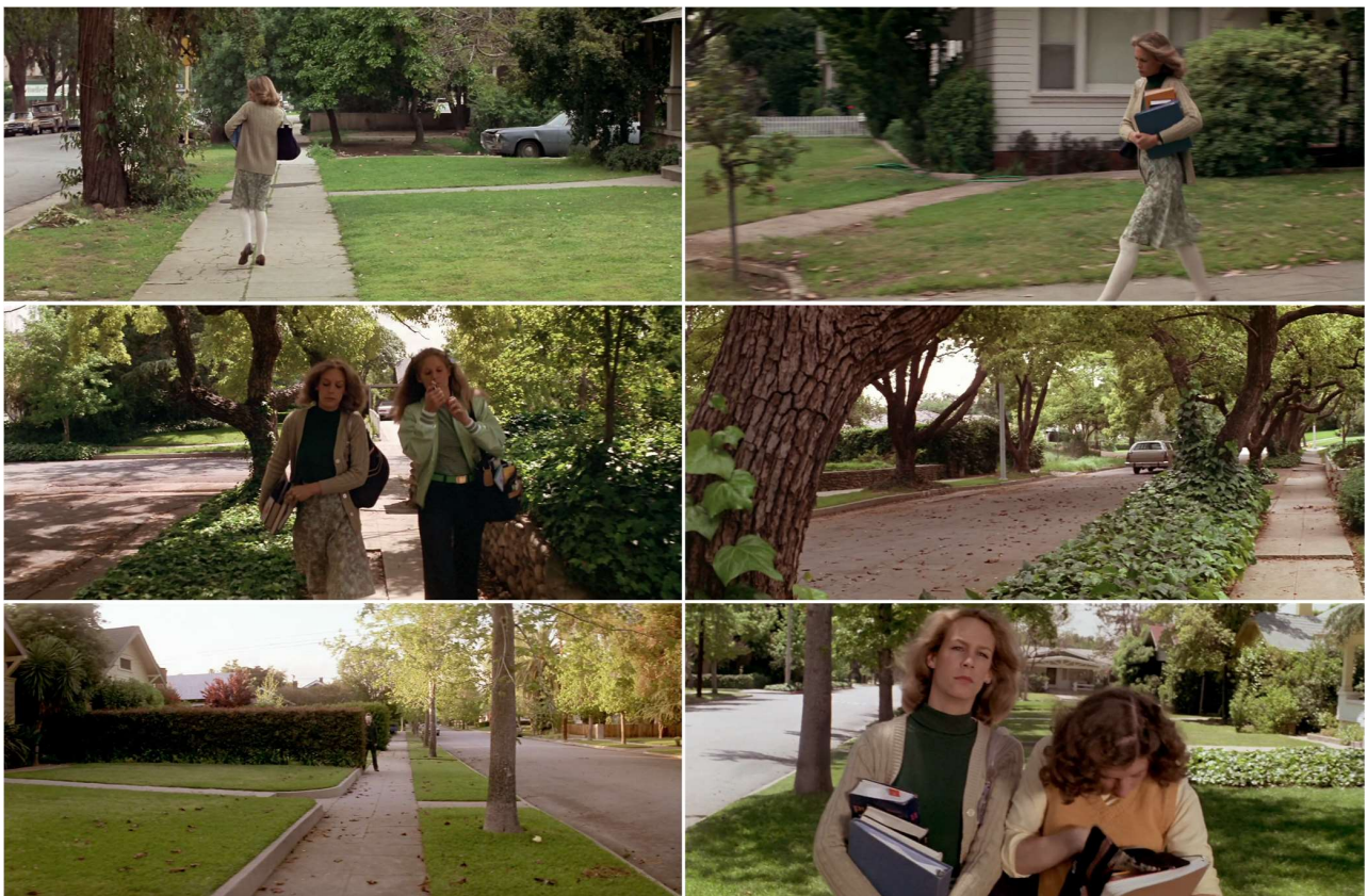
Fig. 9 – John Carpenter, Halloween, la nuit des masques ( Halloween , 1978)

Surtout, ces scènes installent une idée que bien d'autres films américains investiront par la suite à leur manière dans la banlieue américaine bourgeoise – Les Griffes de la nuit , Blue Velvet , Les Banlieusards , Edward aux mains d'argent – et qui commençait à devenir un cliché dans le cinéma hollywoodien [18], rencontrant celui de toute une pensée politique du pacte social en général (Hobbes, Freud) : l'étrange, l'insolite, l'horreur, le mal viennent moins d'ailleurs (un asile que nous ne voyons pas vraiment, un tueur sans visage) que de l'intérieur de nous-mêmes et de notre civilisation. Il suffit de gratter sous la surface et de briser le miroir des apparences. Ce poncif me retient moins pour lui-même que pour le film d'Hitchcock auquel il nous renvoie et qui est ici très subtilement distillé par Halloween (sinon par Carpenter).