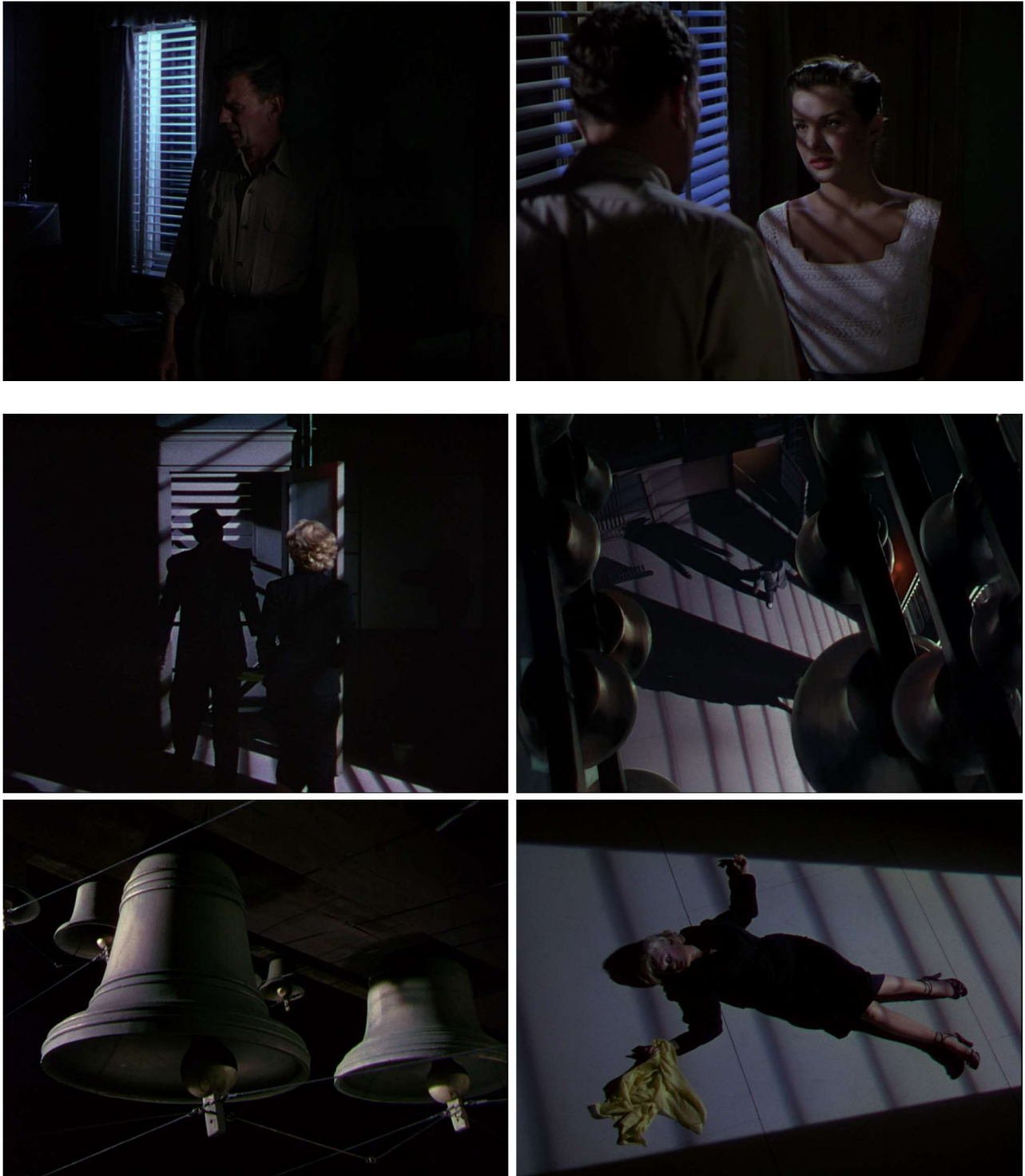
Fig. 13 – Henry Hathaway, Niagara (1953)

lumière : fenêtres obstruées, voyant rouge indiquant la sortie). – Nuit, enfin : celle au-dehors dans la première scène chronologiquement (le Technicolor nous la montre d'ailleurs comme ce qu'elle est : bleue).