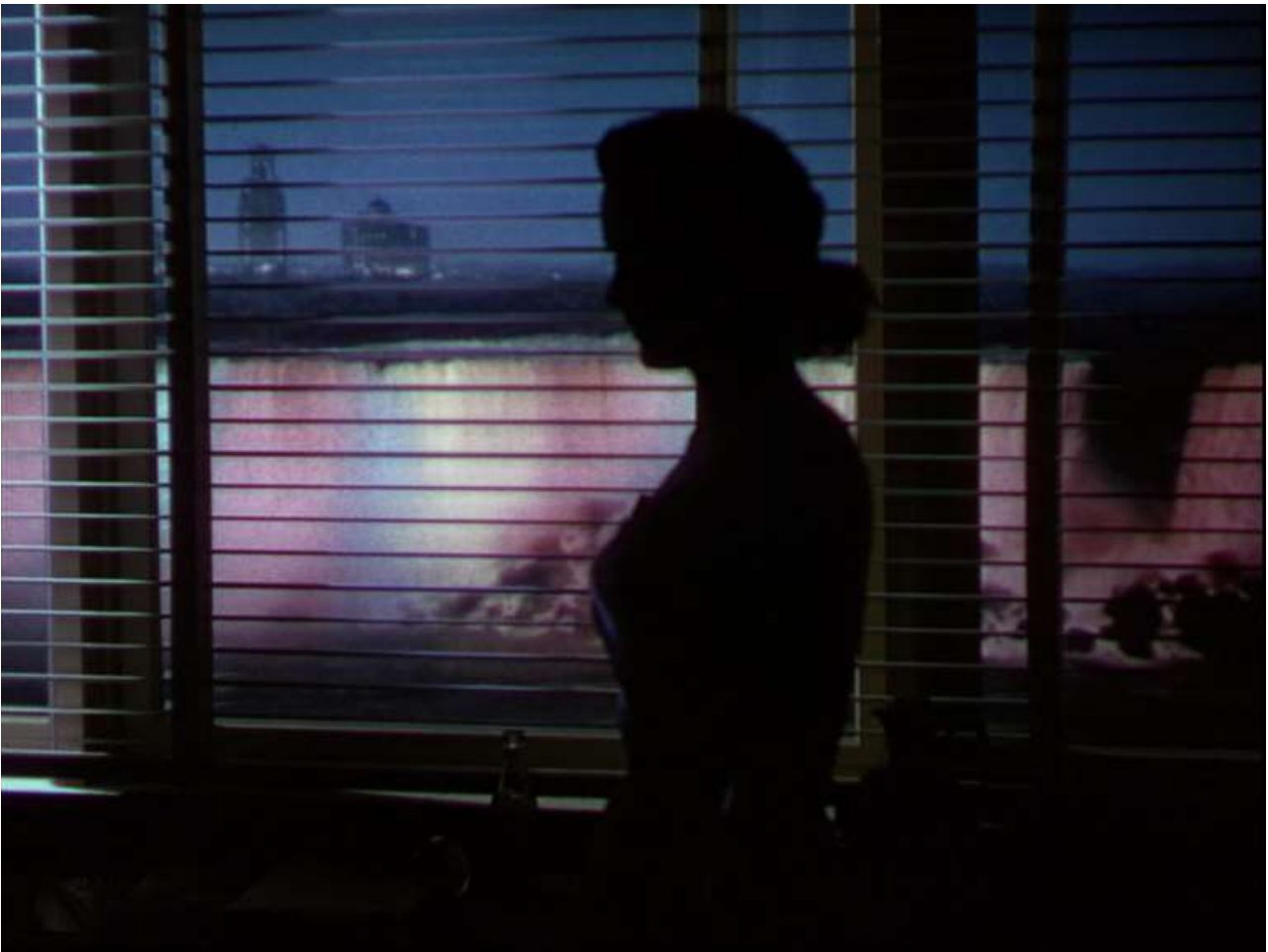
Fig. 12 – Henry Hathaway, Niagara (1953)

Le film comporte pourtant plusieurs scènes – au moins deux – dont le travail sur l'ombre est absolument remarquable. C'est précisément par ces scènes qu'une esthétique rivale affecte Niagara .