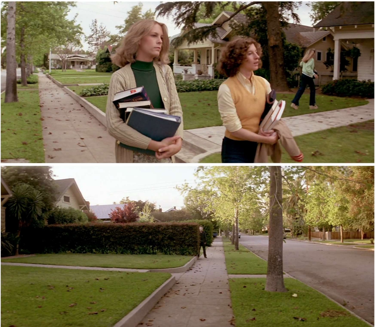
Fig. 11 – Henry Hathaway, Niagara (1953) John Carpenter, Halloween, la nuit des masques ( Halloween , 1978)

Voilà qui pourrait paraître curieux, à tout le moins, mais qui m'amène à formuler une hypothèse encore plus incongrue au premier abord : se tapit, dans Niagara , un film rival, qui – disons-le encore ainsi pour l'instant – relève d'une même esthétique que celle qui domine dans Halloween . À savoir une esthétique sombre et ténébreuse. Une telle assertion pourrait sembler surprenante quand on songe au très beau Technicolor de Niagara , que viennent souligner régulièrement plusieurs moments chromatiques, comme les arcs-en-ciel ou le spectacle des chutes éclairées la nuit (spectacle observé depuis la pénombre d'une chambre et à travers une fenêtre : l'ensemble reproduisant les conditions de la projection cinématographique) [Fig. 12].