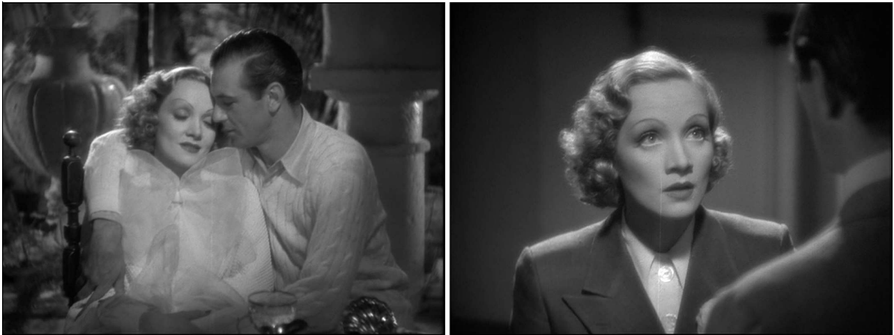
Fig. 6 – Frank Borzage, Désir ( Desire , 1936)

Les deux autres scènes, sur lesquelles je vais passer sans autre forme de procès, entre Madeleine et Tom, qui encadrent la scène à tiroirs (sans, puis avec, puis sans Carlos) avec le monologue disruptif de Tante Olga, et semblent en prévenir et en prolonger l'action, en amont et en aval, vont venir le confirmer, pour leur originalité principale, dans le répertoire visuel [Fig. 6]. De tout Désir , un « désir demeuré désir » (pour pasticher très librement René Char), ce sont les scènes dans lesquelles les éclairages sont les plus proches de ceux que l'on trouve dans les mélodrames muets de Borzage : lumière diffuse sans source physique assignable, arrière-plan imprécis, espace opalescent, sentiment d'arrêt du temps (dans les moments les plus intenses : aveu d'une faute, déclaration d'amour), interprétation feutrée [16].