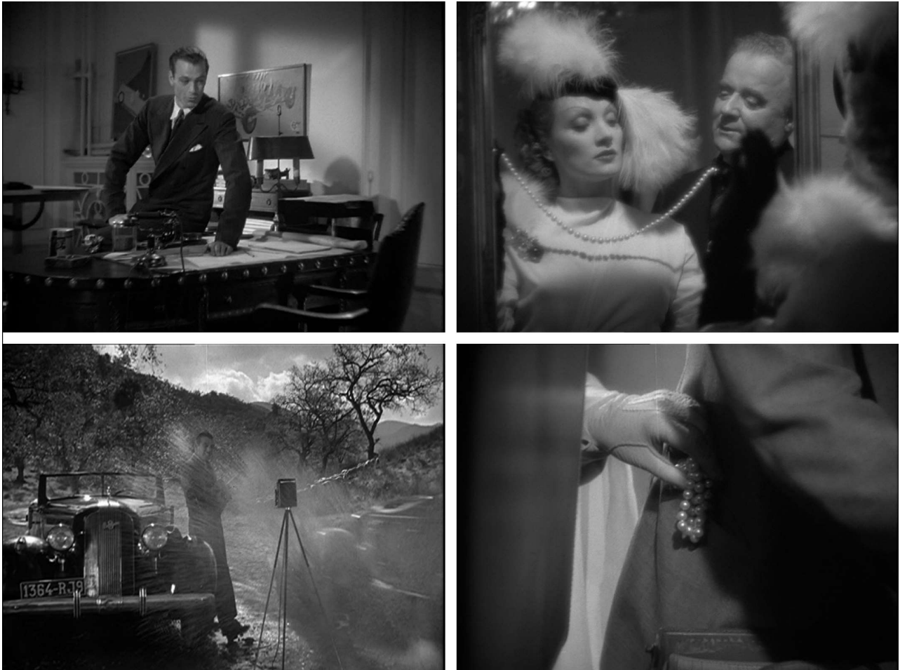
Fig. 2 – Frank Borzage, Désir ( Desire , 1936)