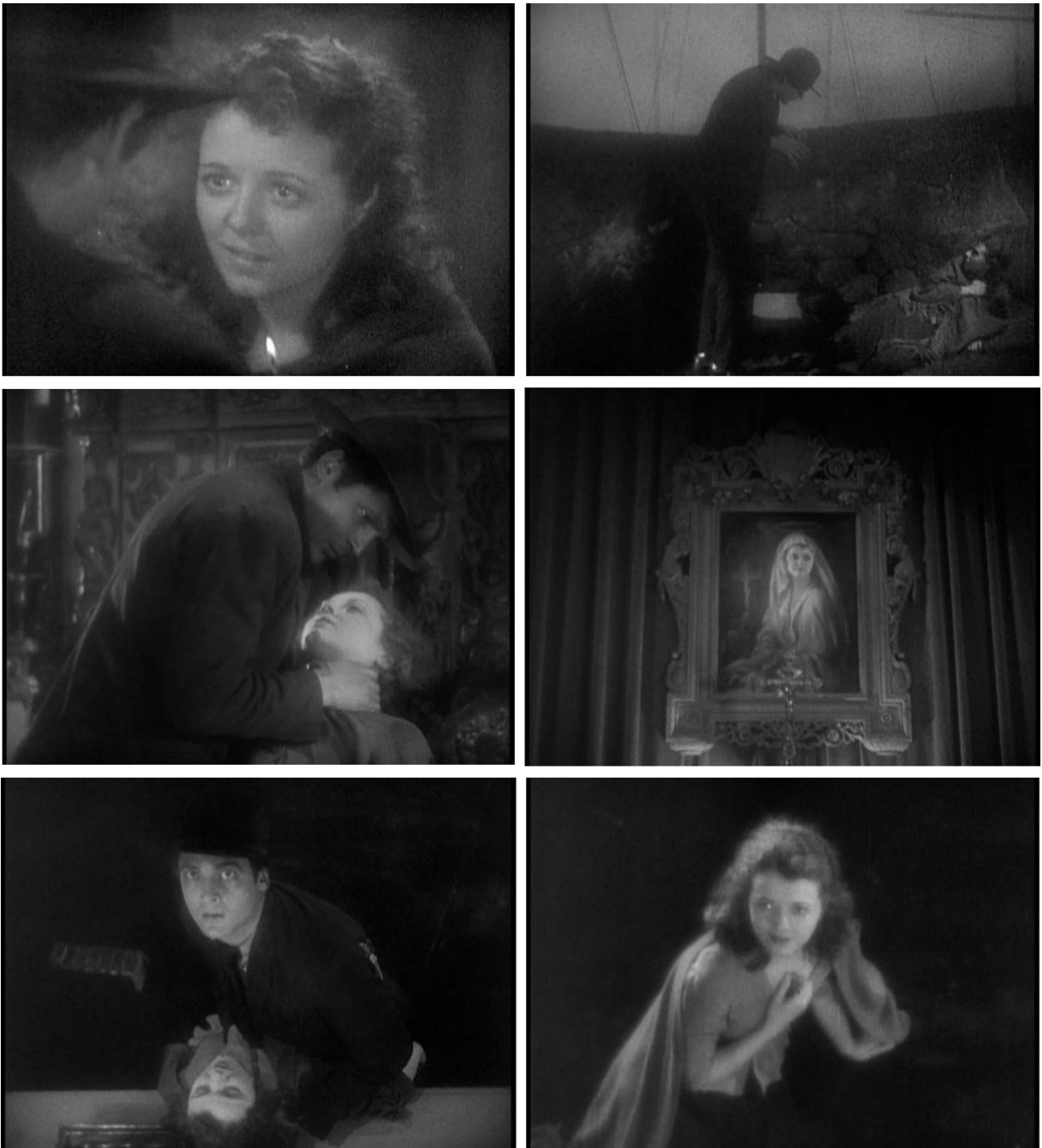
Fig. 5 – L'Ange de la rue ( Street Angel , 1928)