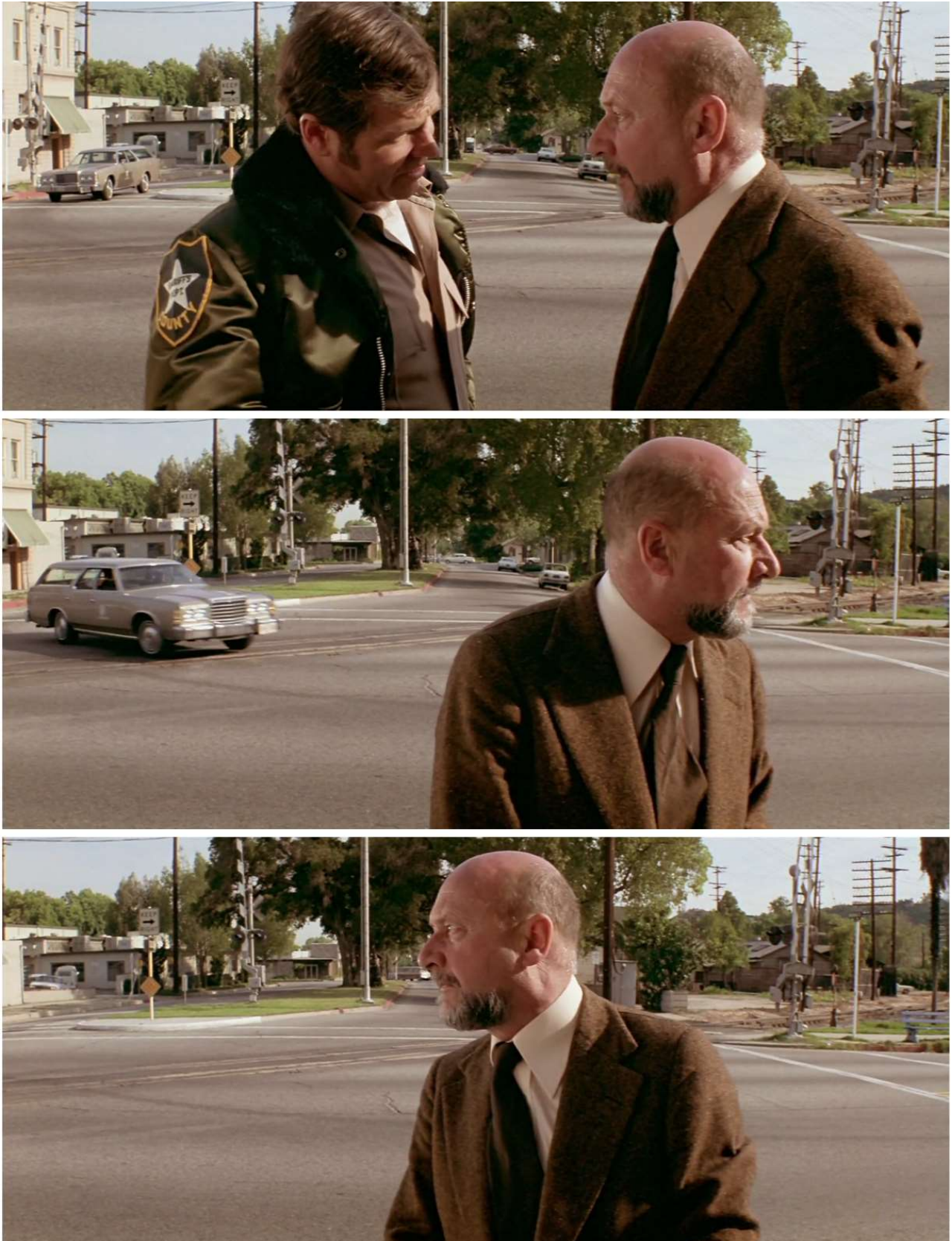
Fig. 8 – John Carpenter, Halloween, la nuit des masques ( Halloween , 1978)

Mais ce n'est pas le commentaire de cette scène, surexploitée, qui m'intéresse ici. Je me contente de souligner sa ressemblance avec la scène de Halloween où le docteur Loomis arrive à Haddonfield et avertit le shérif local de la présence de Myers échappé de l'asile. À ce moment exact, on peut voir la voiture conduite par le tueur passer dans le dos du psychiatre, qui ne la voit précisément pas parce qu'il tourne la tête de l'autre côté, dans un mouvement identique – mais en sens inverse : de la droite de l'image vers la gauche – à celui de Scottie dans Vertigo [Fig. 8].