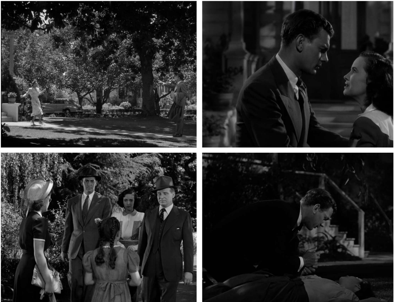
Fig. 10 – Alfred Hitchcock, L'Ombre d'un doute ( Shadow of a Doubt , 1943)

l'odeur des céréales au petit-déjeuner. Comme dans Halloween , la menace vient moins de l'extérieur (l'assassin arrive de Philadelphie) qu'elle ne gronde sous la surface policée de la société : ce n'est pas par hasard que ce frère porte, chez Hitchcock, le même prénom que sa nièce, Charlie. Charlie est Charlie . Cette phrase ouvre plus d'une possibilité de lecture [Fig. 10]. Et autant de fois que Myers se relèvera de sa propre mort, Charlie essaiera à trois reprises de tuer la jeune fille qui l'a démasqué : en sciant une marche d'escalier, en l'enfermant dans le garage, en la poussant d'un train.