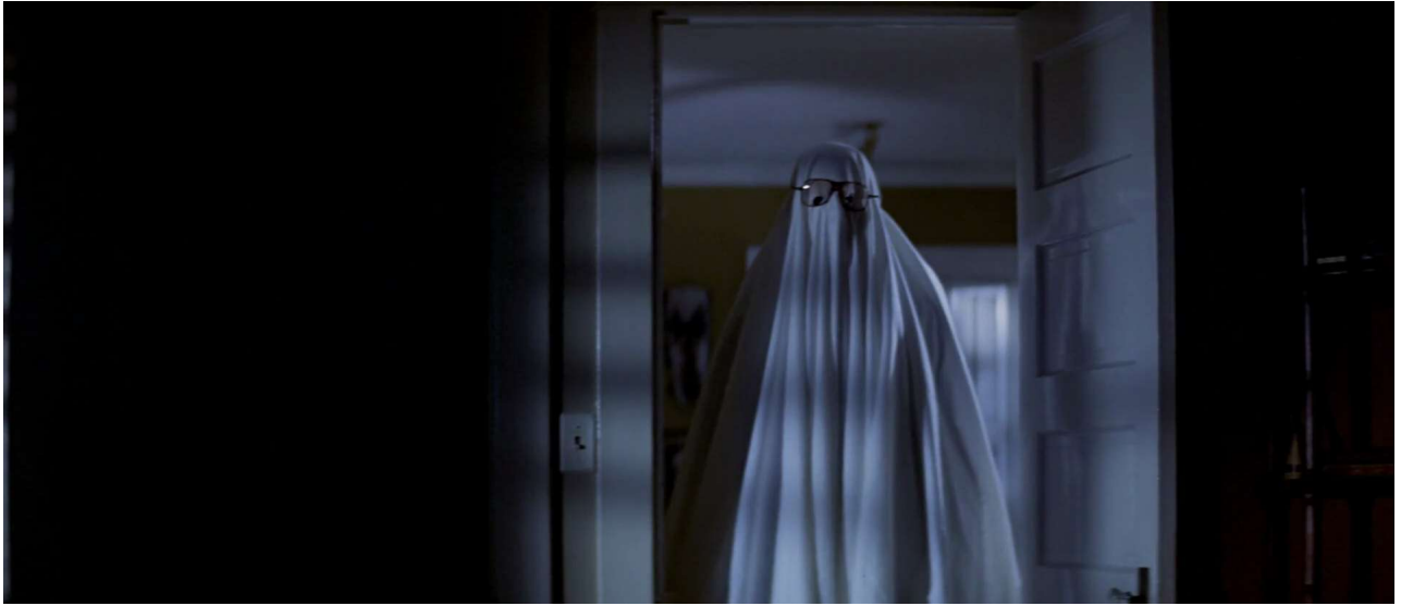
Fig. 14 – John Carpenter, Halloween, la nuit des masques ( Halloween , 1978)

revanche, c'est tout le sujet de Halloween et de son meurtrier au masque blanc qui ne veut pas mourir, et qui se déguisera même à un moment donné en revenant de pacotille pour le cas où nous n'aurions pas très bien compris [Fig. 14].