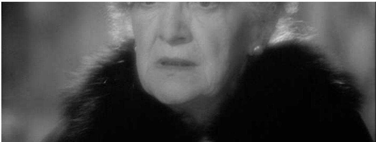
Fig. 4 – Frank Borzage, Désir ( Desire , 1936)