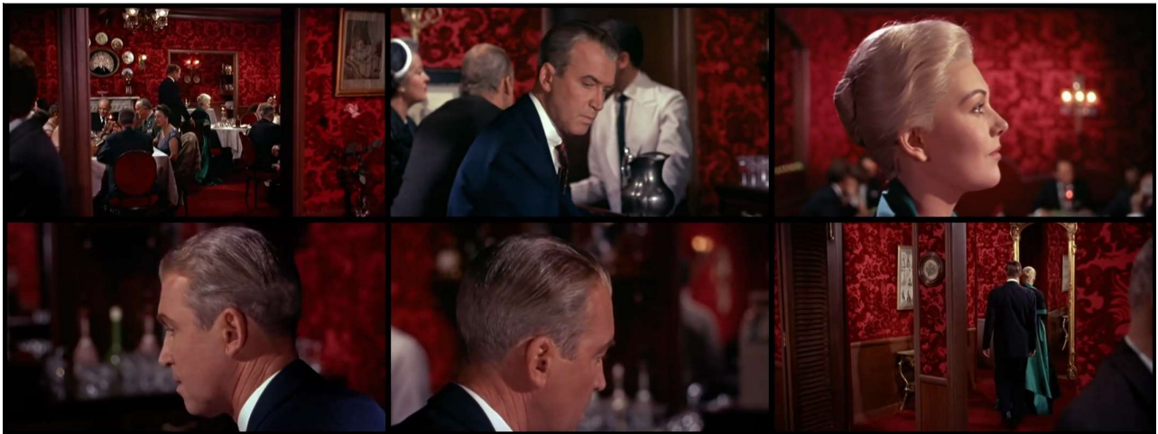
Fig. 7 – Alfred Hitchcock, Vertigo (1958)

Tout cela est très superficiel. En revanche, on a moins souvent signalé, voire pas du tout, que le film de Carpenter – sans aller jusqu'aux ébouriffantes exégèses visuelles que peuvent constituer certains « refilmages » de scènes hitchcockiennes chez Brian De Palma – présente des points d'accroche beaucoup plus précis, toujours bien visibles pourtant à qui sait regarder, avec quelques-uns des moments emblématiques du corpus hitchcockien. Il en va ainsi de la fameuse scène du restaurant Ernie's dans Vertigo (1958), au cours de laquelle Scottie est censé voir Madeleine pour la première fois, prétendument à son insu, afin de pouvoir la prendre en filature sur la demande de son ancien camarade d'études et époux de la dame en question, Gavin Elster [Fig. 7].