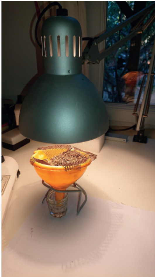
Piège de Berlèse

s'enfouissent à la recherche de la fraîcheur et finissent par tomber au travers de l'entonnoir dans un bocal contenant de l'alcool.