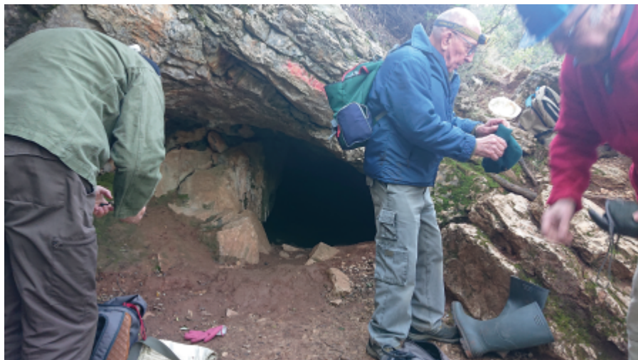
Entrée de la grotte.

L'entrée est composée d'un couloir assez bas, on comprend bien d'où la grotte tire son nom, il faut ramper avant d'atteindre un couloir plus vaste. À l'époque où la spéléologie faisait partie de la SSNATV, cette grotte a été explorée comme décrit dans les annales de la SSNATV n° 4 1951-52 et celle n° 104 d'avril 1957.