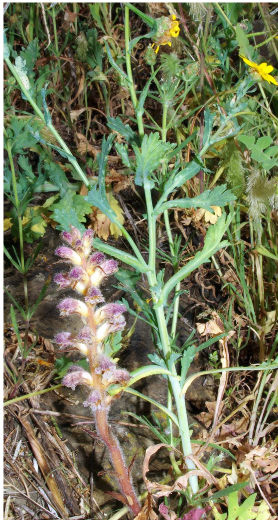
Fig. 1. Individuo de Orobanche pubescens y su hospedante Glebionis segetum en el borde de la GI-614 cerca de Cadaqués (Gerona).

nos, carreteras y cultivos sobre suelos silíceos, que albergan a su hospedante local ( Glebionis segetum ) son comunes en el litoral de la comarca de l'Alt Empordà. El mapa presentado aquí a la presencia de O. pubescens en el sur de Francia y en la Península Ibérica (fig. 3).