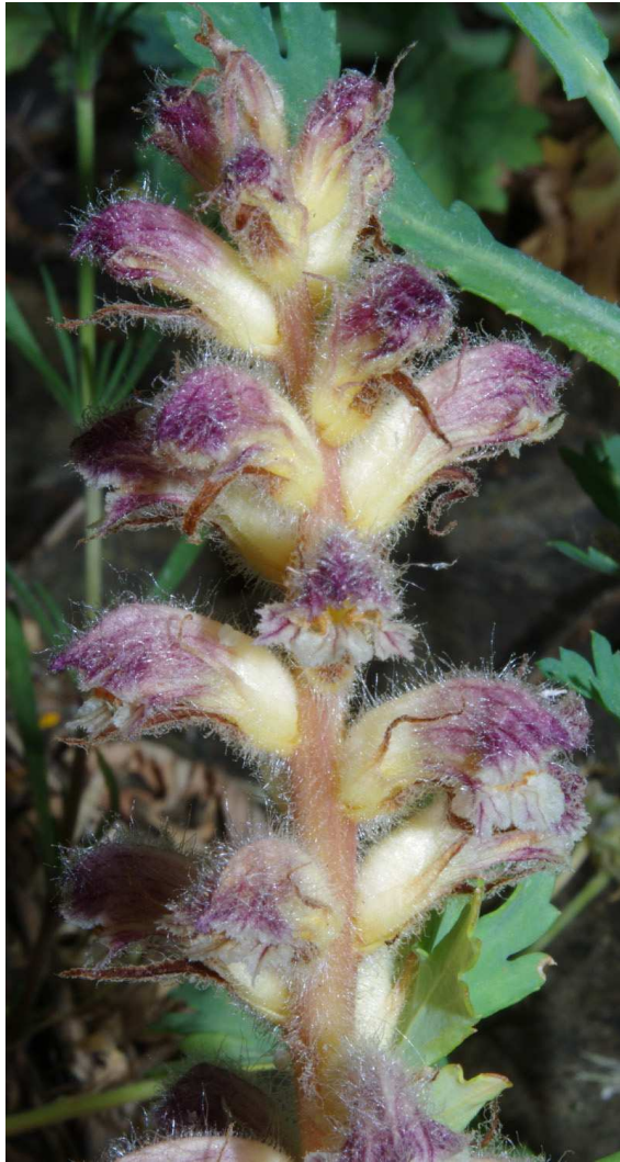
Fig. 2. Detalle de Orobanche pubescens en la misma población de la imagen anterior.

ecología nos permite pensar que la planta estará fuera de peligro de extinción.