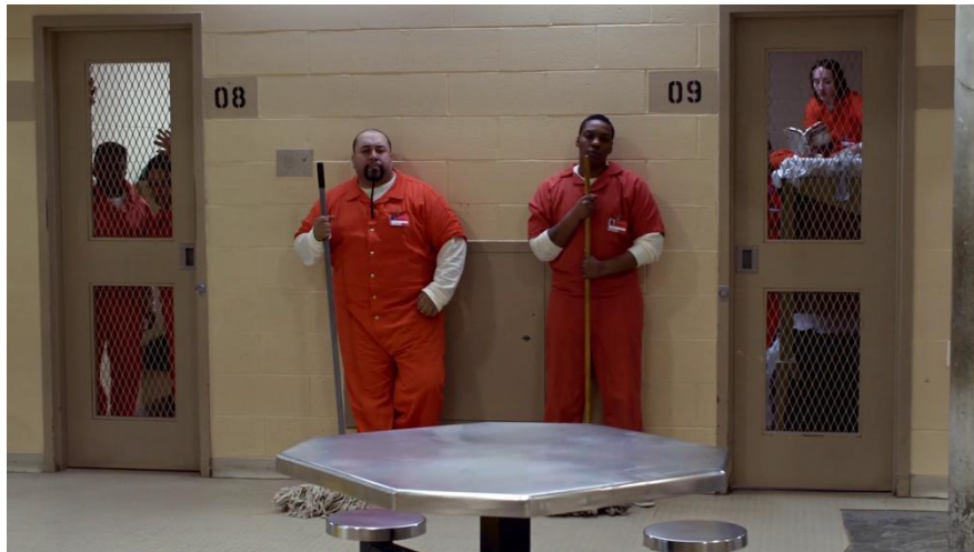
Saison 2, épisode 1 "Thirsty Bird"

Alors que les hommes sont majoritairement exposés comme prédateurs sexuels constituant une menace pour les femmes, leur bestialité n'en est pourtant que banalisée. Dans la prison mixte de Chicago, les hommes, dépeints comme animaux aux pulsions incontrôlables, sont forcés de s'adosser aux murs lorsque les femmes, d'ailleurs déshumanisées et désignées par les surveillants comme "femelles", traversent les parties communes. Sur le plan ci-dessous, les téléspectateurs sont, par l'usage d'une prise de vue subjective, positionnés dans la peau d'une détenue traversant ces parties communes et faisant face au regard de ces hommes, captés en plan moyen, adossés au mur ou plus féroce ment appuyés contre la porte de leur cellule en arrière-plan gauche, tels des prédateurs prêts à bondir sur leur proie. Dépeinte comme naturelle et irréversible, la bestialité de ces hommes et le harcèlement sexuel qui en découle semble être normalisés voire acceptés.