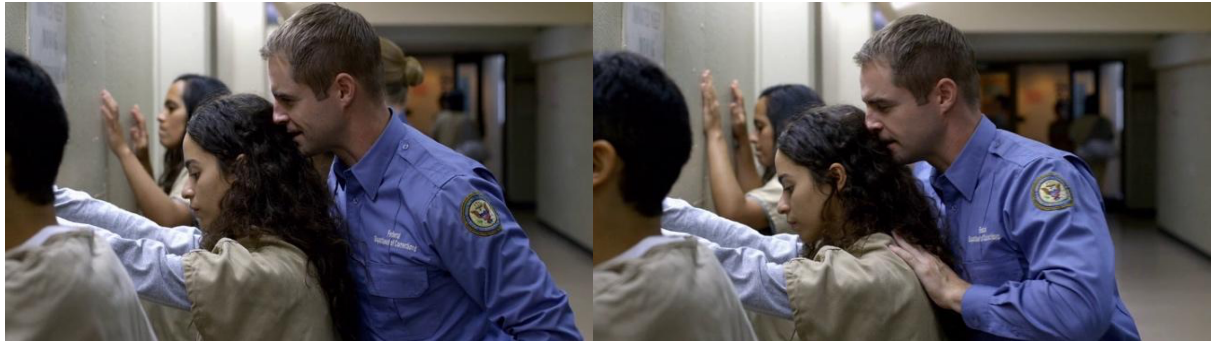
Saison 4, épisode 5 "We'll always have Baltimore"

Comme l'indique ce plan rapproché, permettant de mettre en avant la gestuelle et l'expression faciale des personnages, le surveillant profite d'une rapide et inopinée fouille au corps pour attraper et palper, à pleines mains, les seins de la détenue qu'il contrôle. La gestuelle du surveillant est alors ponctuée d'une note sonore en off insistant sur la gravité du comportement envers la détenue dont l'expression faciale rend compte de son sentiment d'impuissance et du caractère envahissant de l'agression sexuelle perpétrée sur elle.