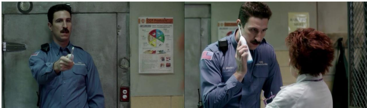
Saison 1, épisode 6 "WAC Pack"

Aux prémices de la série, Pornstache prend pour cible la détenue Red qu'il considère comme obstacle à son réseau de contrebande. Dans une volonté d'intimidation, le surveillant pénètre la sphère intime de la détenue, empiète sur son lieu de travail qu'est la cuisine et use de propos à connotation sexuelle envers elle : « So you're not taking dirty pictures of your hairy pussy to send to your husband? Do the curtains match the drapes? You got some purple wispies down there? ». En référant ainsi à l'organe génital et aux poils pubiens de Red, le surveillant intimide cette dernière qu'il met dans l'inconfort et le malaise et prend l'ascendant sur la détenue. L'occupation scénique déployée par l'acteur met d'ailleurs cette impression en exergue puisque le personnage, capté en plan rapproché, est montré usant d'une gestuelle dérangement et loufoque, presque menaçante, grignotant littéralement sur l'espace personnel de la détenue. Le son continu de la brosse à dent électrique qu'il tient en main, quant à lui, ajoute à la présence pesante du surveillant.