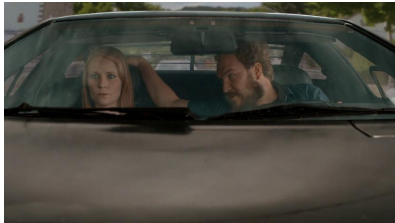
Saison 7, épisode 2 : "Just Desserts"

Au cours de la quatrième saison (marquant peut-être un tournant important dans l'engagement politico-social de la série), la détenue Doggett est dépeinte comme l'un des personnages féminins le plus touché par les faits de harcèlement sexuel. Après son viol, celle-ci continue de subir les avances sexuelles du surveillant Coates qui la traite comme un chien (en écho à l'onomastique « Doggett »). Le plan rapproché sur les deux personnages, met d'ailleurs en évidence le côté animal du surveillant qui déclare : « It's taking everything I got not to throw you down and fuck you right now ». Alors que ce dernier semble concevoir les rapports sexuels comme une soumission de la femme à l'homme, le plan permet d'insister sur la pression physique et mentale qu'il exerce sur la détenue qui, étouffée, ne peut s'en détourner ni en échapper ; elle est filmée comme la proie de Coates.