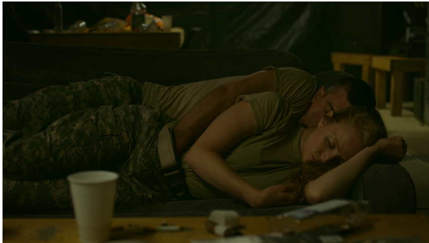
Saison 7, épisode 2 : "Just Desserts"

Si la surveillante McCullough est victime d'avances sexuelles non désirées, nous pouvons aussi témoigner de faits d'agression sexuelle sur ce personnage dont le passé nous est révélé au travers de flashbacks. Ancienne femme soldat dans l'armée, McCullough évolue dans un environnement majoritairement masculin. Seul membre féminin de son régiment, elle est établie comme unique convoitise des hommes si bien qu'un soir, alors qu'elle est endormie, l'un d'eux entame le rapport sexuel par des contacts physiques dont elle n'a immédiatement conscience et qu'elle ne consent donc pas. Cette agression sexuelle, comme nous pouvons le voir sur le plan ci-dessous, est soulignée par l'usage du plan américain captant la quasi-totalité des corps et insistant par conséquent sur la gestuelle de l'homme en contraste avec la léthargie de la femme qu'il entreprend d'agresser sexuellement. Les choix sonores quant à eux, inexistant, insistent sur le caractère pesant de la scène.