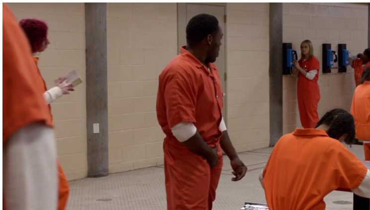
Saison 2, épisode 1 "Thirsty Bird"

En début de deuxième saison, Piper est contrainte, le temps d'un procès, au transfert dans une prison mixte de Chicago. Confrontée au regard masculin, cette dernière se voit forcée de supporter les diverses avances sexuelles qui lui sont faites, qu'elles soient exprimées oralement ou par la gestuelle.