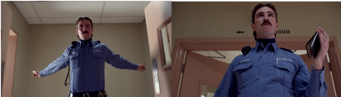
Saison 2, épisode 9 : "Oz of Furlough"

Pornstache fait, à titre d'exemple, les frais du comportement qu'il adopte envers ces femmes. Décidées à le faire renvoyer en lui faisant porter le chapeau pour la grossesse d'une d'elles, les détenues s'allient pour organiser la rencontre et, par conséquent, le rapport sexuel que l'homme ne saurait refuser. Suspecté de viol, le surveillant n'est finalement que congédié et l'affaire étouffée. Après le renvoi de la surveillante Fisher, elle-même victime de harcèlement sexuel, Pornstache est réintégré.