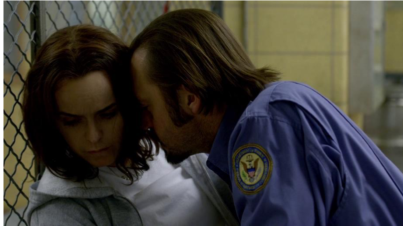
Saison 4, épisode 13: "Toast can't never be bread again"

Au cours de la quatrième saison (marquant peut-être un tournant important dans l'engagement politico-social de la série), la détenue Doggett est dépeinte comme l'un des personnages féminins le plus touché par les faits de harcèlement sexuel. Après son viol, celle-ci continue de subir les avances sexuelles du surveillant Coates qui la traite comme un chien (en écho à l'onomastique « Doggett »). Le plan rapproché sur les deux personnages, met d'ailleurs en évidence le côté animal du surveillant qui déclare : « It's taking everything I got not to throw you down and fuck you right now ». Alors que ce dernier semble concevoir les rapports sexuels comme une soumission de la femme à l'homme, le plan permet d'insister sur la pression physique et mentale qu'il exerce sur la détenue qui, étouffée, ne peut s'en détourner ni en échapper ; elle est filmée comme la proie de Coates.