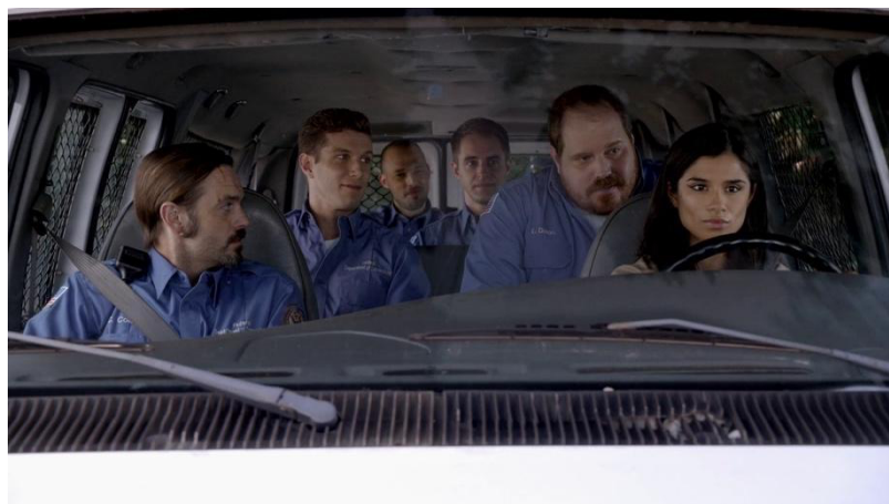
Saison 4, épisode 5 "We'll always have Baltimore"

L'occupation scénique est aussi très importante à relever lorsque la détenue Maritza se retrouve dans un van pénitencier, entourée de cinq surveillants décidés à se jouer d'elle au travers d'allusions sexuelles ( mettre extrait ).