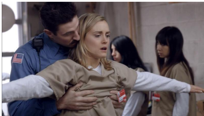
Saison 1, épisode 4 : "Imaginary Enemies"

Dans l'enceinte de la prison, les agressions sexuelles sont perpétrées par les surveillants au travers de fouilles au corps abusives qu'ils utilisent comme prétexte à l'extériorisation de leur dominance, et par conséquent, comme passe-droit à l'expression de leurs désirs sexuels sur les détenues. Pornstache en reste d'ailleurs l'un des meilleurs exemples ( mettre extrait ).