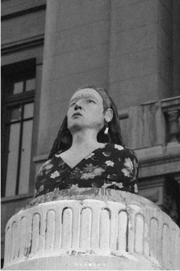
Figure 15. Monumento a Pedro Lemebel. Casa Central Universidad Católica. Santiago de Chile.