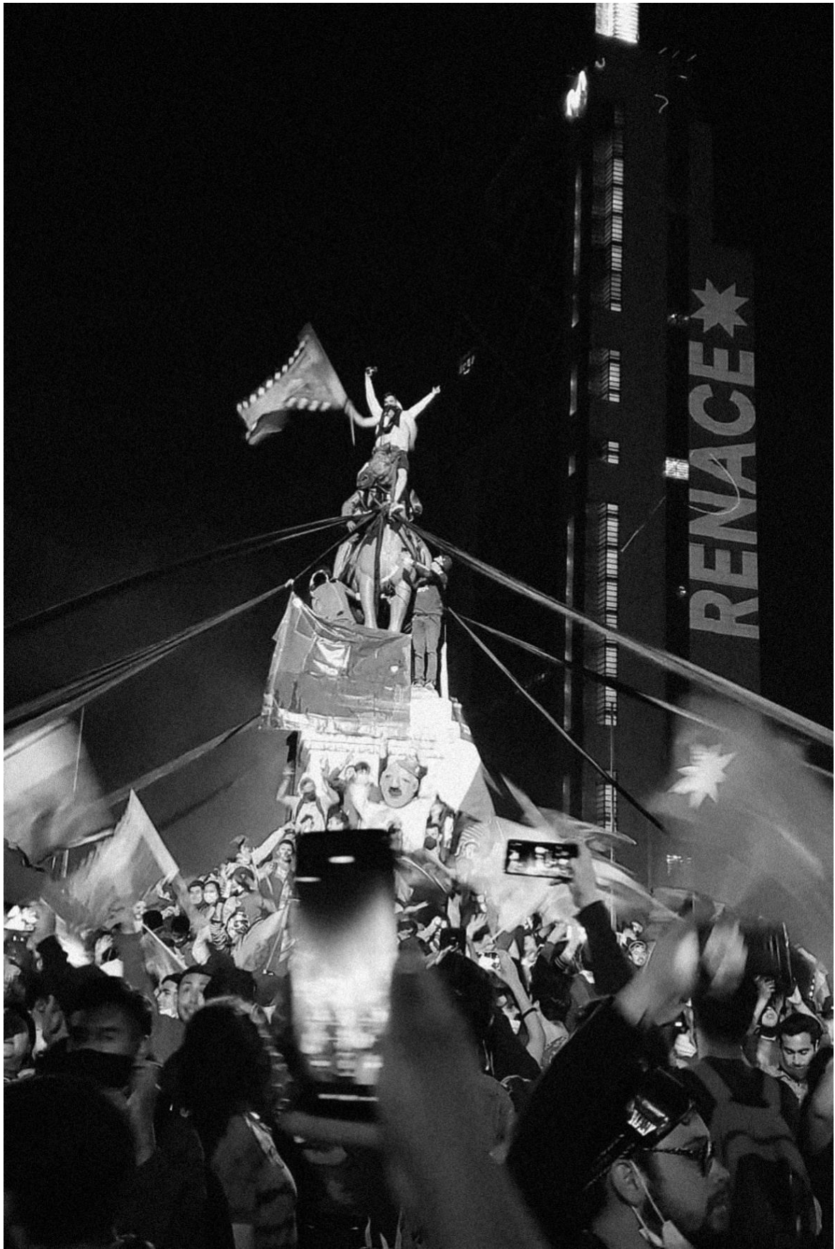
Figure 3. General Baquedano (Renace). Plaza Dignidad. Santiago de Chile.