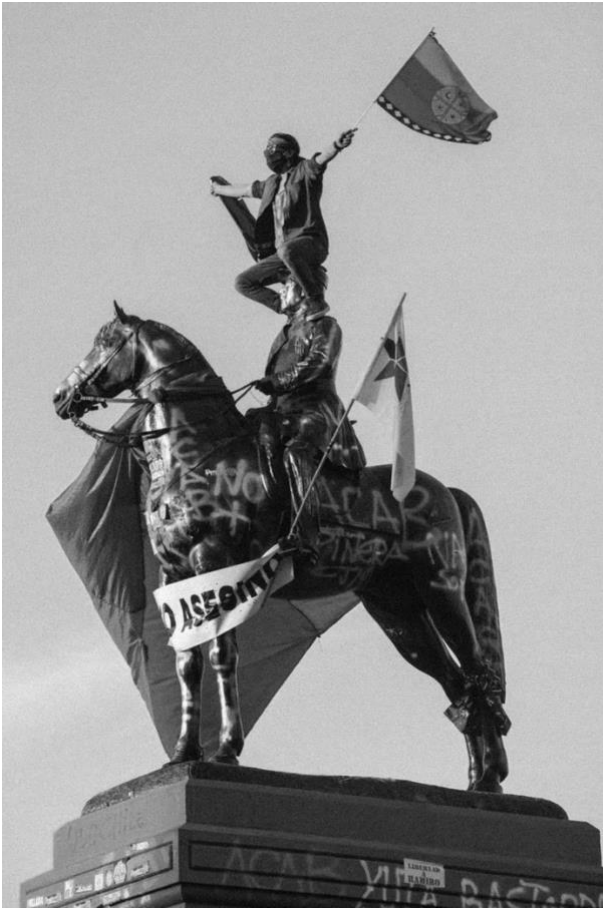
Figure 7. General Baquedano. Plaza Dignidad. Santiago de Chile.