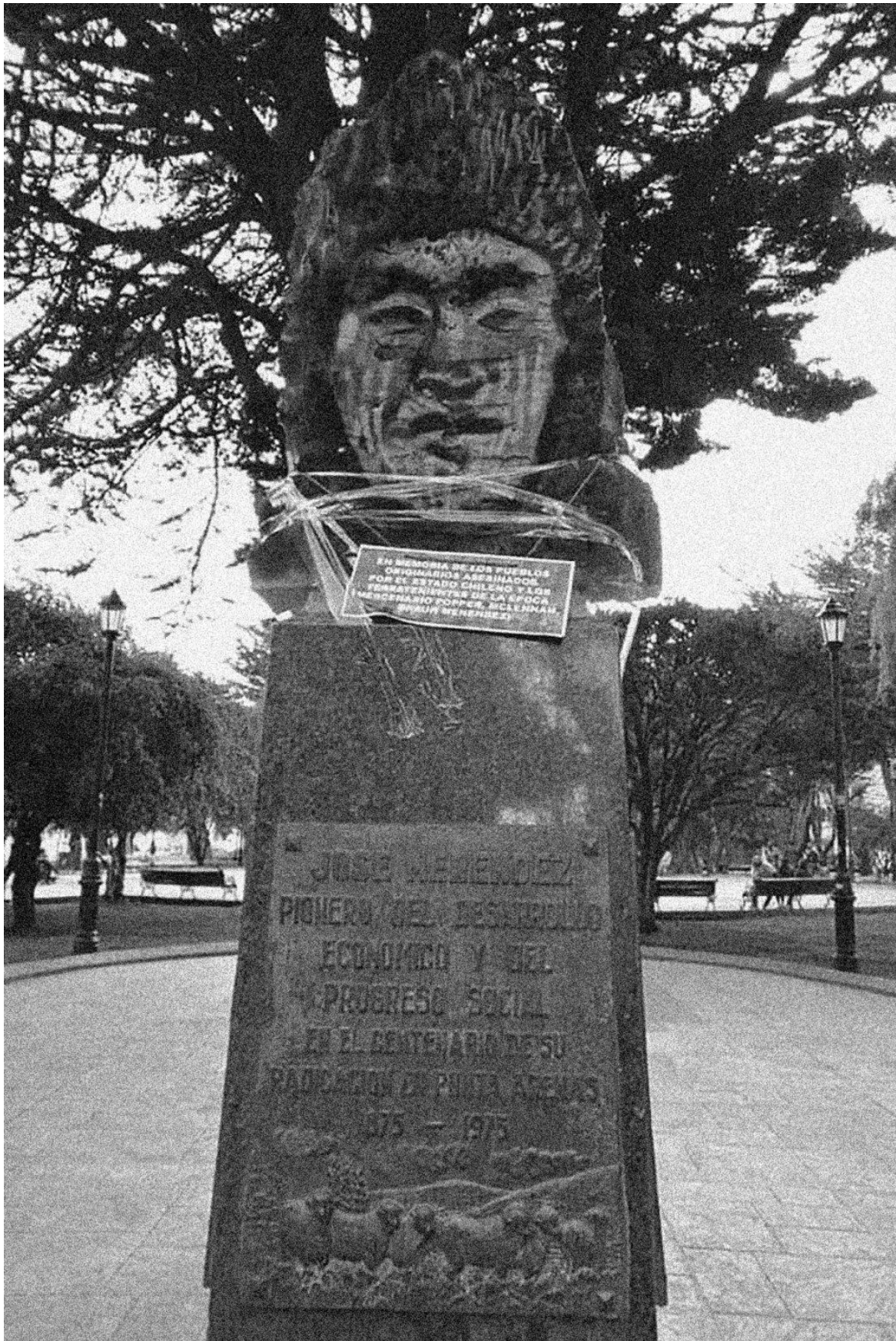
Figure 13. Reemplazo del busto de José Menendez Braun por homenaje a pueblos originarios. Plaza Muñoz Gamero, Punta Arenas, Chile.