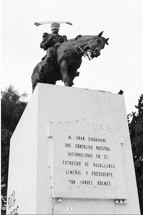
Figure 11. Monumento a Manuel Bulnes. Punta Arenas. Chile.