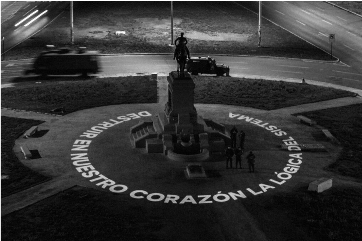
Figure 1. General Baquedano. Plaza Dignidad. Santiago de Chile.

Toutes ces images sont libres de droits.