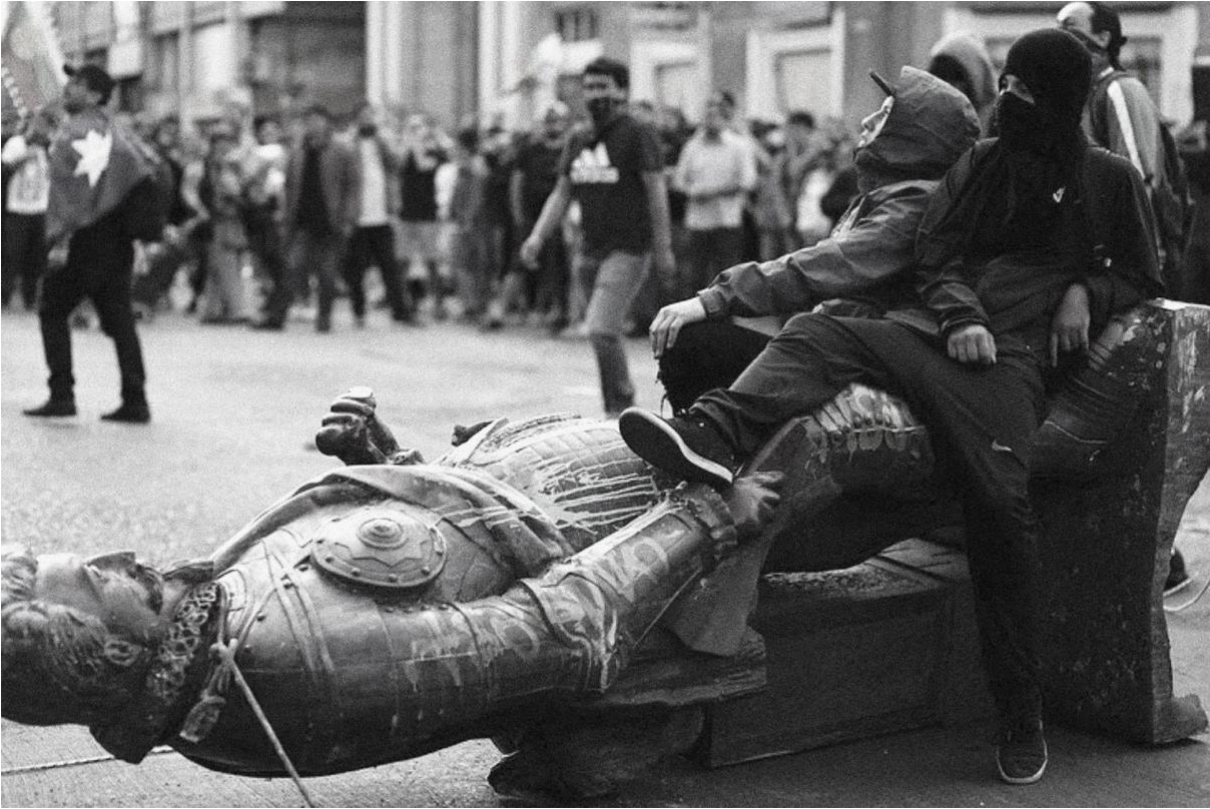
Figure 9. Pedro de Valdivia. Plaza Independencia. Concepción, Chile.