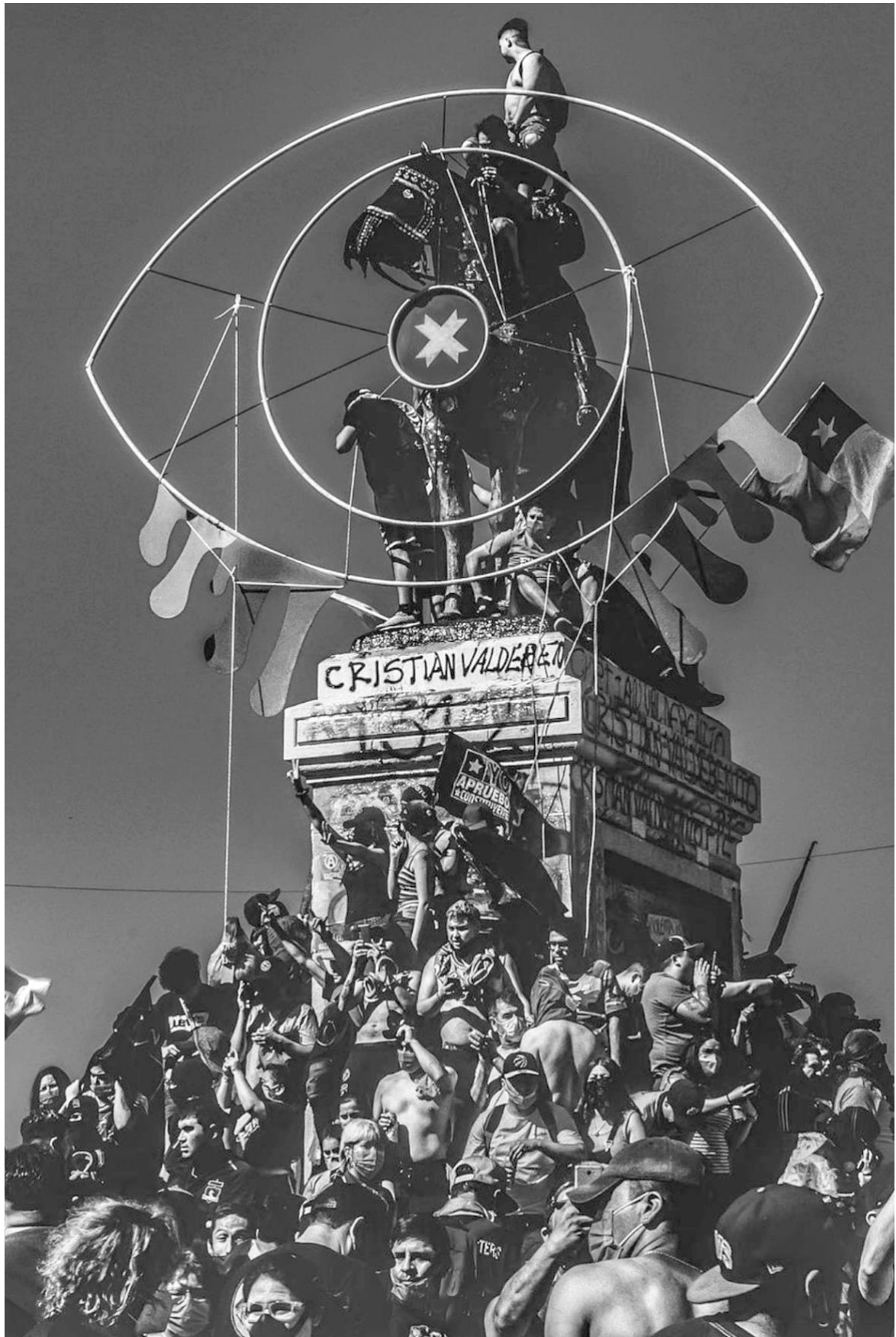
Figure 4. General Baquedano. Plaza Dignidad. Santiago de Chile.