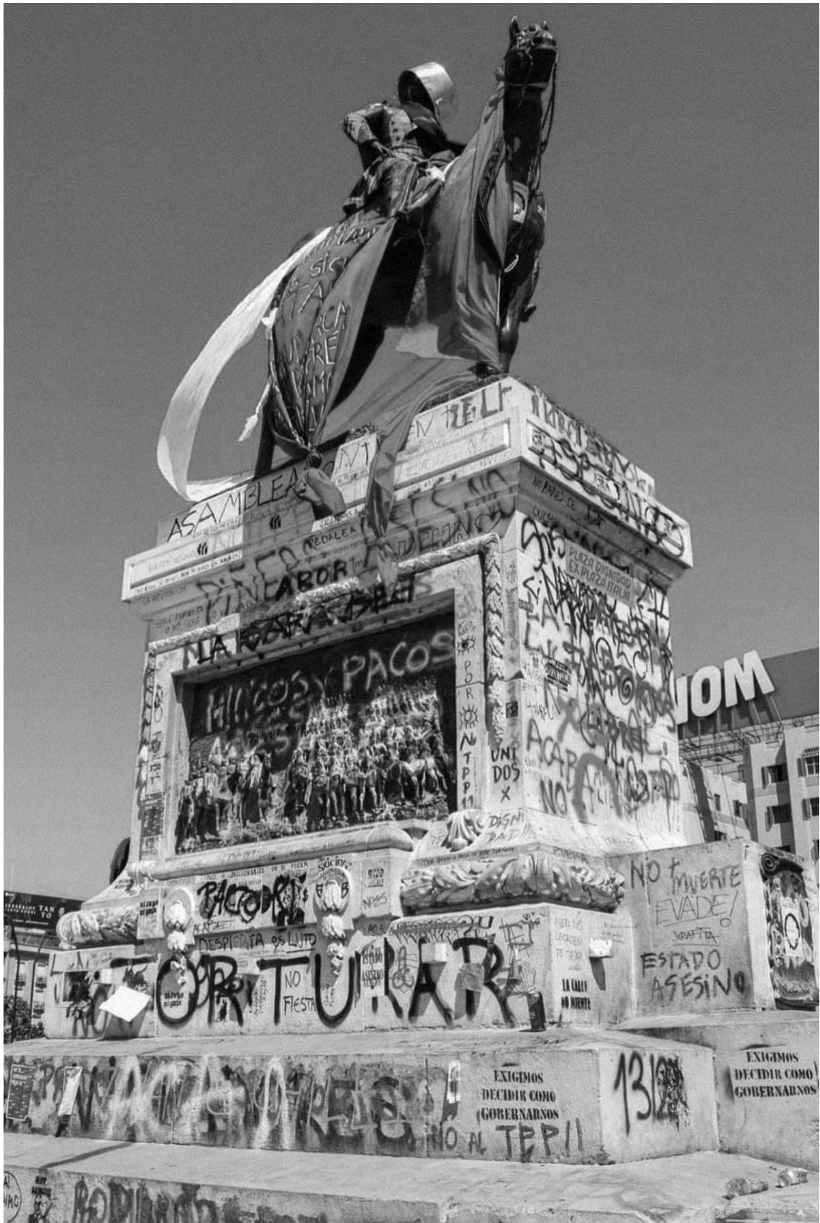
Figure 6. General Baquedano. Plaza Dignidad. Santiago de Chile.