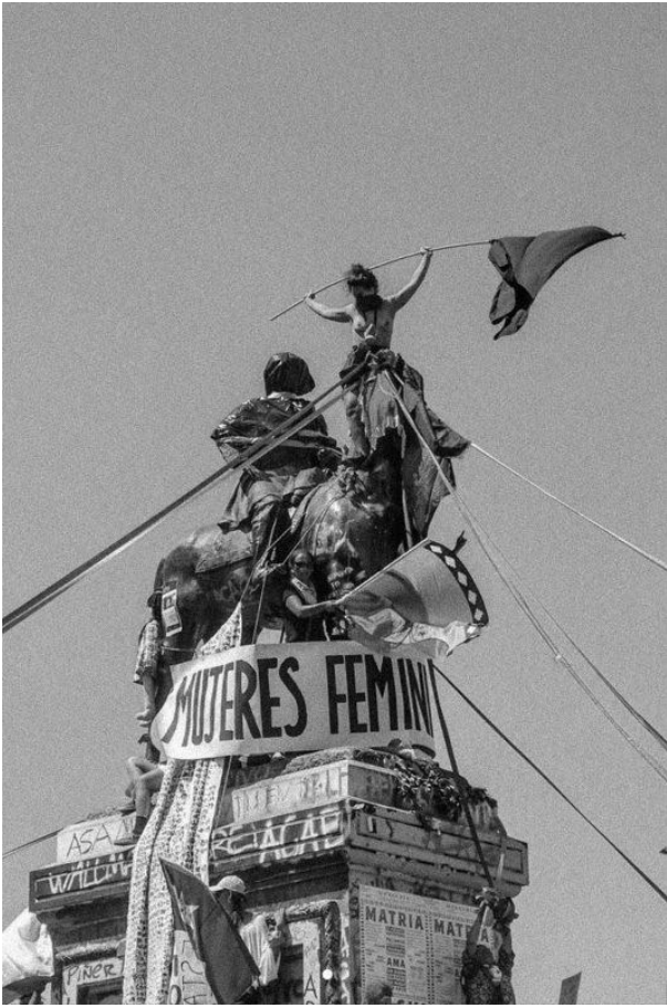
Figure 8. General Baquedano. Plaza Dignidad. Santiago de Chile.