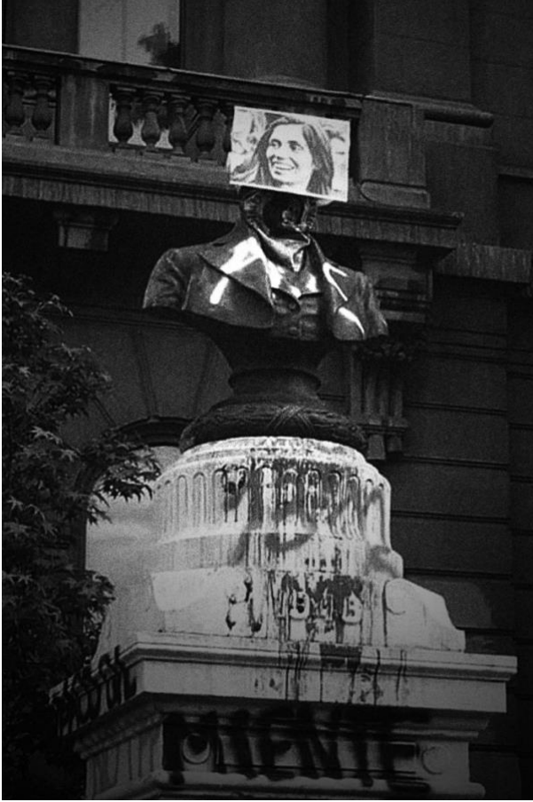
Figure 14. Monseñor Carlos Casanueva. Casa Central Universidad Católica. Santiago de Chile.