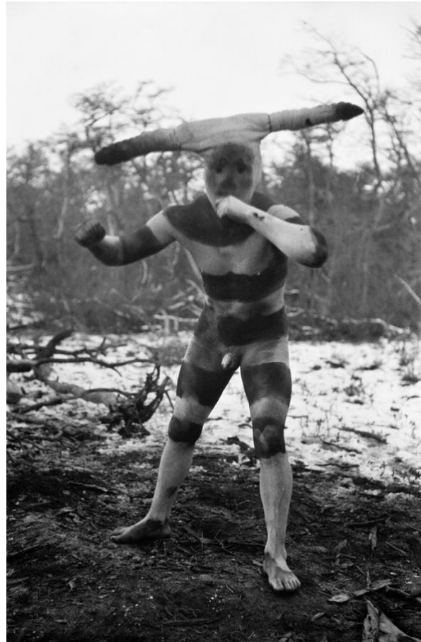
Figure 12. « Halahaches O Kotaix », Selkman, Patagonia. Martin Gusinde. 1923.