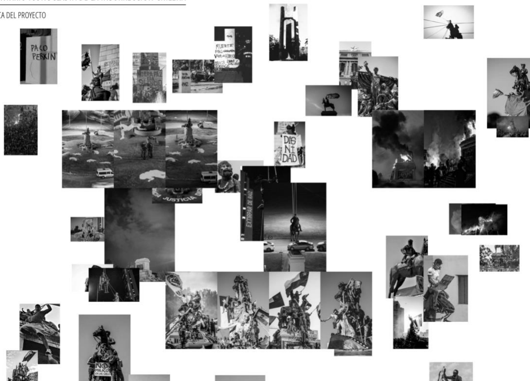
Figure 2. Capture d'écran du site internet hébergeant l'« Inventario Iconoclasta de la Insurrección Chilena », en date du 20 mars 2021.