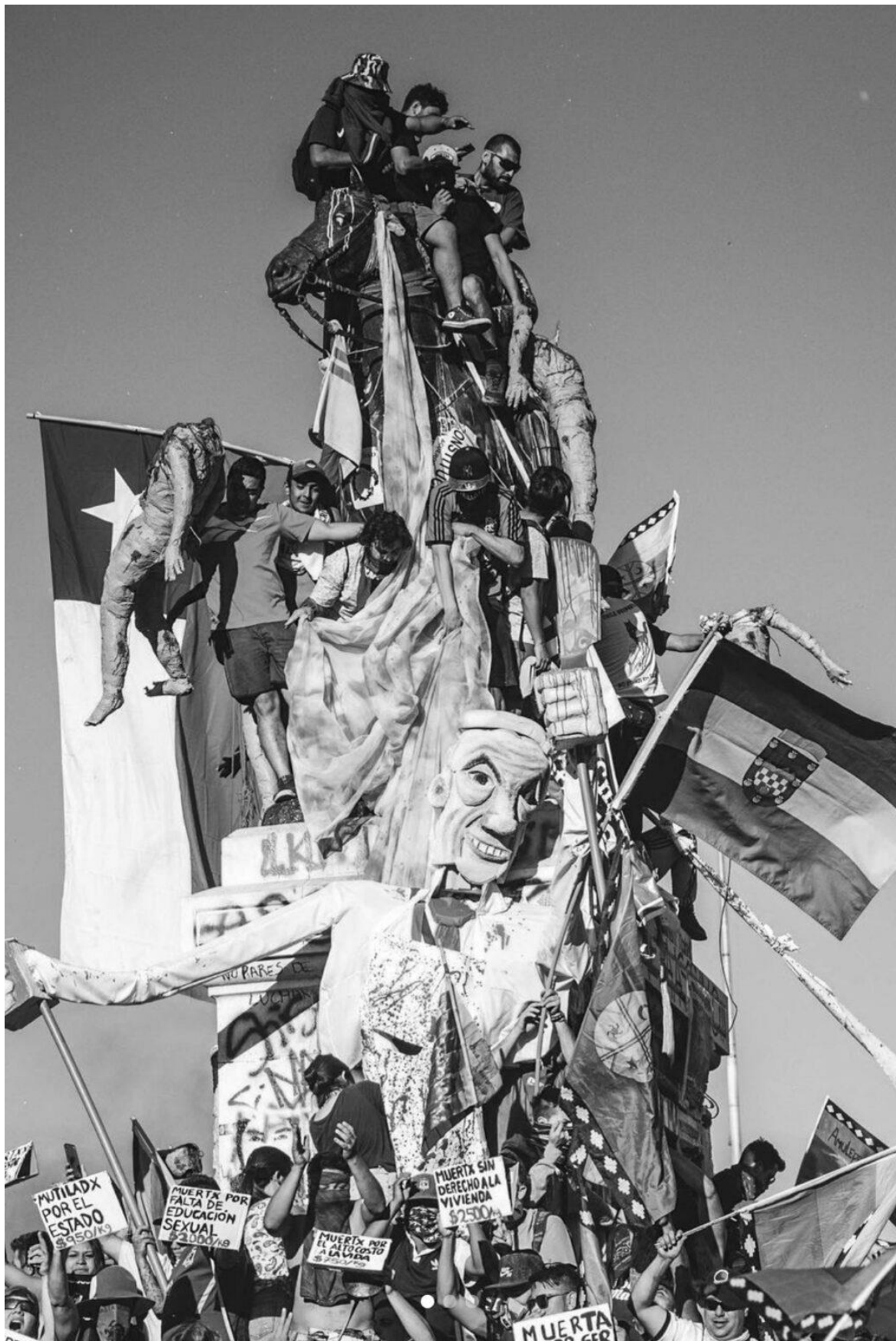
Figure 5. General Baquedano. Plaza Dignidad. Santiago de Chile.