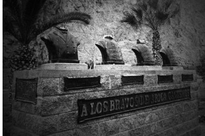
Figure 10. Monumento a los héroes del morro, Arica, Chile.