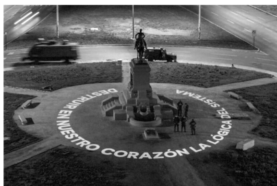
Figure 1. General Baquedano. Plaza Dignidad. Santiago de Chile.