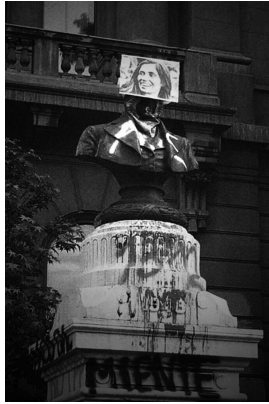
Figure 14. Monseñor Carlos Casanueva. Casa Central Universidad Católica, Santiago de Chile.

Figure 13. Reemplazo del busto de José Menendez Braun por homenaje a pueblos originarios, Plaza Muñoz Gamero, Punta Arenas, Chile.