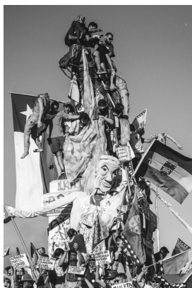
Figure 5. General Baquedano. Plaza Dignidad. Santiago de Chile.