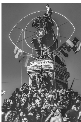
Figure 4. General Baquedano. Plaza Dignidad. Santiago de Chile.