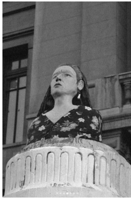
Figure 15. Monumento a Pedro Lemebel, Casa Central Universidad Católica, Santiago de Chile.