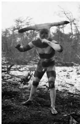
Figure 12. « Halahaches O Kotaix », Selkman, Patagonia. Martin Gusinde. 1923.