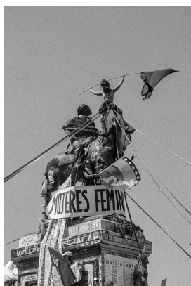
Figure 8. General Baquedano. Plaza Dignidad. Santiago de Chile.