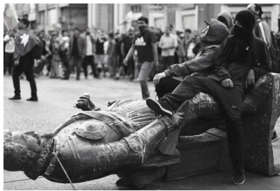
9. Pedro de Valdivia. Plaza Independencia. Concepción. Chile.