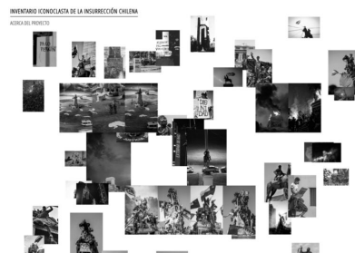
Figure 2. Capture d'écran du site internet hébergeant l'« Inventario Iconoclasta de la Insurrección Chilena », en date du 20 mars 2021.