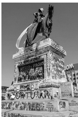
Figure 6. General Baquedano. Plaza Dignidad. Santiago de Chile.