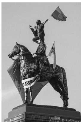
Figure 7. General Baquedano. Plaza Dignidad. Santiago de Chile.