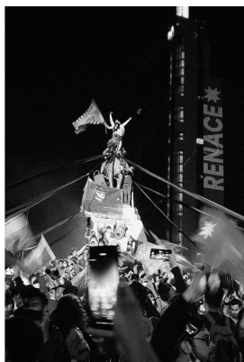
Figure 3. General Baquedano (Renace). Plaza Dignidad. Santiago de Chile.