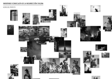
Figure 2. Capture d'écran du site internet hébergeant l'« Inventario Iconoclasta de la Insurrección Chilena », en date du 20 mars 2021.