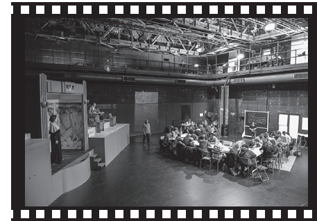
Pièce d'actualité n° 8 : Institution , de M.-J. Malis (création 2017)