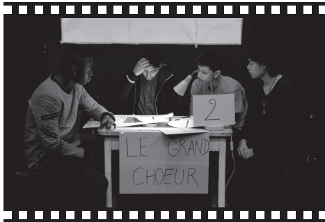
Celui qui dit oui, celui qui dit non de B. Brecht. Mise en scène Maxime Chazalet (création 2018)