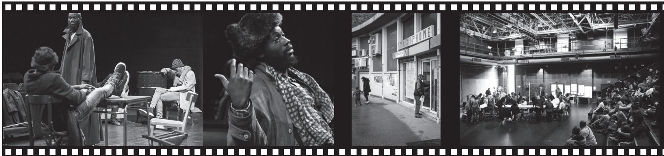
Sur la Grand'route d'après A. Tchekov, mise en scène Émilie Hériteau