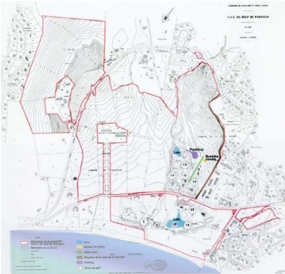
Figure 3 : Plan de la ZAC de Pardigon

en faveur du golf, d'abord une première fois le 1 er février 1974, puis une seconde fois le 8 octobre 1975 sur un projet de golf de 18 trous augmenté de 87 000 m 2 de constructions. Ces volontés locales sont relayées par les services de l'État, alors seuls compétents en matière d'urbanisme et d'aménagement. Le 19 juillet 1976 un arrêté ministériel crée ainsi la Zone d'Aménagement Concerté (ZAC) de Pardigon (figure 3).