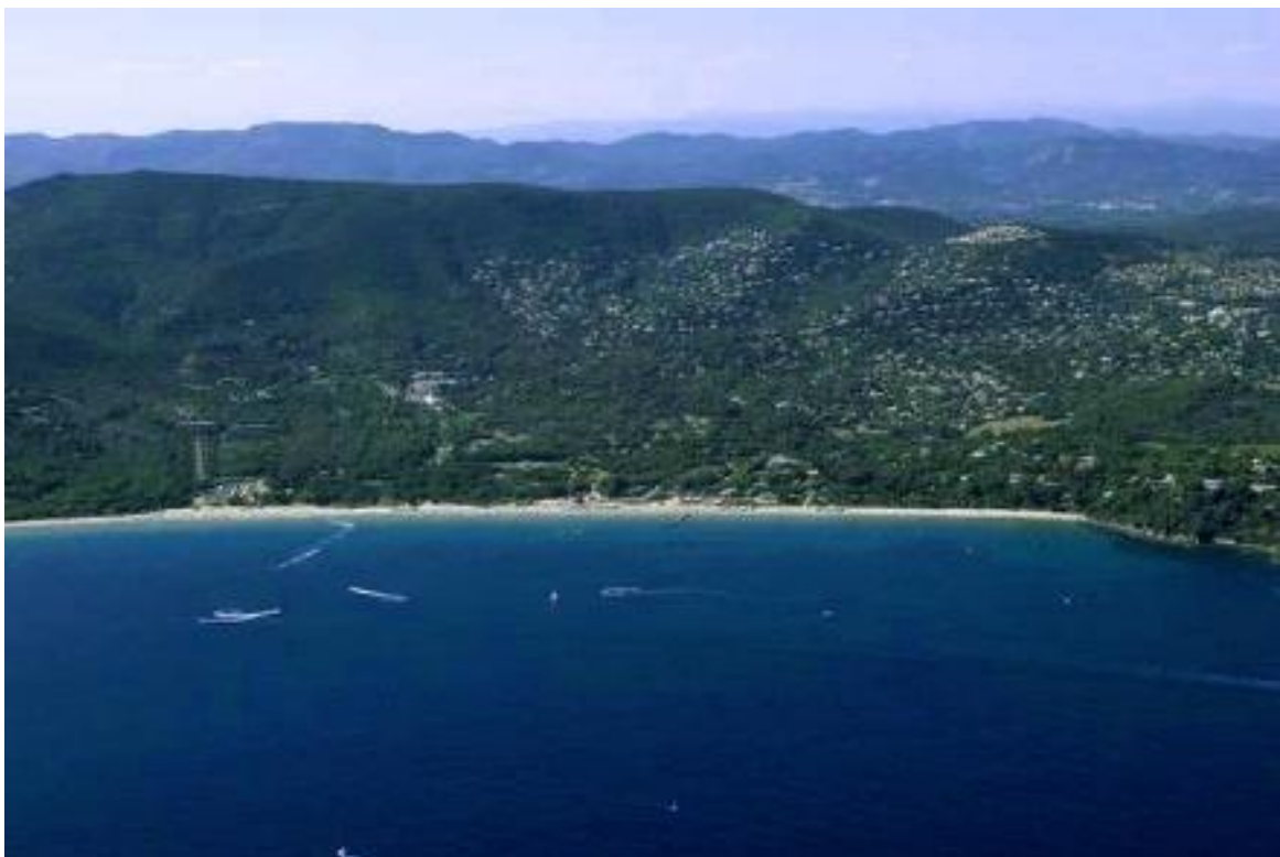
Figure 2 : Vue aérienne du site de Pardigon adossé à la corniche des Maures.

Le site de Pardigon est aujourd'hui une vaste coupure dans l'urbanisation du littoral de 87 hectares de terrains s'inscrivant dans un ensemble plus vaste formant, à partir de la ligne de crête, un amphithéâtre qui s'étend du massif des Maures jusqu'à la mer, bordant la baie de Cavalaire (Figure 2).