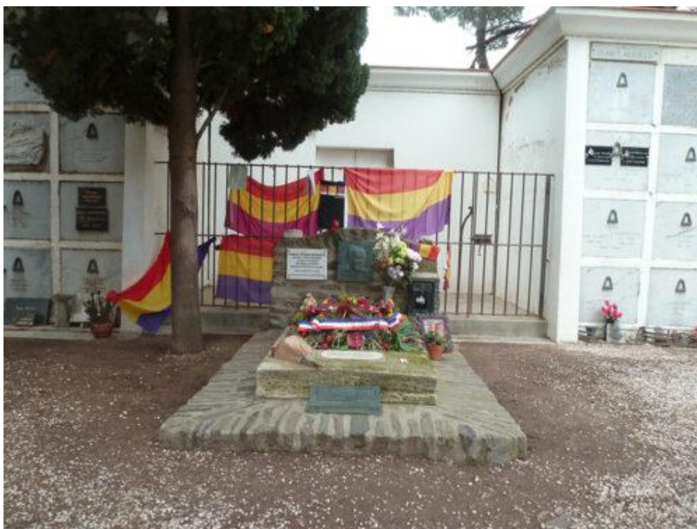
Tombe d'Antonio Machado et de sa mère. Voir en annexe, document 1.

Si les morts de la Retirada devaient se résumer à un symbole, toujours vivant aujourd'hui, ce serait celui de la tombe du poète Antonio Machado située dans le cimetière ancien de Collioure, petite cité balnéaire des Pyrénées-Orientales non loin de la frontière espagnole.