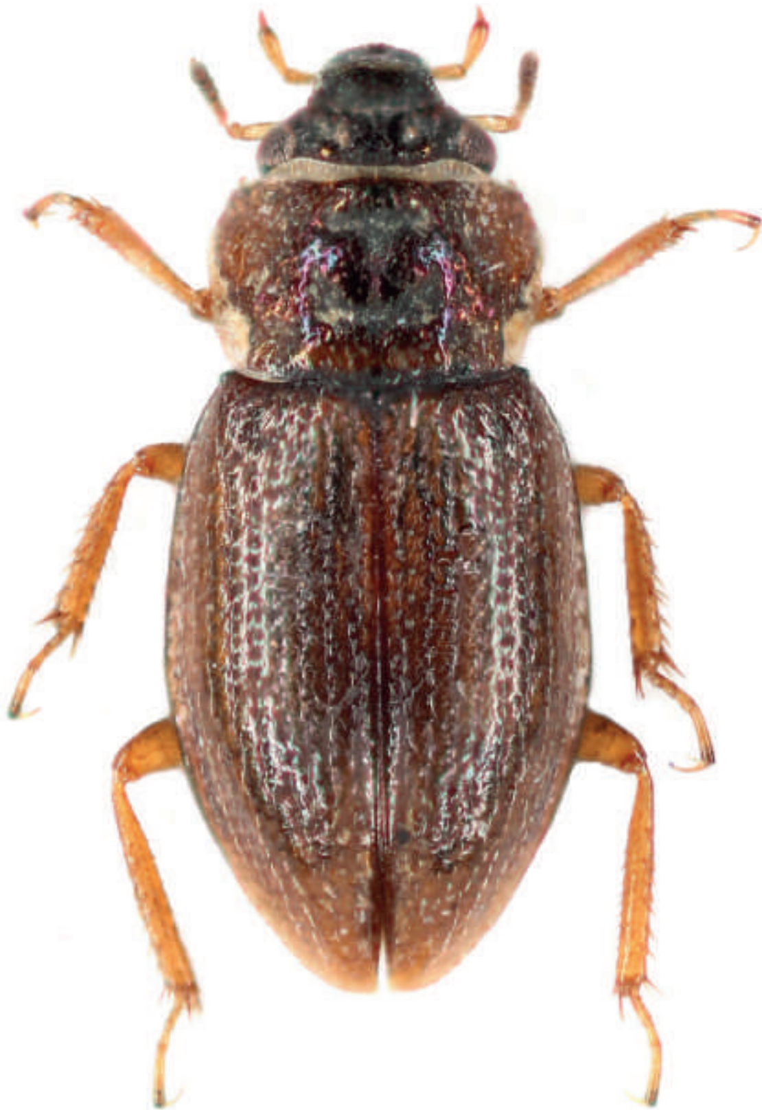
Fig. 3 : Ochthebius deletus Rey, 1885 des marais des Estagnets, Hyères (Var).