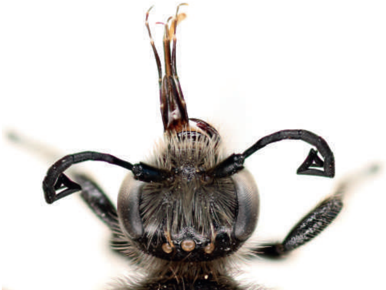
Fig. 1 : Systropha curvicornis (Scopoli, 1770) mâle, détail de la tête montrant les antennes caractéristiques du genre Systropha.

Albanie, Roumanie, Bulgarie, N. Turquie, Ukraine, Oural. Elle recherche particulièrement les grandes surfaces de sol nu ou à végétation clairsemée, comme en bordure de vignes ou sur des talus.