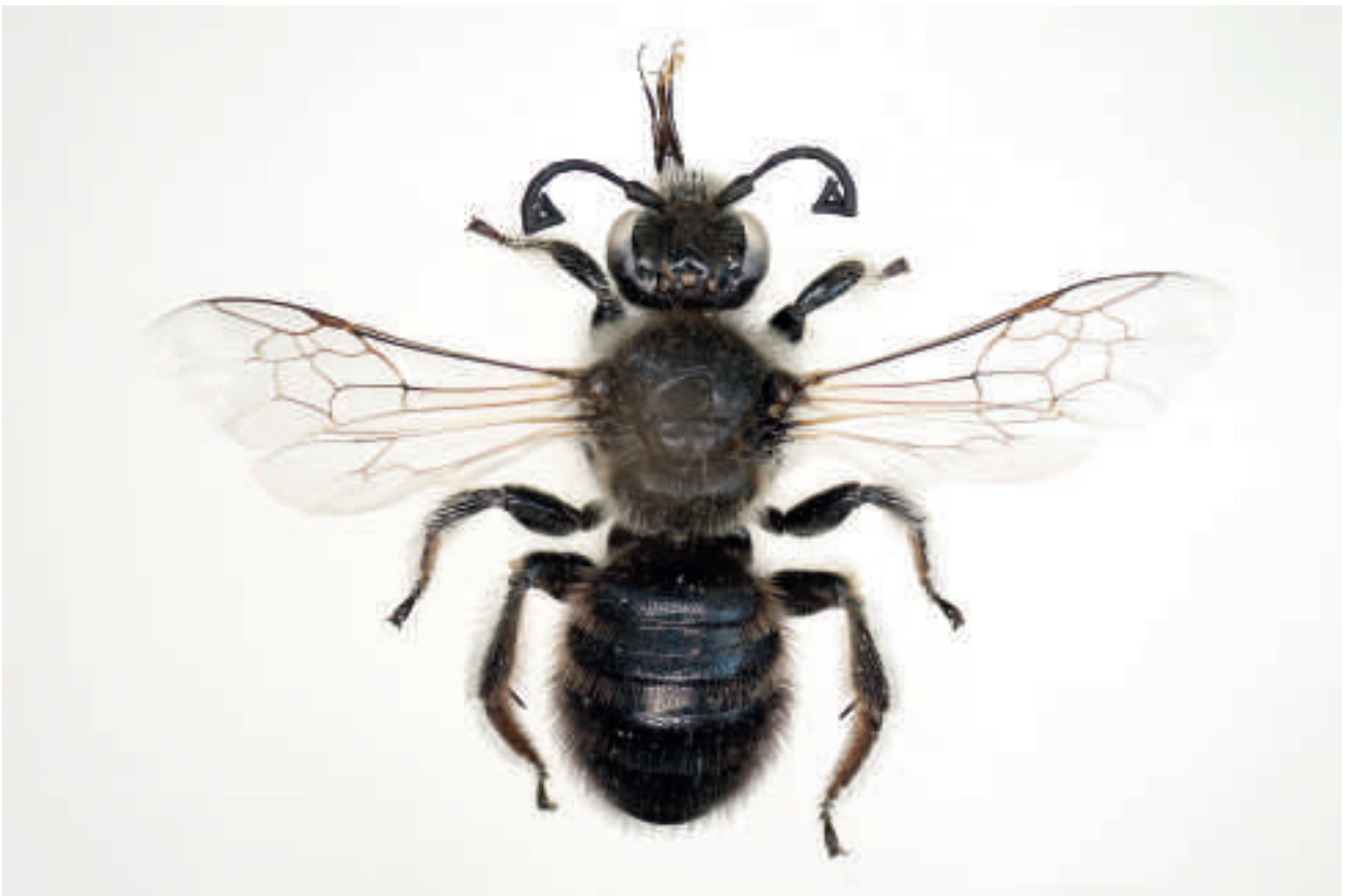
Fig. 3 : Systropha curvicornis (Scopoli, 1770) mâle.