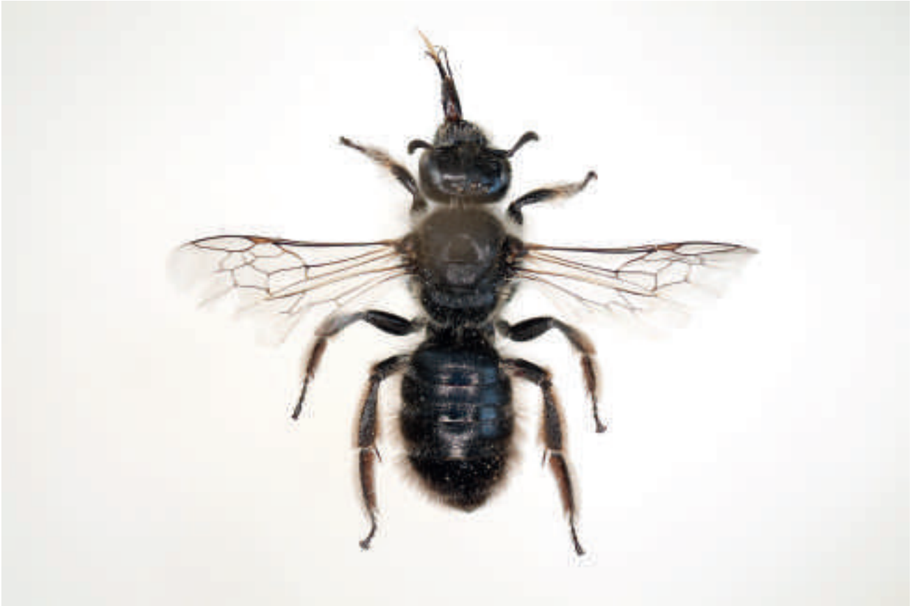
Fig. 2 : Systropha curvicornis (Scopoli, 1770) femelle.