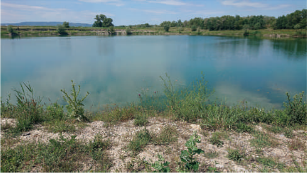
Fig. 6 : Vinon-sur-Verdon, les Iscles-de-Notre Dame, lieu de capture de Systropha curvicornis (Scopoli, 1770).