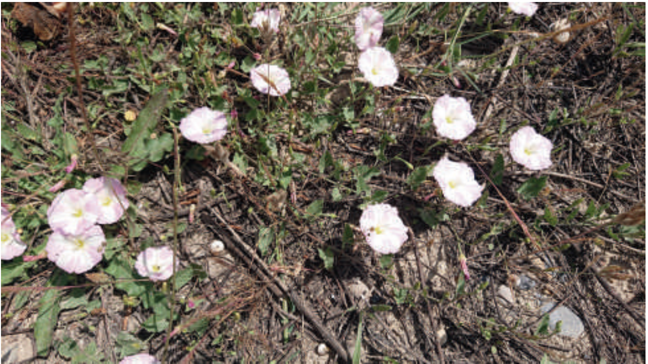
Fig. 5 : Convolvulus arvensis L. (Photo É. Gabiot).

- Pourcieux, près du cimetière, quelques spécimens observés le 20 juin 2021, toujours sur ( Convolvulus arvensis L.) (PP).